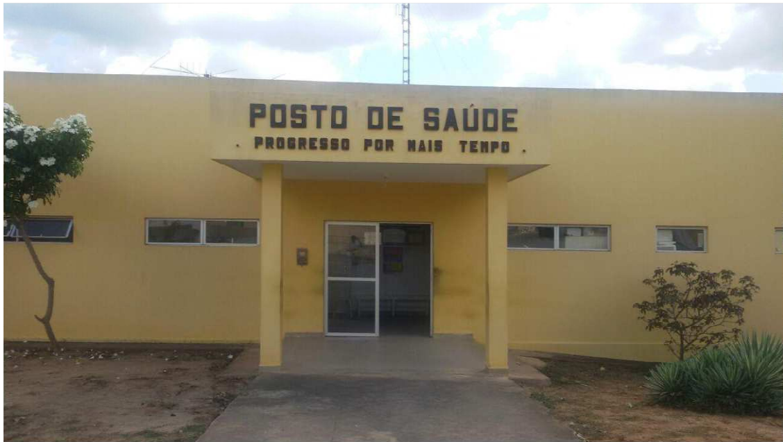
Figura 1. Unidade Básica de Saúde da Família I.