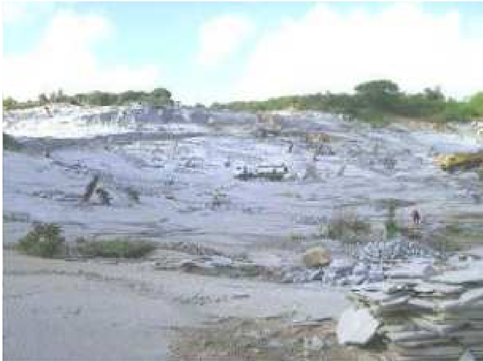
Figura 4. Trabalhadores na pedreira do município de Dona Inês.