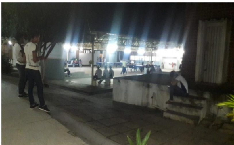
Figura 2 - Auditório da Escola

O local em que está inserido a escola representa um segmento de classe média e são bem servidos de infraestrutura. Suas vias de acesso são asfaltadas, sua atividade econômica predominante é o comércio, aos domingos é realizada uma feira livre, a qual atende aos moradores do bairro e de outros da própria cidade. Com uma clientela distinta, com alunos do próprio bairro na sua maioria.