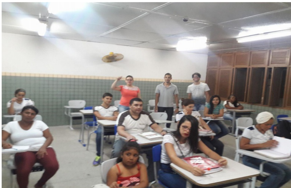
Figura 3 – Sala de aula, com alunos realizando atividades.

Observou a disposição de espaços que devem se configurar no ambiente escolar, tais como: quadra de esportes, área de recreação e sala de informática com 60 computadores. A Escola está com suas dependências em bom estado de conservação, possui salas arejadas, é um ambiente agradável e acolhedor. Atualmente, possui uma diretora, duas secretarias e 26 professores. Na Figura 3 observa-se a sala de aula com alunos, realizando atividades.