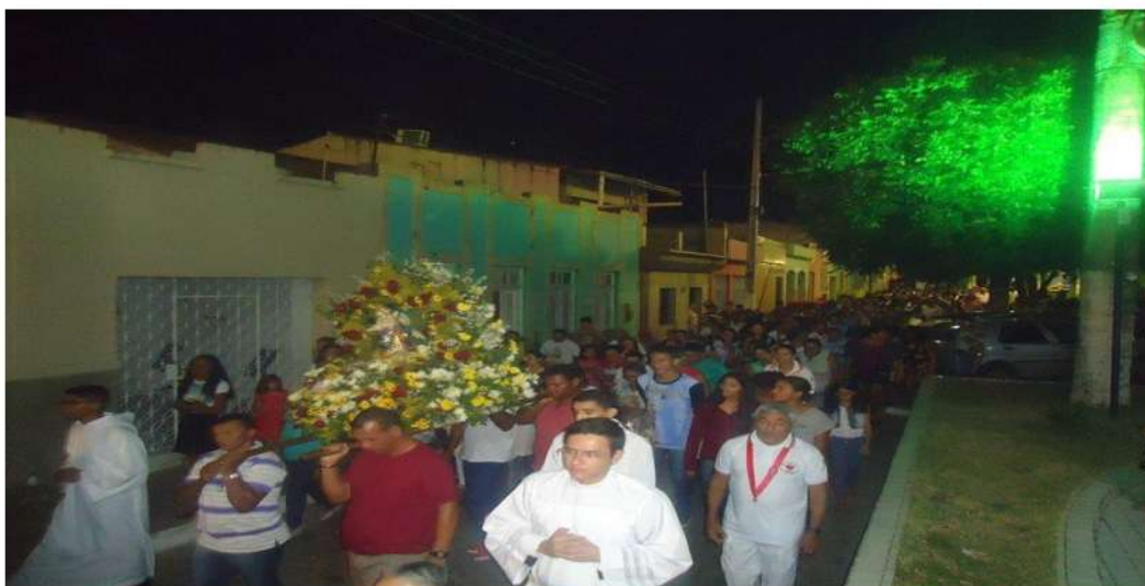
Figura 03-Procissão de encerramento do novenário de Nossa Sra. do Rosário, Cuitegí/PB