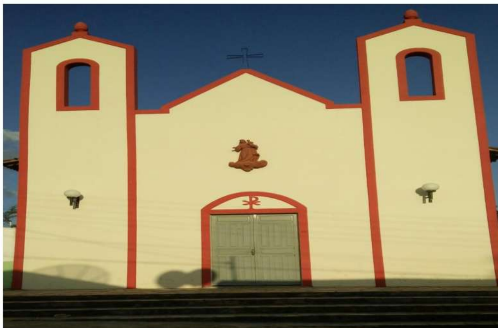
Figura 09-Capela de Santo Antônio no bairro de Santo Antônio, Cuitegi/PB

Fonte: Arquivo da Autora, outubro de 2018.