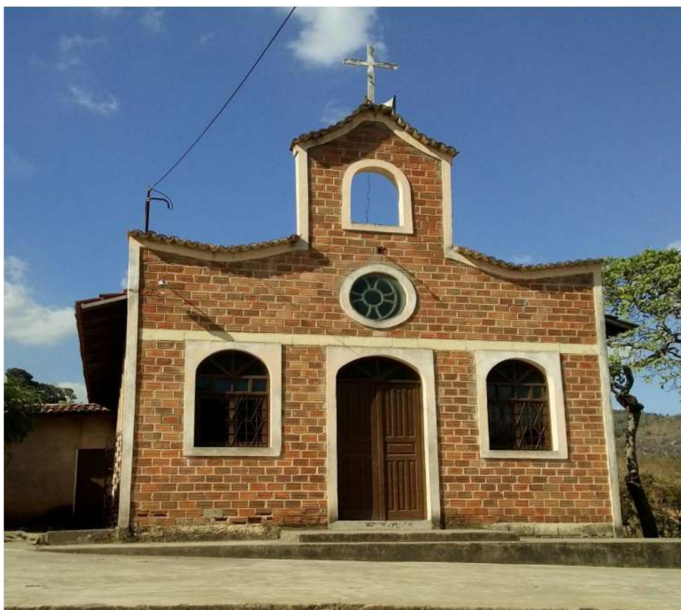
Figura 13-Capela Cristo Ressuscitado, Sítio Palmeira- Zona Rural

Fonte : Arquivo da autora, setembro 2018