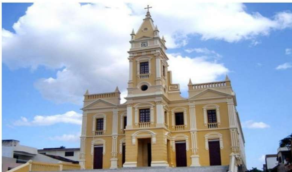
Figura 01-Igreja de Nossa Senhora da Luz, Guarabira