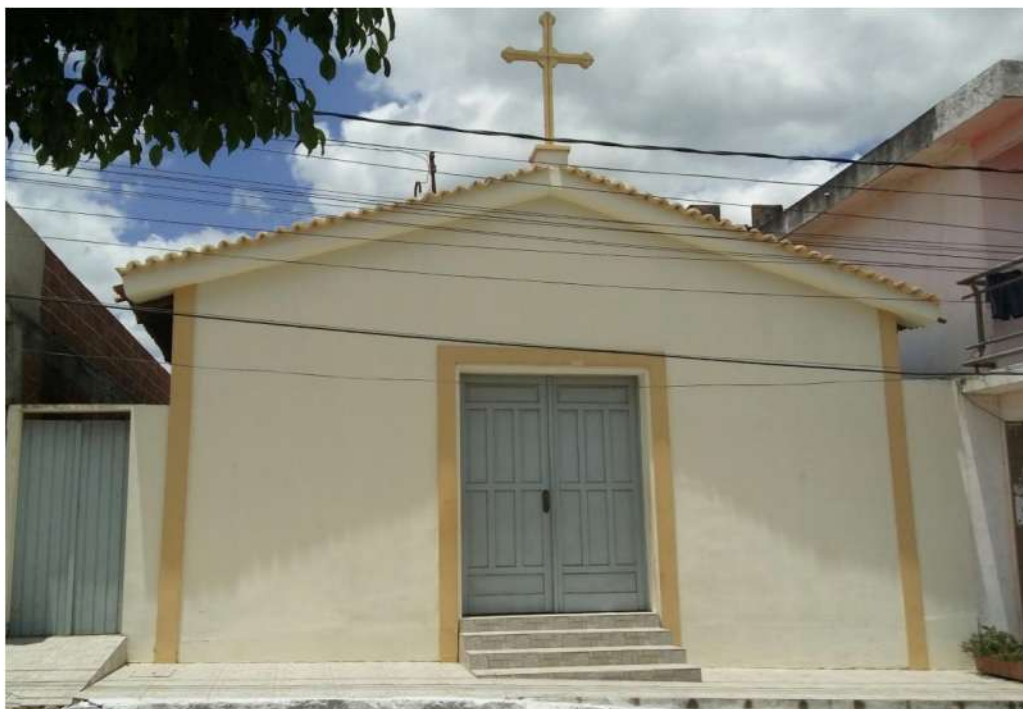
Figura 10-Capela Nossa Senhora Aparecida, Bairro do Cruzeiro, Cuitégí/PB

Fonte: Arquivo da autora, agosto de 2018