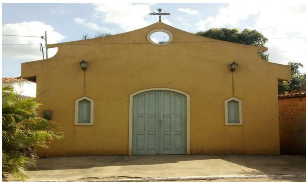
Figura 11-Capela Nossa Senhora de Fátima. Chã do Bodeiro – Zona Rural.

Também vale destacar a importância das comunidades eclesiais de base, localizadas na zona rural do município. Um dos locais de destaque é a comunidade Rural Chã da Boa esperança, popularmente conhecida como Chã do Bodeiro, devido a tradição local, dos moradores e do Matadouro público que funciona nessa comunidade, tendo atraído para o local, bares e restaurantes ruais que servem, carne de bode, pirão, buchada, galinhas de capoeira com feijão verde. No local existe a Capela de Nossa Senhora de Fátima que é frequentada pelas mais de 70 famílias que vivem no local. Na chã do Bodeiro, todas as famílias possuem grau de parentesco e tradicionalmente são acostumados ao abate de bois, cabras, ovelhas e porcos que abastecem, tanto a comunidade, quanto a feira livre e o mercado público de Cuitegi. A capela é uma construção recente e muito importante, devido ao isolamento ou distanciamento do centro urbano de Cuitegi (Figura 11):