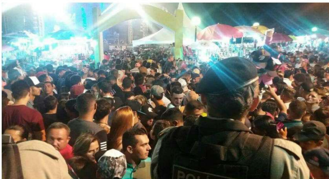
Figura 05-A grande movimentação da Festa de Reis, Cuitegí/PB