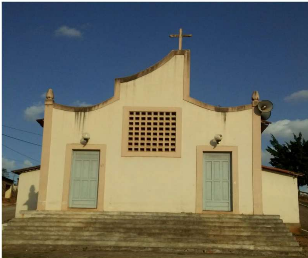
Figura 12-Capela de São Sebastião, Conjunto Roberto Paulino

Com a expansão urbana de Cuitegi, novas unidades habitacionais foram instaladas a partir de programas governamentais de habitação. O conjunto Roberto Paulino e Antônio Mariz foram construídos e se transformaram em bairros urbanos, próximos ao centro da cidade, mas os organizadores da Igreja Católica local, na perspectiva de atender os moradores destes dois conjuntos habitacionais resolveram instalar a Capela de São Sebastião (Figura 12):