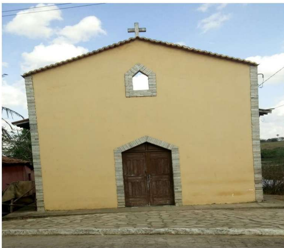
Figura 15-Capela de São José, Sítio Malhada- Zona Rural

, No Sítio Malhada iniciaram a construção de uma capela devido à necessidade no local que levavam as missas a serem realizadas na casa da população. Hoje eles reclamam da ausência dos fiéis que participavam muito mais quando não tinham um espaço reservado para a comunidade, comentam seu afastamento e saudade dos tempos da comunidade numerosa e atuante a capela de São José foi idealizada por todos os moradores da localidade do povoado (Figura 15):