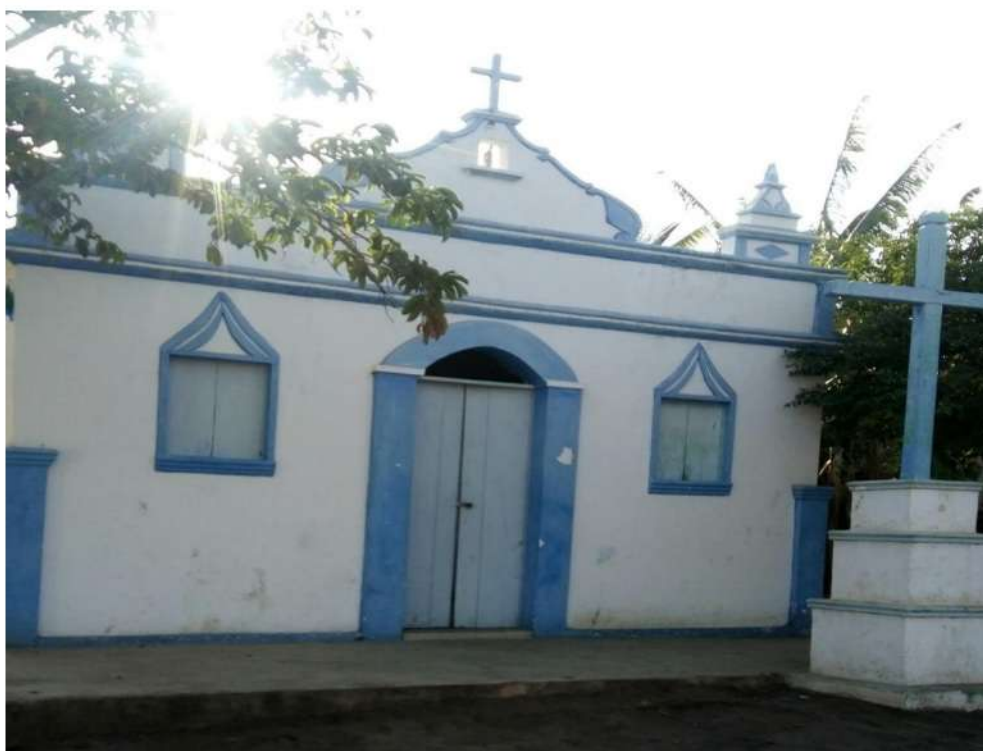
Figura 14-Capela nossa Senhora das Graças, Sitio Mucunã

Os sítios e seus povoados, da zona rural de Cuitegí, mantêm uma forte tradição católica, marcados com um espaço do sagrado, representado pelas capelas, a exemplo da capela de Nossa senhora das Graças que fica no Sitio Mucunã (Figura 14):