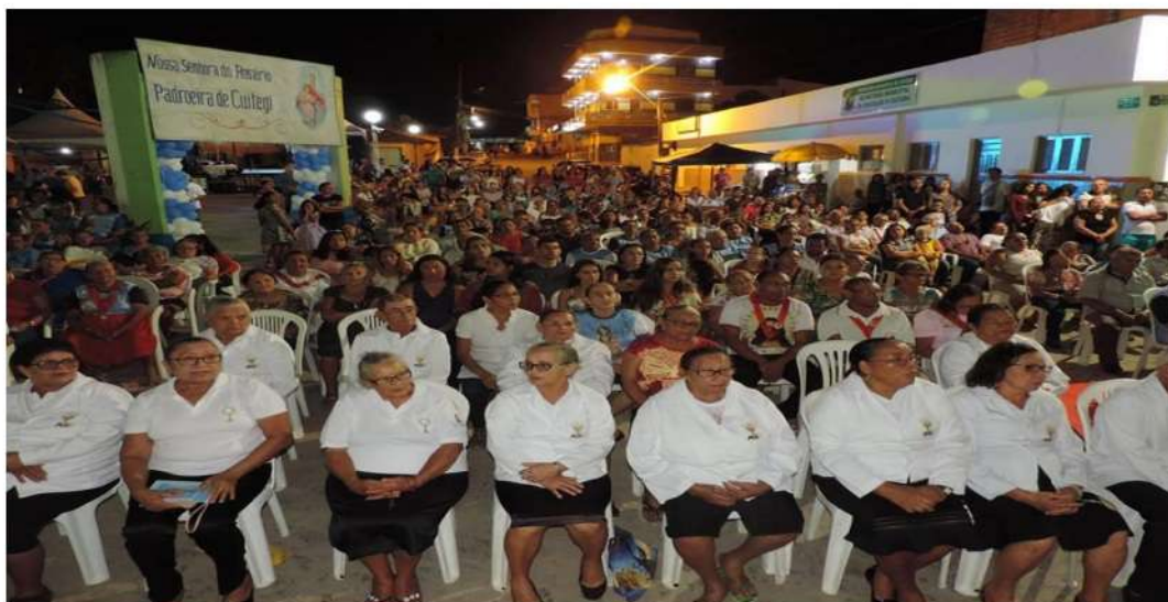
Figura 08- Encerramento do novenário de Nossa Senhora do Rosário. Cuitegi/PB, 2018