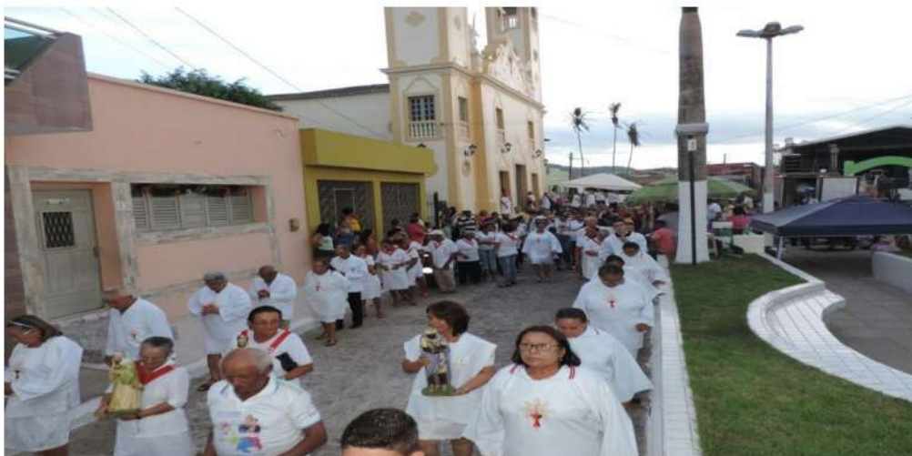
Figura 04- Procissão de Reis na cidade de Cuitegí/PB