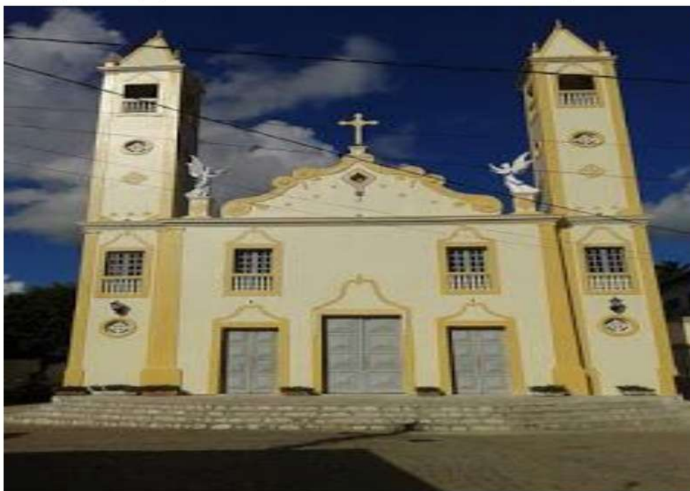
Figura 07- Igreja Matriz de Nossa Senhora do Rosário em Cuitegi/PB, 2018