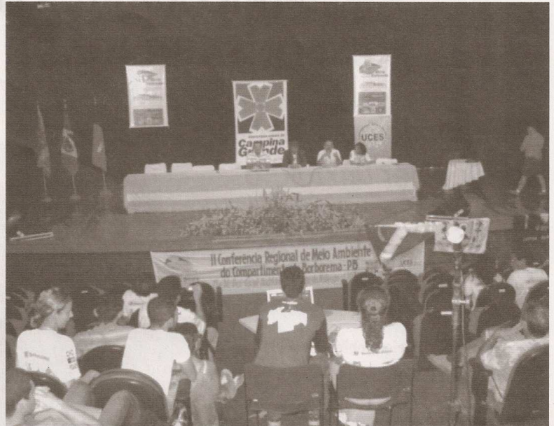
II Conferência Regional de Meio Ambiente

Uma das contribuições trazidas pela Conferência Municipal de Meio Ambiente foi a ampliação do Fundo Municipal do Meio Ambiente e a deliberação de um projeto para a criação de uma Secretaria de Meio Ambiente no município. Na conferência também foi elaborado