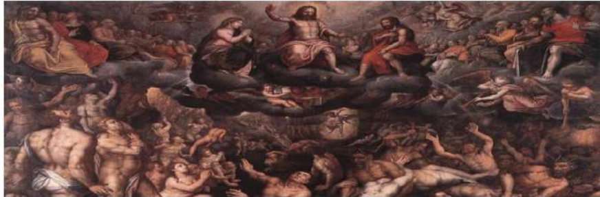
Figura 2 O julgamento final. 8

Essa imagem é intitulada O Julgamento Final , pela referência de Jesus vindo nas nuvens para buscar os salvos. Vemos pessoas suplicando, como se pedissem a chance de também serem salvas, mas bem ao fundo vemos pessoas sendo atormentadas por demônios enquanto suplicam por socorro. Essa imagem só fortalece a ideia de que, se você não é enviado ao céu nada revogará essa sentença, pois, segundo a ideia de purgatório, se passaria pelo sofrimento para remir seus pecados e ascender aos céus para glória eterna. Então, se há almas sendo atormentadas mesmo na hora do grande julgamento, logo, a ideia do purgatório não faria sentido, como apontam, por exemplo, os cristãos protestantes.