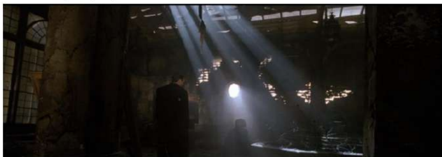
Figura 9 O isolamento de Annie. Disponível em: Netflix

Cris também estaria correndo risco de ser afetado pelo lugar, pois era o reflexo do que eles viveram. Sendo tão familiar para eles, aquele lugar tinha como único objetivo drenar todos os bons sentimentos deles e aprisioná-los em seu próprio sofrimento. Cris percebe que o lugar nada mais é do que uma representação da sua casa. Ela se encontra abandonada, destruída, suja e escura. Lá dentro se encontra Annie, extremamente abalada e desequilibrada. Essa representação foi feita para representar a destruição da família, da sanidade de Annie e a volta da profunda depressão adquirida após a morte dos filhos, que já tinha sido superada. Um reflexo do quão prejudicada ela se encontrava ao morrer.