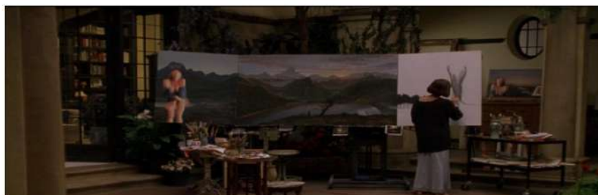
Figura 3 O lugar perfeito de Cris e Annie em pintura.

Segundo o filme, o céu é um universo particular de cada alma. Para Cris, sua ideia de céu era o lugar perfeito idealizado juntamente com sua esposa. Esse lugar seria uma pintura que Annie, que era uma pintora muito talentosa e grande conhecedora de artes, fez representando o lugar onde eles se conheceram e sua casa dos sonhos, onde poderiam viver em paz para sempre.