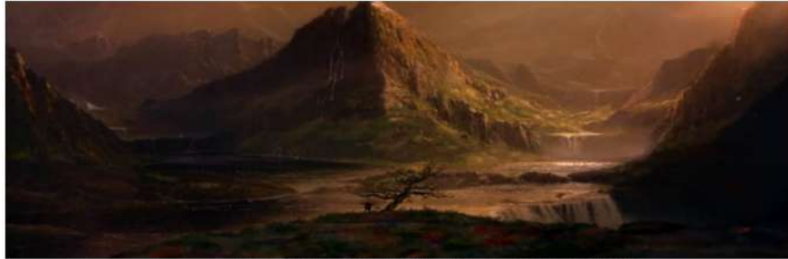
Figura 4 O céu de Cris.

Essa mesma visão de céu é perceptível quando Cris encontra sua filha Marie, que está com sua aparência alterada, mas que o pai logo percebe quem ela é. Essa alteração de aparência é explicada um pouco mais a frente no filme, com a justificativa de que eles (os filhos) teriam que se apresentar ao pai de forma anônima, para que ele entrasse naquela nova fase sem pesos e sentimentos da sua vida terrena. Pai e filha se encontram e vão para um lugar onde só há pessoas ajudando outras. Essas pessoas voam e podem fazer coisas que jamais poderiam ser feitas enquanto estivessem na Terra. Essa era a visão de céu que Marie tinha antes da morte, que ela adquiriu em uma pequena escultura que ela possuía em seu quarto e que ela sempre indagava o pai se aquela era a forma do céu.