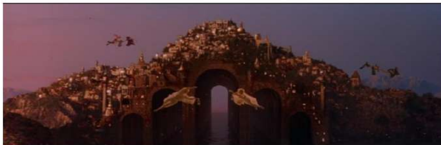
Figura 6 Visão do céu de Marie ao longe.