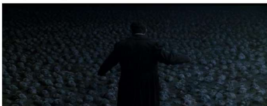
Figura 8 O temido chão de rostos imaginado por Annie.

O inferno de Annie, como no céu do seu marido e filha, é um lugar particular dela. Um lugar sombrio e de sofrimento baseado nos seus próprios medos. Em um diálogo com o marido, Annie diz que quando está insegura e com medo de dançar, ela imagina que está em um chão cheio de rostos e esse chão está presente na chegada de Cris ao universo particular e sofrimento dela. Pode-se observar essa representação na imagem abaixo: