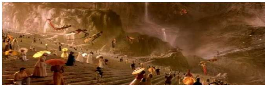
Figura 7 Interior do céu de Marie.

Como Marie era criança, ao falecer, sua alma continuava jovem e isso refletia na sua visão de mundo, de vida e de morte. Depois de sua chegada ao pós-morte, tanto ela quanto Ian, seu irmão, puderam amadurecer e entender como superar a morte e fazer daquele lugar sua morada, onde poderiam ajudar outras almas recém-chegadas a encontrar um sentido para a morte e para tudo que iria suceder naquele momento.