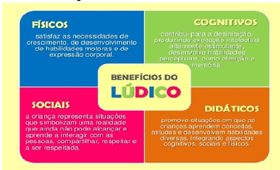
Figura 1: Benefícios da atividade lúdica

Segundo Cruz (online), professora orientadora e atuante na formação do PNAIC, a atividade lúdica possibilita benefícios ao desenvolvimento infantil, em todos os aspectos sejam eles social, cognitivo, didático e físico, conforme a autora ilustra na figura 1. Por isso deve ser vislumbrada com seriedade, também voltada para a aprendizagem no contexto escolar, desde a educação infantil.