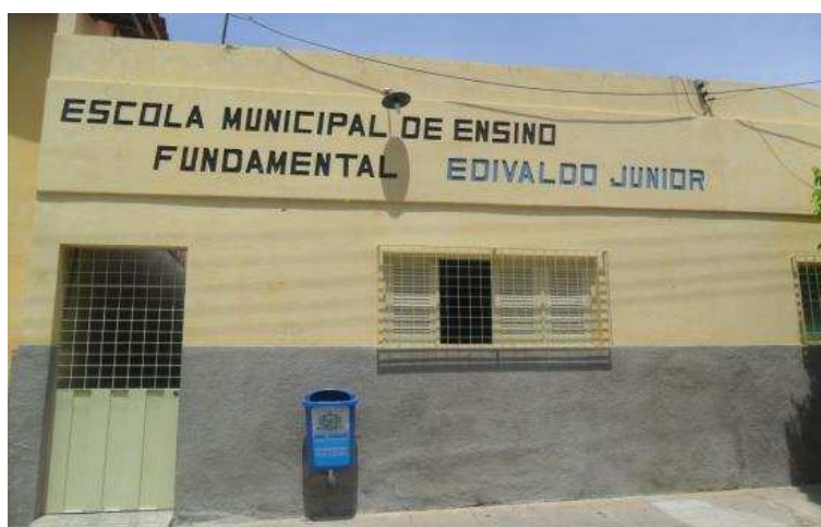
Figura 4: Fachada da escola

Em 29 de julho de 1998 foi fundada no município de Mãe D'Água PB a Escola Municipal Edivaldo Júnior Soares da Rocha (figura 4), campo do estágio-pesquisa aqui relatado. Criada pelo decreto da lei nº 148/98 de 01 de julho de 1998, recebeu esse nome em memória a um jovem estudante que faleceu aos 19 anos. Posteriormente, devido às mudanças ocorridas no processo educacional, sua nomenclatura foi alterada para Escola Municipal de Ensino Fundamental Edivaldo Júnior Soares da Rocha.