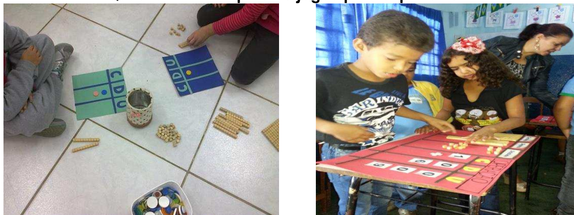
Quadro 4 – Exemplos de jogos para explorar SND

O sistema de numeração decimal possui regras que podem ser exploradas e apreendidas por meio do jogo, como exposto no quadro 4, no contexto da sala de aula do ciclo de alfabetização. Neste aspecto destaca-se a atividade lúdica associada a característica fundamental do jogo como atividade livre que permite propor, produzir e resolver situação-problema.