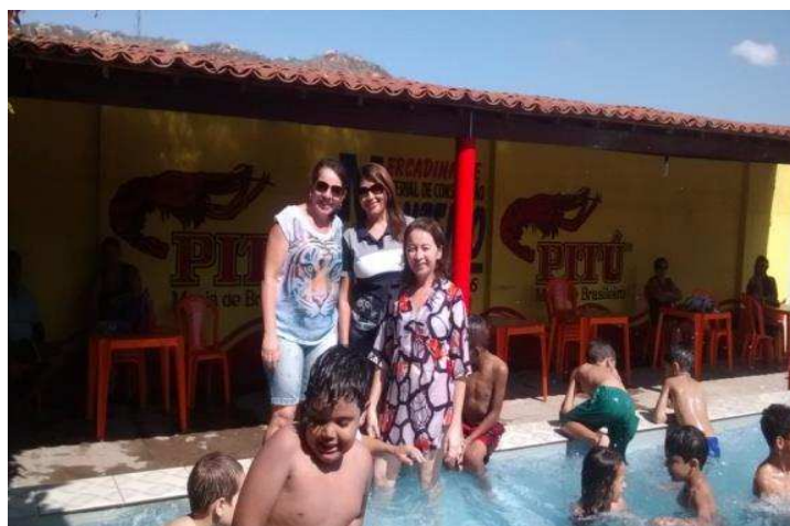
Figura 5: Fotos do banho de piscina

No segundo dia, a observação não foi na escola Edivaldo Júnior Soares da Rocha, as crianças foram para um piquenique em uma área de lazer com banho de piscina, como mostra figura 5. A criançada se divertiu pra valer, com risos e mergulhos.