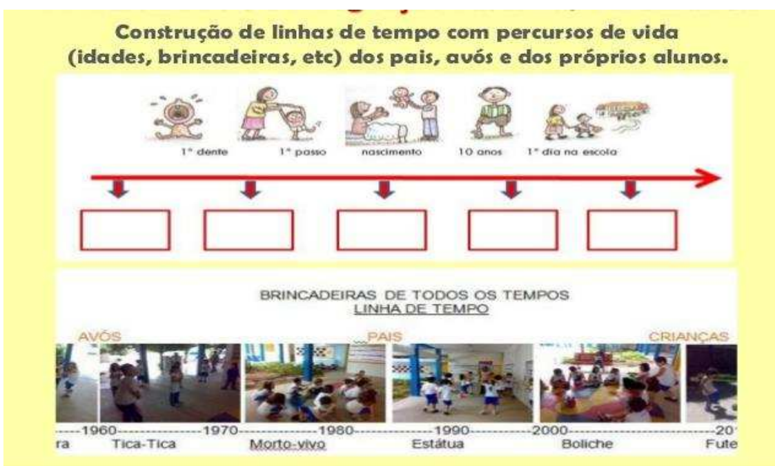
Figura 3: A ludicidade e a integração História-Matemática

Observa-se que o PNAIC (BRASIL, 2014a, 2014b, 2014c) é um programa que defende o diálogo entre diferentes áreas dos conhecimentos, tal como proposto na figura 3, pois evidencia um trabalho educativo compromissado com a alfabetização, a partir de cada eixo temático apresentado nos cadernos de formação de professores.