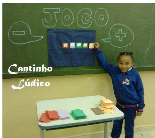
Figura 2 – Exemplo de jogo matemático

O jogo como recurso didático é um importante aliado para o ensino da matemática, além disso estimula a socialização, pois pode ser trabalhado em pequenos e grandes grupos, como no exemplo da figura 2. E por meio da atividade lúdica as crianças são desafiadas e estimuladas a pensar, desenvolvendo aspectos emocionais e cognitivos, passando a ser cooperativas e responsáveis.