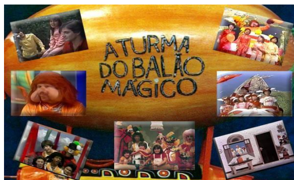
Figura 2: Chamada para televisão do programa infantil Balão Mágico