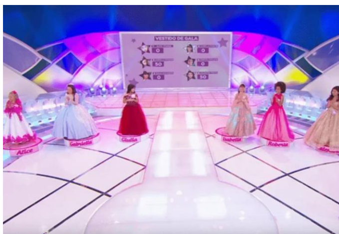
Figura 4: Concurso Miss Infantil