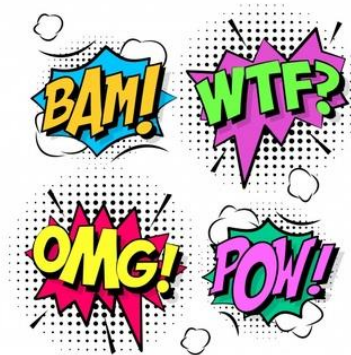
Figura1: Imagens representativa sobre a ligação do verbal com o visual.

Pellegrini (2003) também discute sobre essa abordagem em seu ensaio Narrativa verbal e narrativa visual, possíveis aproximações . No texto, a autora aponta que mesmo com a inovação do teatro, do cinema, dos jogos e da televisão, a leitura não fica desacreditada ou em segundo plano, visto que a literatura e o campo audiovisual possuem um campo próprio, singular, que atinge seus consumidores de diversas maneiras. Contudo, é inevitável para a autora, não comentar sobre as mudanças que o texto literário vem sofrendo em seus múltiplos meios, principalmente em seu modo ficcional. Contudo, para este último, essas mudanças colaboraram para destacar o alcance na sensibilidade por parte da produção e as reformulações dentro do tempo e espaço e nos personagens, bem como na estrutura em si, demonstrando que o enredo não possui um caráter apenas informativo.