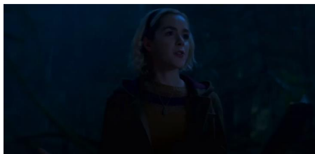
Figura 2: O mundo sombrio de Sabrina (A ressurreição). Tradução nossa.

Isso permite que o docente crie novamente uma vantagem perante ao conhecimento dos alunos, sempre voltando ao assunto, para que enfim, a versão da cena na HQ de Sacassa possa ser apresentada no seriado O mundo sombrio de Sabrina , em sua tradução para o inglês ( Chilling adventures of Sabrina , 2018), que contém o mesmo nome da obra original do quadrinista, disponível na plataforma de streaming Netflix. Mais uma vez o processo estético, os componentes imaginários e linguísticos e a articulação estrutural da cena devem ser analisados por parte do discente para que no momento seguinte se torne pauta dentro da discussão.