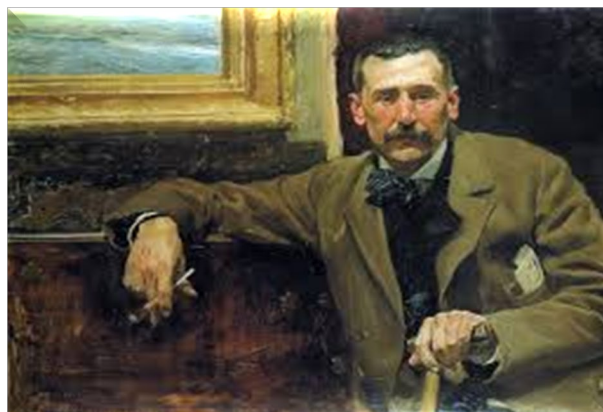
Imagen 01: Foto de Benito Pérez Galdós