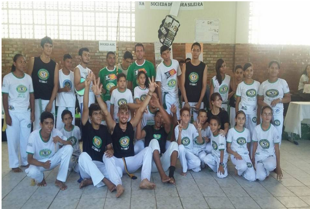
Foto 6 - Capoeira na escola

Foto tirada após a apresentação da roda de capoeira na Escola Anita de Melo, na cidade de Belém PB, 2017. Acervo Pessoal.