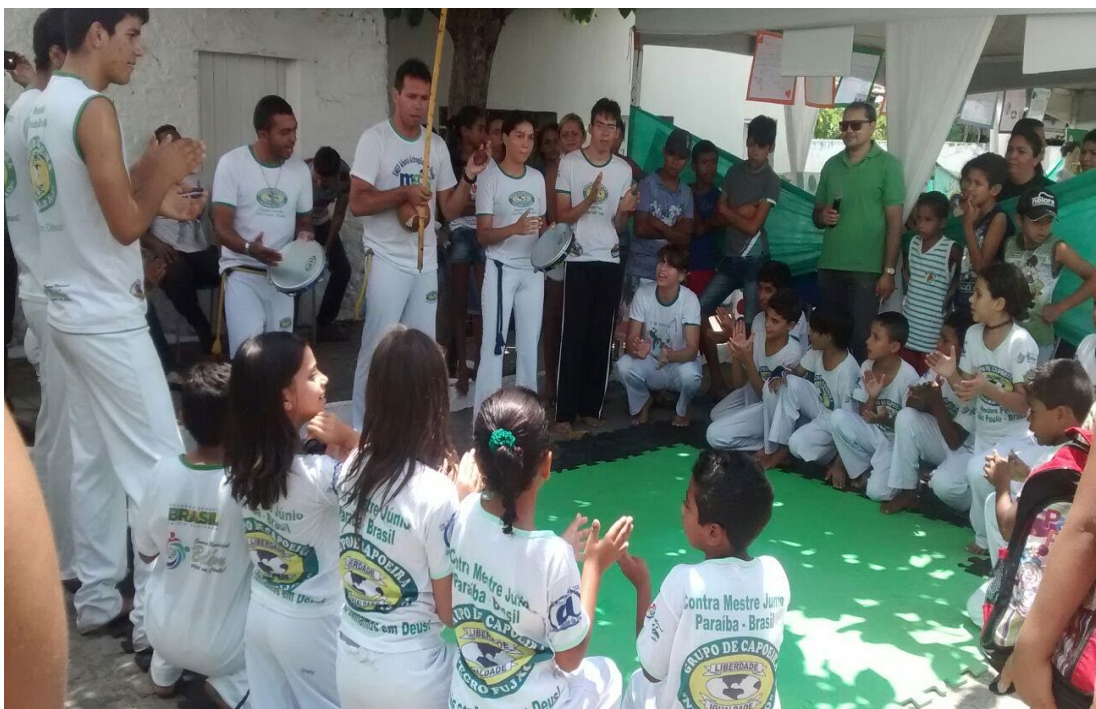
Foto 2- Roda de Capoeira apresentada nas ruas da cidade de Belém- PB, em 2016.

As rodas de capoeira incluíam as mais diversas pessoas, e não era à toa o status que essa atividade ganhava nos espaços sociais do município, o que se deve ao seu leque de inclusão, principalmente o promovido pelo PETI e PROJOVEM (Programa Nacional de Inclusão de Jovens). A capoeira atendia principalmente os jovens e adolescentes em condições de vulnerabilidade social e que moravam nas comunidades de Tribofe, Conjunto e "Favela".