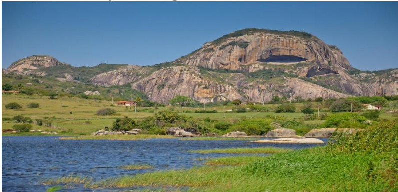
Fotografia 2 – Agreste. Parque Estadual Pedra da Boca – PB.