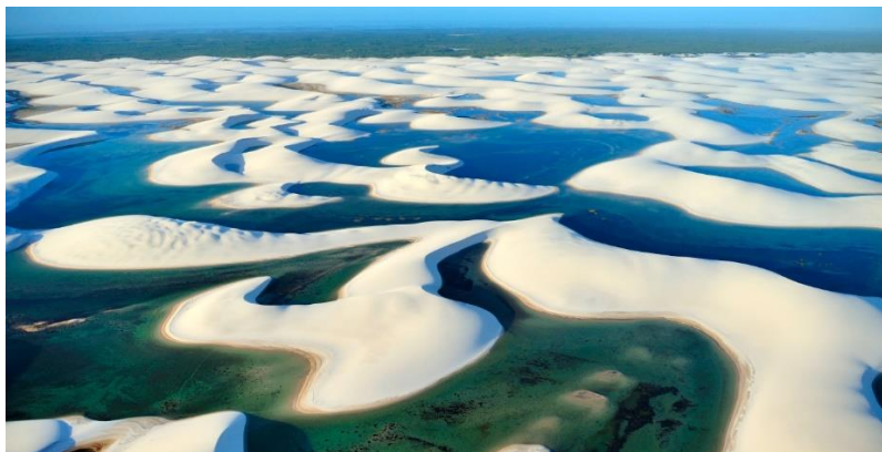
Fotografia 3 – Meio-Norte. Lençóis Maranhenses.