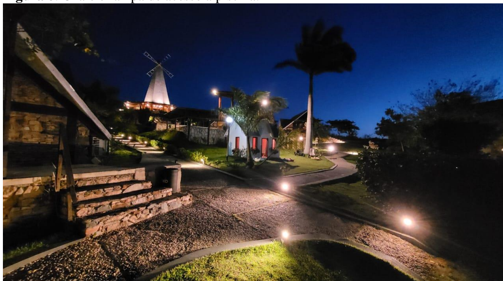
Figura 8: Chalé e rampa de acesso a piscina.