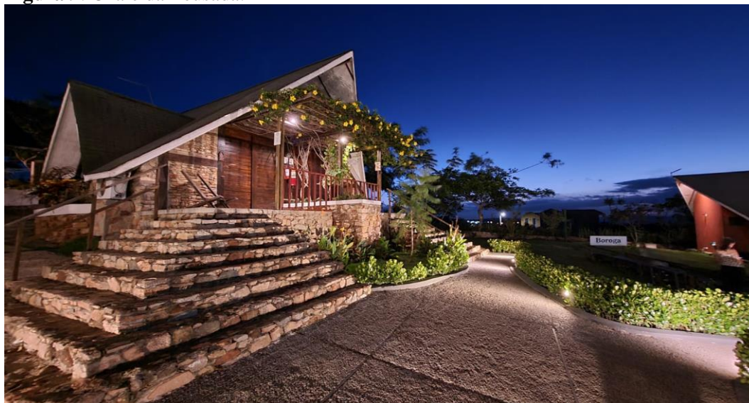
Figura 9: Chalé da Pousada.