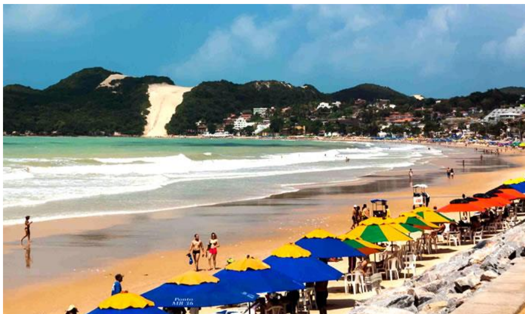
Fotografia 1 – Zona da Mata. Praia de Ponta Negra, Natal – RN.