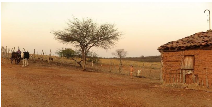
Fotografia 4 – Sertão. Interior do Ceará.