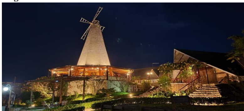
Figura 7: Restaurante do Moinho.

E para exemplificar objetivamente o que estamos trazendo a discussão no presente trabalho, dentre os muitos atrativos que o Nordeste brasileiro tem, o turismo foi escolhido para ser viés que embasará nossa análise. Apresentaremos aqui, a Pousada Pedra Grande, situada nas terras potiguares do interior do Rio Grande do Norte, na Cidade de Monte das Gameleiras – RN, que também faz parte dos roteiros turísticos mais procurados em todo o estado.