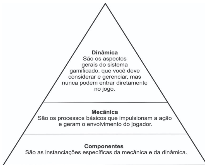
Fig.1- A hierarquia de elementos do jogo