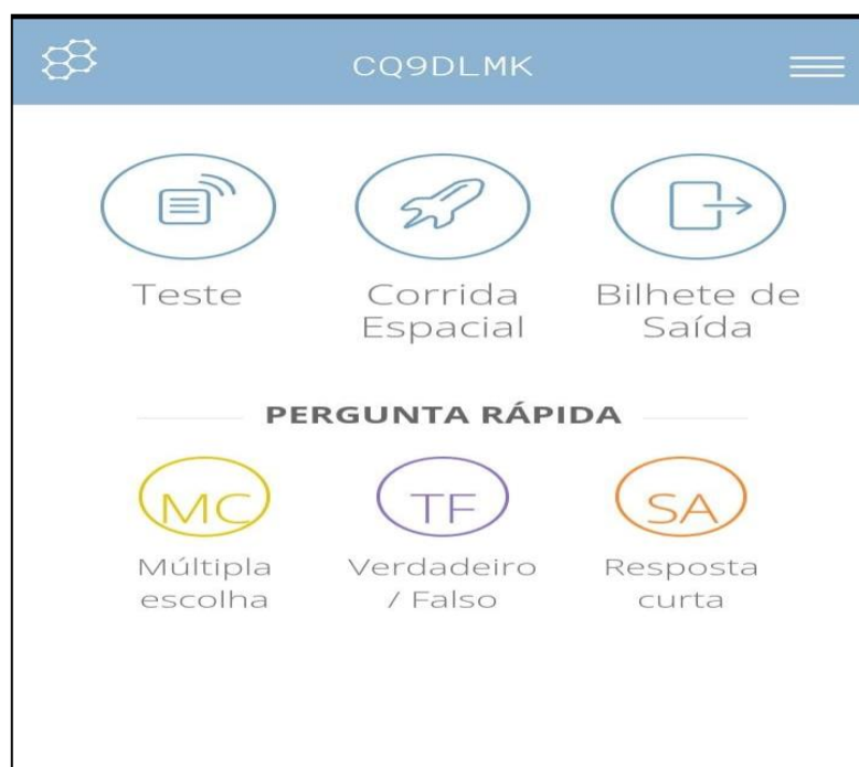
Fig.3- Captura de tela da interface do Socrative de um smartphone

conhecimentos entre os colegas. Os autores ainda afirmam que 95% dos estudantes envolvidos na pesquisa pontuaram a relevância de aprender Química com auxílio de novas metodologias, haja vista que os mesmos já possuem uma grande adaptação às tecnologias (OLIVEIRA et AL , 2022). Portanto, o uso da Gamificação se faz necessária principalmente nas disciplinas voltadas para as aulas de exatas como Química, Matemática e Física, e por sua vez, o socrative se mostra uma ferramenta promissora nesta área.