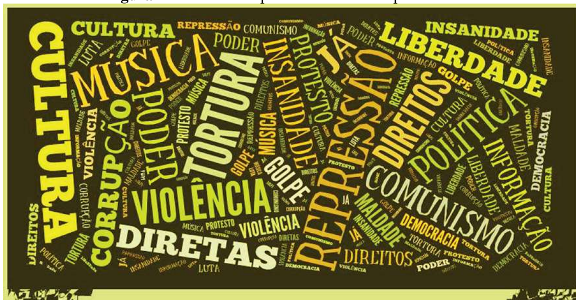
Figura 1 – “Nuvem de palavras” elencadas pelos alunos.

No segundo dia, os estudantes da escola retomaram a elaboração das histórias compostas por eles, as quais foram postadas no site do Museu da Pessoa e, posteriormente, apresentadas a todos da turma, e os alunos deveriam destacar as semelhanças e diferenças e como poderiam ajudar e entender a História e como o trabalho do professor em sala estava relacionado com o que foi aprendido. Posteriormente, foram trabalhadas as palavras-chave escolhidas pelos discentes, suas experiências com a oficina e a importância do Museu como espaço para qualquer cidadão contar suas histórias de vida. O uso da Web foi importante na pesquisa, ajudando os alunos a desenvolverem as atividades propostas.