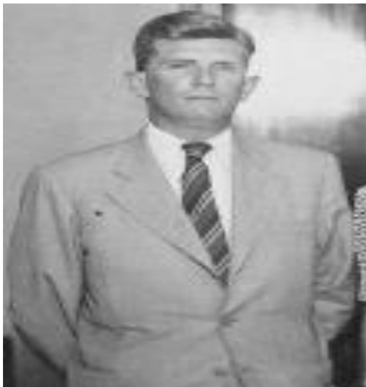
Figura 4: Pierre Monbeig.