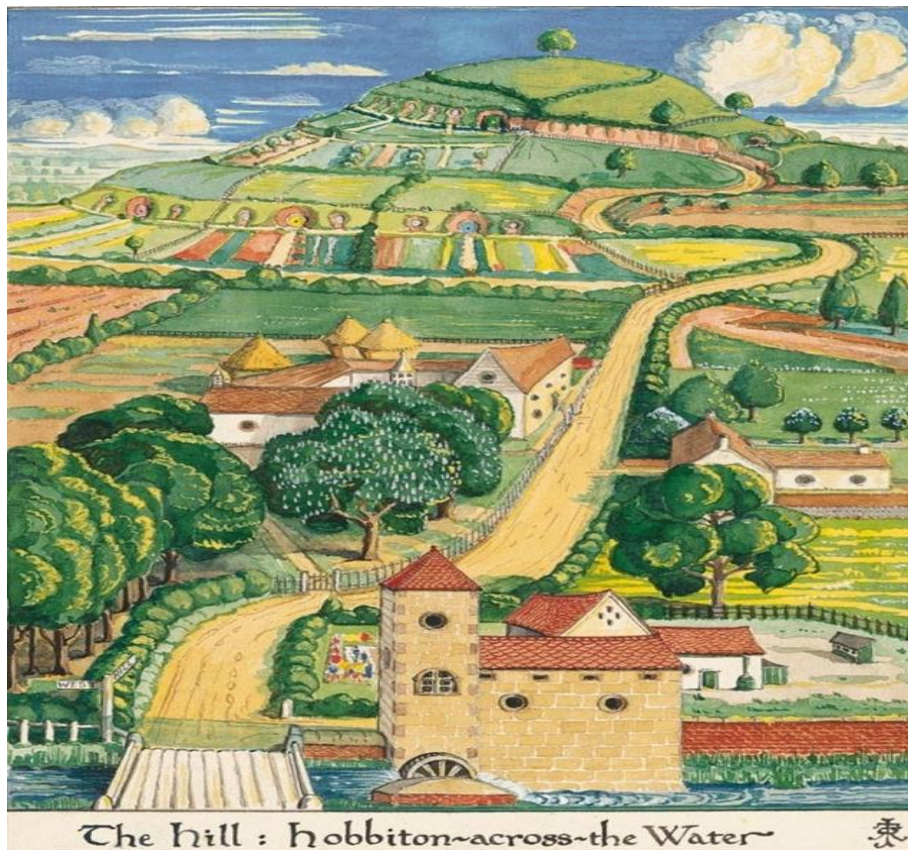
Figura 2 – A Colina

A residência de Bilbo Bolseiro está localizada no lado da Colina (The Hill), nome ligado à elevação daquela região habitada pelos hobbits, na Aldeia dos hobbits. Diante disso, Tuan (1983) traça uma relação entre espaço e lugar. Para ele, “o lugar é a segurança e o espaço é liberdade: estamos ligados ao primeiro e desejamos o outro” (TUAN, 1983, p. 3).