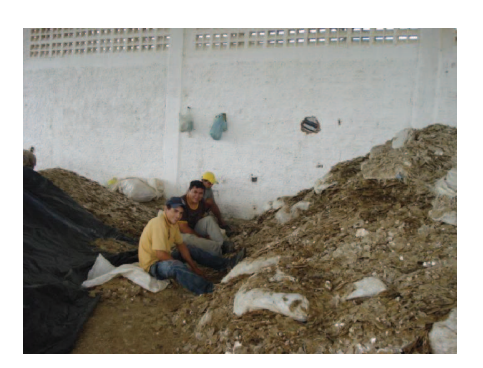
Figura 49: Funcionários trabalhando sem nenhum equipamento de segurança na