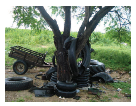
Figura 55: Restos de pneus deixados no ambiente pelos caminhoneiros.