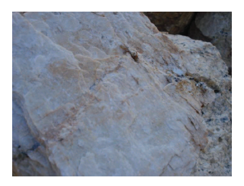
Figura 15: Feldspato puro do Alto Formiga

A província Pegmatítica da Borborema é uma região extremamente rica em "altos" (denominação dada a locais de concentração mineral, que pode ser observado na Tabela 4) e, por conseguinte em feldspato é o que os garimpeiros chamam de prego de feldspato. A diferença se dá pela pureza do minério, o que pode ser observado nas figuras 15 e 16, sendo hoje o mineral mais extraído na região. Essa extração em larga escala e de forma desordenada, acarretará no futuro a escassez do produto trazendo prejuízos enormes às empresas que dependem desse bem mineral.