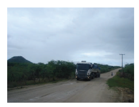
Figura 56: Carretas com excesso de peso. Pesquisa de campo (2011).

Salientando ainda que não só as grandes empresas geram desequilíbrio. Dentre os impactos ambientais mais freqüentes e mais visíveis estão; erosão, assoreamento, poeira e ruídos além dos danos causados a saúde dos garimpeiros e da população, que se encontra vulnerável a poluição causada pela mineração como é observado nas figuras 57, 58, 59 e 60.