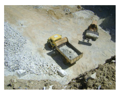
Figura 40: Caminhão carregando em mina de calcário .

do minério explorado. Nas figuras 40,41, 42 e 43 se pode ver uma destas minas em operação.