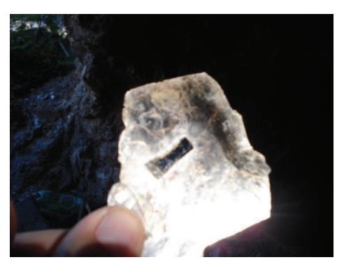
Figura 13: Turmalina encontrada dentro da Alto Mica no Alto Maracajá.