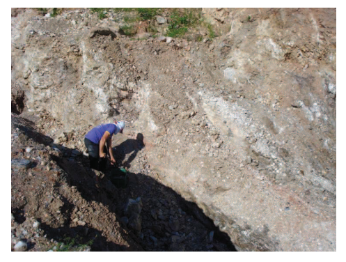
Figuras (44, 45, 46 e 47): Garimpeiros trabalhando sem os equipamentos de segurança, expostos aos perigos da atividade.