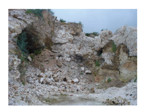
Figura 60: A erosão no Alto Feio é inegável, visto que este alto está sendo explorado desde 1930.