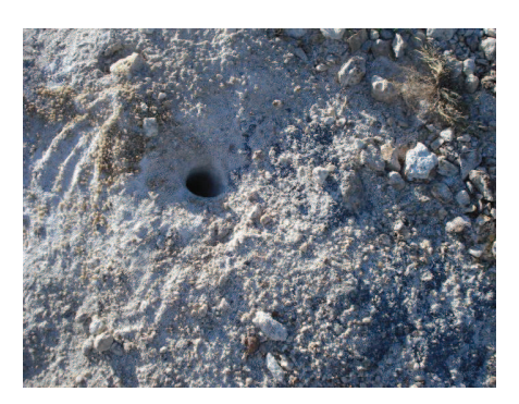
Figura 24: Preparação para detonação

A maioria das jazidas tem sua vida útil sacrificada, em virtude dos rejeitos serem depositados em locais onde existe minério. Isso acontece devido às precárias condições de transporte para deposição de rejeitos, feitas em quase 100% dos casos através dos carrinhos de mão. Nas figuras 25 e 26 estas condições precárias de trabalho são bem observadas.