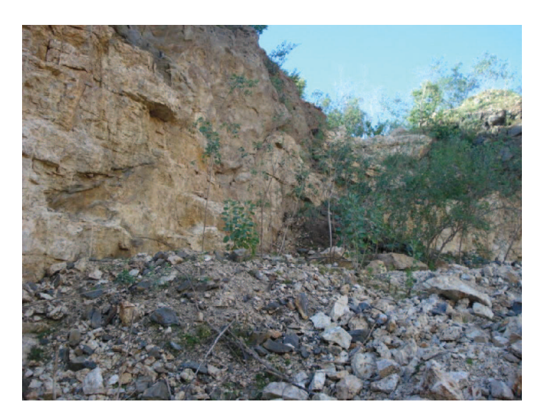
Figura 19: Desperdício mineral no Alto Formiga Fonte; Pesquisa de campo (2011).

A completa inexistência de técnicas de lavra para extração do feldspato está provocando ou tendem a provocar inúmeras dificuldades em se manter uma estabilidade na oferta e na qualidade. São aproximadamente seis ou sete décadas explorando áreas de maior ou menor porte, existindo apenas pequenas mudanças como a troca da perfuração manual pela pneumática e da utilização da pólvora que foi substituída pelos explosivos industriais. Após a descoberta das jazidas é improvisado um acompanhamento constituído de barracas, cobertas com papelão ou palha de coco como é visto nas figuras 20 e 21, onde os garimpeiros passarão a fixar residência durante os dias úteis da semana.