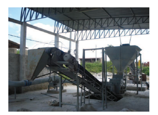
Figura 17: Moagem de feldspato pela Seridó Ltda.

Nota*: Produção de empresas detentoras de concessão de lavra.