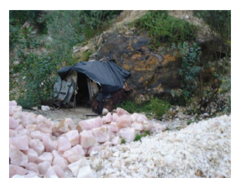
Figura 21: Acampamento de garimpeiros no Alto Feio.