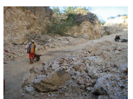
Figura 25: O uso das carroças torna o serviço ainda mais pesado no Alto Formiga.

A maioria das jazidas tem sua vida útil sacrificada, em virtude dos rejeitos serem depositados em locais onde existe minério. Isso acontece devido às precárias condições de transporte para deposição de rejeitos, feitas em quase 100% dos casos através dos carrinhos de mão. Nas figuras 25 e 26 estas condições precárias de trabalho são bem observadas.