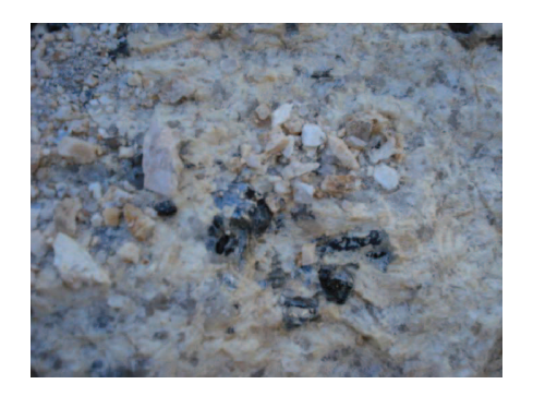
Figura 16: Prego de feldspato do Alto Formiga