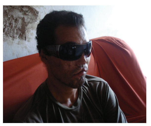
Figura 50: Ex garimpeiro que perdeu a visão pelo uso inadequado de explosivos.

O número de acidentes nos altos (denominação local dada às minas e/ou pedreiras) é crescente, de maior e/ou menor gravidade, fato muitas vezes que poderia ser evitado com uso de equipamentos. Dentre os entrevistados, alguns já haviam sofrido algum tipo de acidente dentro do alto e no momento estava sem equipamentos. A Figura 50 mostra um ex-garimpeio que perdeu a visão pelo uso inadequado de explosivos.