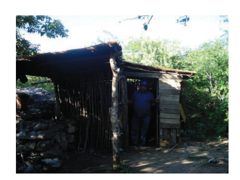
Figura 20: Acampamento de garimpeiros no Alto Formiga.

A completa inexistência de técnicas de lavra para extração do feldspato está provocando ou tendem a provocar inúmeras dificuldades em se manter uma estabilidade na oferta e na qualidade. São aproximadamente seis ou sete décadas explorando áreas de maior ou menor porte, existindo apenas pequenas mudanças como a troca da perfuração manual pela pneumática e da utilização da pólvora que foi substituída pelos explosivos industriais. Após a descoberta das jazidas é improvisado um acompanhamento constituído de barracas, cobertas com papelão ou palha de coco como é visto nas figuras 20 e 21, onde os garimpeiros passarão a fixar residência durante os dias úteis da semana.