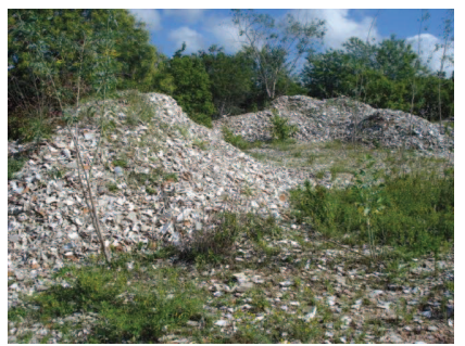
Figura 5: Rejeitos de porcelanato depositados pela Empresa Elizabete no ambiente.