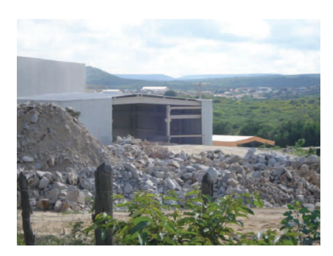
Figura 30: Empresa Elizabete (moinho 2)