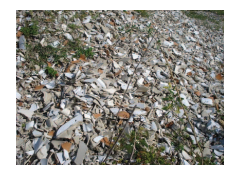
Figura 52: Retraços de porcelanato jogados no meio ambiente.