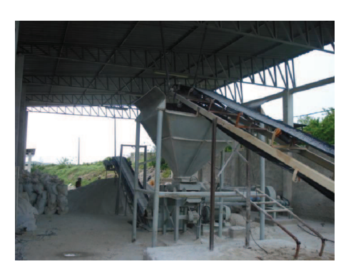
Figura 18: Moinho da Seridó Ltda.

A extração predatória desse bem não renovável já apresenta os primeiros sinais de que se não for feito um trabalho de conscientização para os métodos de extração, em um futuro bem próximo á natureza cobrará caro o seu preço, pois mesmo que venha a existir alguma reserva, esta estará completamente soterrada pelo tipo de extração que é feito no momento, impossibilitando a sua retirada. No município de Pedra Lavrada isso já é bem visto em quase todos os altos, podendo ser observado na Figura 19 parte deste mau aproveitamento mineral no Alto da Formiga.