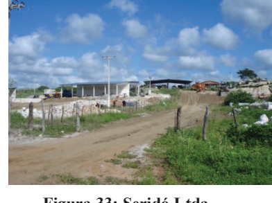
Figura 33: Seridó Ltda.