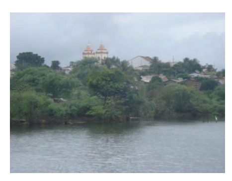
Figura 53: Riacho interrompido pela construção da estrada.