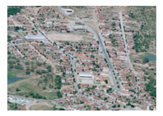
Figura 37: Vista aérea da cidade de Pedra Lavrada.

Conforme pesquisa efetuada nos arquivos da Paróquia Nossa Senhora da Luz, em 1750, de uma fazenda pertencente à família Gomes Barreto, originou-se a povoação de Itacoatiara, que posteriormente passou a chamar-se Pedra Lavrada, sendo este o significado da palavra Itacoatiara em virtude da existência de "pedras lavradas" distante cerca de um (1) km da cidade(Figuras 37 e 38).