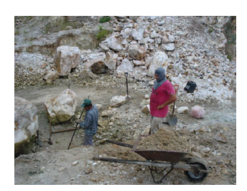
Figura 48: Garimpeiros trabalhando sem nenhum equipamento de segurança no Alto Seridó Feio.