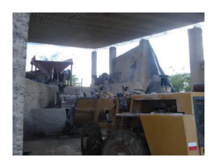
Figura 35: COOMIPEL (britador)