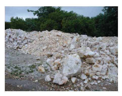
Figura 4: Rejeitos minerais no Alto Feio