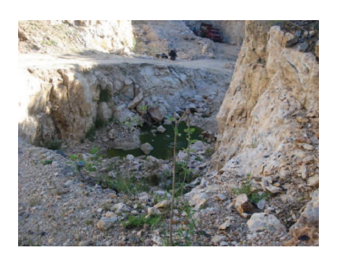
Figura 57: Erosão no Alto Formiga causada pelo mau aproveitamento da pedreira.