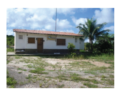
Figura 34: Sede da COOMIPEL