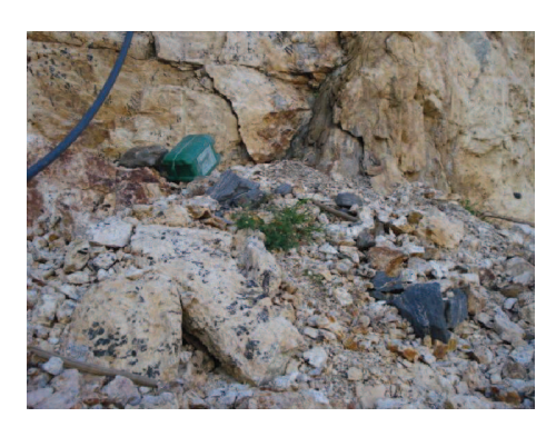
Figura 3: Rejeitos minerais de prego de feldspato no Alto Formiga.