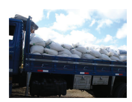
Figura 29: Caminhão sendo carregado para viagem na Seridó Ltda.