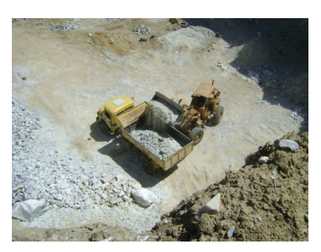
Figura 41: Caminhão carregando dentro da mina de calcário.