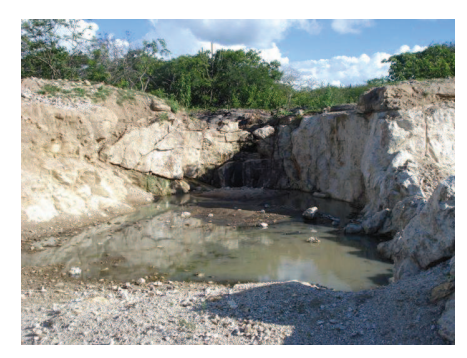
Figura 8: Percurso de riacho interrompido com a mineração no Alto Cachoeira.

Respeitados esses princípios, a mineração deve consolidar-se e crescer com base no aproveitamento racional dos bens minerais, buscando sempre o equilíbrio sistemático entre o homem, o recurso e o território.