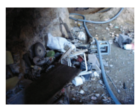
Figura 7: Lixo produzido pelos garimpeiros dentro da mina no Alto Maracajá.

Portanto, o crescimento econômico inclui e pressupõe o desenvolvimento da atividade mineraria com vista ao atendimento das necessidades do homem, e deve estar intimamente associado aos cuidados com o meio ambiente (MOREIRA, 2003).