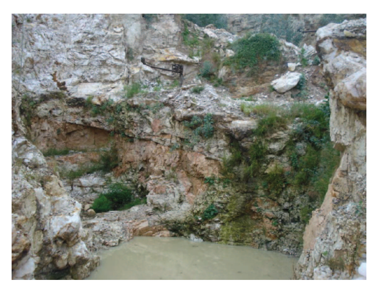
Figura 12: Buraco aberto por garimpeiros no Alto Feio

atividade mineradora quase que exclusivamente sob a forma de garimpagem nos primeiros anos de existência.