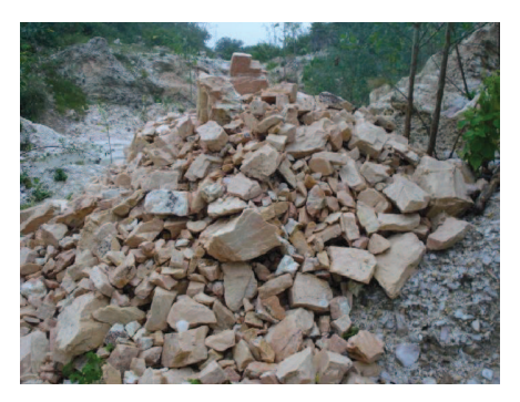
Figura 59: Minérios rejeitados pelas firmas são depositados no pé do alto e ali ficam por muito tempo até que haja uma nova seleção.