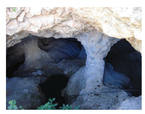
Figura 1: Mina subterrânea de mica e feldspato (Alto do Maracajá).

química e biológica, crescendo à medida que se desenvolve (PEDRO e FRANGETTO, 2004).