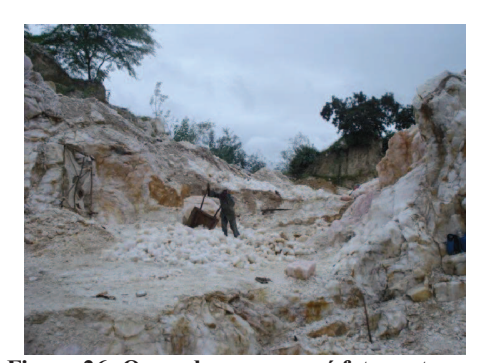
Figura 26: O uso das carroças é fato certo em todos os altos como é visto no Alto Feio.

Pode-se verificar que existe uma lavra predatória e seletiva ao mesmo tempo, predatório em função da ausência de tecnologia e seletiva por depender do mercado, algo que é rejeito hoje pode amanhã vir a tornar-se um bem principal segundo às exigências do mercado.