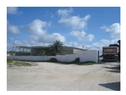
Figura 32: Empresa Elizabete (moinho 1).