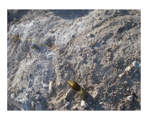
Figura 23: Preparação para detonação