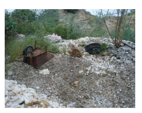
Figura 58: Resto de ferramentas são deixadas nas minas causando poluição visual e a natureza.