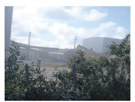
Figura 6: Nuvem de poeira originária da moagem de Feldspato.

É no foco do atendimento às necessidades humanas que a indústria extrativa mineral representa seu papel de grande relevância, embora tenha sido uma das menos aceitas no conceito do desenvolvimento sustentável. Para haver desenvolvimento sustentável é necessário atender as necessidades da geração atual, sem colocar em risco a capacidade das futuras de satisfazer as suas. Perpassa o atendimento das demandas sociais emergentes no conceito global, considerando-se o pressuposto de manejo eficiente dos ecossistemas, tanto sob os aspectos do meio físico como biótico.