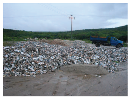
Figura 51: Retraços de porcelanato em estoque para ser moído.