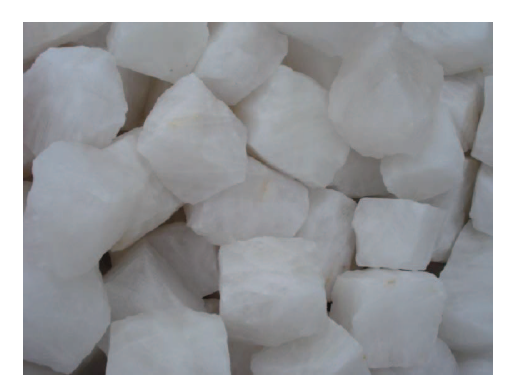
Figura 14: Cristal de Quartzo extraído no