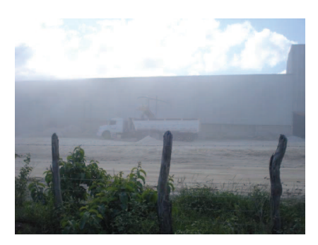
Figura 9: Nuvem de poeira derivada da moagem de feldspato pela Empresa Elizabete

explosivos, emissão de partículas e lançamento de fragmentos, distante cerca de 4 km da cidade a Empresa Elizabete sofre constantes denúncias por causar todos estes incômodos ao município, a nuvem de poeira observada nas Figuras 9 e 10 são um exemplo desta poluição.