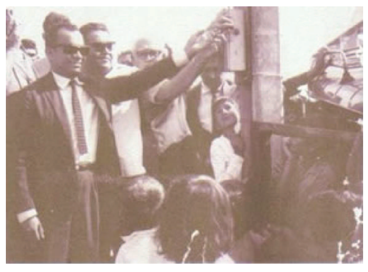
Figura 39: Inauguração da energia no município com o então prefeito instituído Heronides Meira Vasconcelos em 1962, ao seu lado o governador Pedro Moreno Gondim.

Vasconcelos (figura 39), tendo em seguida assumido o prefeito constituinte, Sr. Antonio Cordeiro Neto.