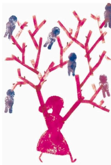
Figura 5- Ilustración del poema “Bien pudiera Ser” de Alfonsina Storni

El libro “Las grandes mujeres”, publicado en 2014, es una antología que contiene los más diversos poemas de Alfonsina con prólogo de Clara Sánchez (1955-2013) renomada autora española y ilustraciones por Antonia Santolaya (1966) dibujante de historias para niños, jóvenes y adultos, lo que completa esta obra, pues además de introducir al lector al mundo poético aún permite que tenga una visión más amplia a través de los dibujos, según el periódico Casa da literatura peruana “El libro da una visión panorámica a lo largo de sus distintas obras en versos”. Por medio de esta obra y con la ayuda de las ilustraciones, los poemas de Alfonsina alcanzaron nuevos públicos, incluyendo jóvenes lectores y personas que prefieren una otra experiencia de lectura.