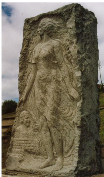
Figura 4 - Monumento a Alfonsina Storni frente a la playa La Perla en Mar del Plata

Trayendo consigo una gran carga histórica, además de la imagen de la poetisa, alrededor de la escultura hay versos de sus poemas, para aquellos que aún no conozcan tengan la posibilidad de apreciar la poesía de Storni. Este monumento es visitado diariamente por miles de turistas y también por los residentes de la ciudad.