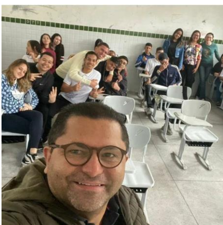
Figura 12- Após exibição e debate, indicamos alguns pontos de apoio psicológico gratuito. (Escola Normal, 19/10/23)