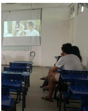
Figura 9- Exibição do filme: Alexandria, de Alejandro Amenábar. O filme foi escolhido em virtude ao dia do filósofo. (UEPB, 25/09/23)

Figura 8- Exibição do curta: Meu amigo Nietzsche, de Fáuston da Silva. Após exibição debate sobre os conceitos: super-homem, morte de Deus, superação e niilismo. (Escola Normal, 15/09/23)