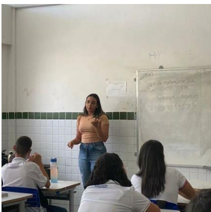
Figura 20- Após exibição dialogamos também sobre a importância da representatividade, foi muito marcante dialogar sobre temas tão pertinentes no mesmo dia que se é comemorado o dia da consciência negra. (Escola Normal, 20/11/23)