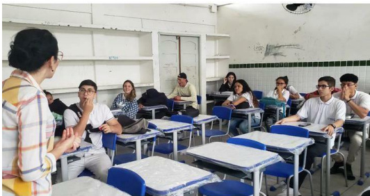
Figura 18- Exibição (seguida de debate) dos curtas: Ana (2017 dir. Vitória Felipe) e A coisa tá preta (2017 dir. Gabriel Felipe), em alusão ao dia da consciência negra, discutindo sobre o racismo estrutural e linguístico e a importância da representatividade. (Escola Normal, 31/10/23).