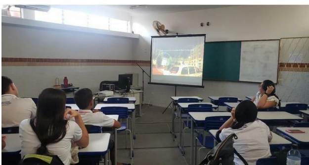
Figura 6- Exibição do documentário: Quando tempo o tempo tem, de Adriana Dutra. (ECI Monte Carmelo, 01/08/23)