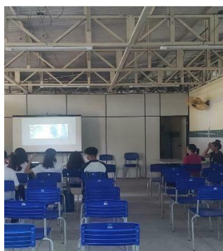
Figura 2-Exibição do filme: A última floresta, de Luiz Bolognese, após exibição debatemos acerca do massacre constante enfrentado pelos povos indígenas em nosso país. (Eci Premen, 08/05/23)