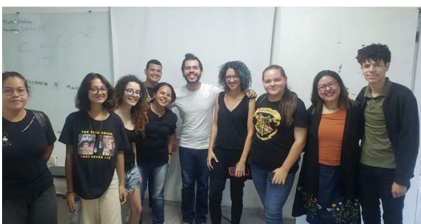
Figura 16- Exibição (seguida de debate) do filme: A onda, de Dennis Gansel. (UEPB, 27/11/23)