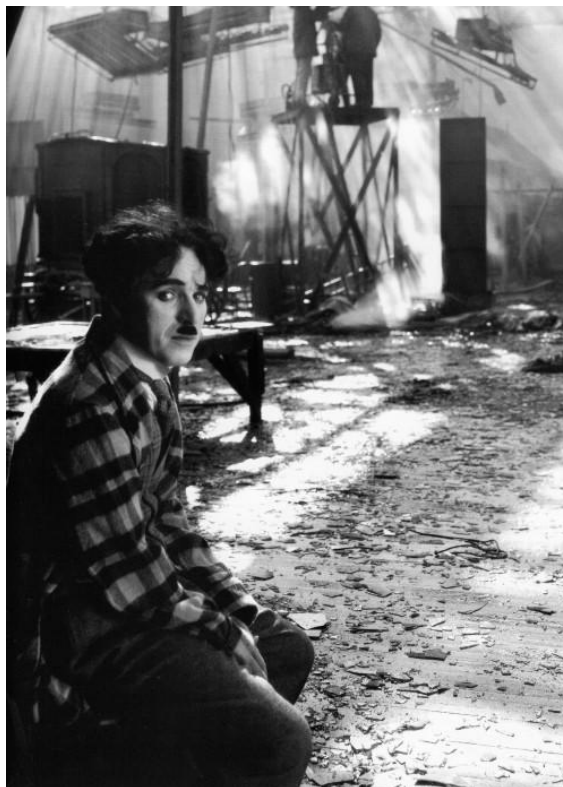
Figura 6. O semblante triste (e raro) de Chaplin, no set tomado pelo incêndio.

A logoterapia postula que devemos evitar a dor, quando isso for possível (FRANKL, 2011, p. 94), entretanto, quando nos deparamos com um destino imutável, esse sofrimento deve ser transformado em algo significativo, numa conquista. Portanto, parece-nos que a experiência de Chaplin no momento de produção de “O Circo” representou na prática a teoria frankliana ao que se refere à questão dos valores.