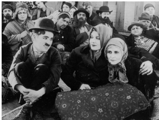
Figura 2. O Imigrante, de 1917.

Na medida em que o personagem vagabundo vai ganhando fama e notoriedade, Chaplin o aperfeiçoa. Se nos primeiros momentos ele parece gostar de confusão e até algumas vezes cometer pequenos delitos, posteriormente vai ganhando feições de inocência, uma pequena criatura com o coração de um gigante.