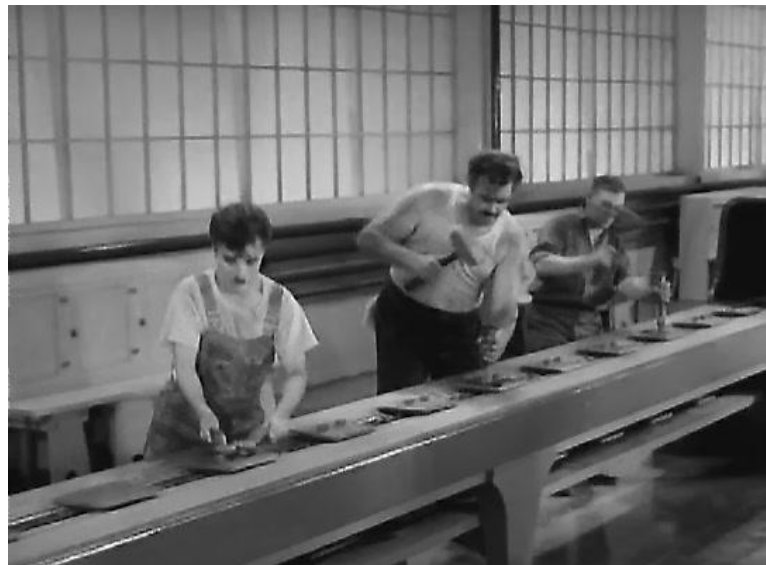
Figura 4. O personagem de “Tempos Modernos” na linha de produção

Há, também, um exemplo bastante representativo sobre autotranscedência, no filme “Tempos Modernos” (1936), em que seu início é apresentado com uma mensagem inicial: “Uma história sobre a indústria, a iniciativa privada e a humanidade em busca de felicidade”. O personagem de Chaplin trabalha em uma grande indústria, com máquinas gigantescas que parecem ameaçadoras a ponto de engolir seus funcionários. O barulho das engrenagens e o rígido modo de produção fordista/taylorista, que passou a chamar a atenção de Charles Chaplin para o mundo mecanizado, o fez produzir a sensação de prisão e alienação dos funcionários da indústria, representada no filme, se apresentavam.