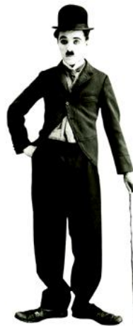
Figura 1. O Vagabundo

O personagem Vagabundo trata-se de um sujeito pobre, que faz de tudo para parecer cavalheiro. Ele demonstra um refinamento encantador, mas não se constrange em pegar uma bituca de cigarro que acha no chão. Seu objetivo é sobreviver, mas sempre há algum policial que lhe persegue, porque na maioria das vezes ele se envolve em alguma cena em que sua presença é indesejável ou recebe a culpa pelo que não fez. Outro elemento comum é a presença de uma bela jovem, que mexe com o coração do pequeno personagem, despertando o que há de mais sublime em termos de sentimento: o amor. E, em suas histórias, é o amor que lhe redime, que lhe proporciona encontrar um sentido.