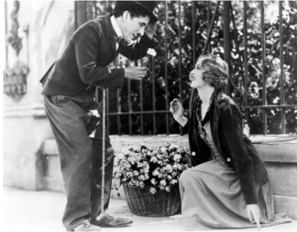
Figura 3. O sentido do amor, representado na entrega por uma causa maior. Cena de “Luzes da Cidade”, de 1931.