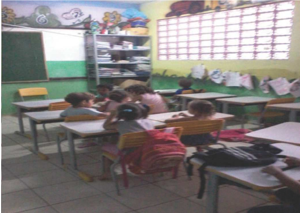
Figura 2. Sala de aula, posição das carteiras. (09/07/2015)