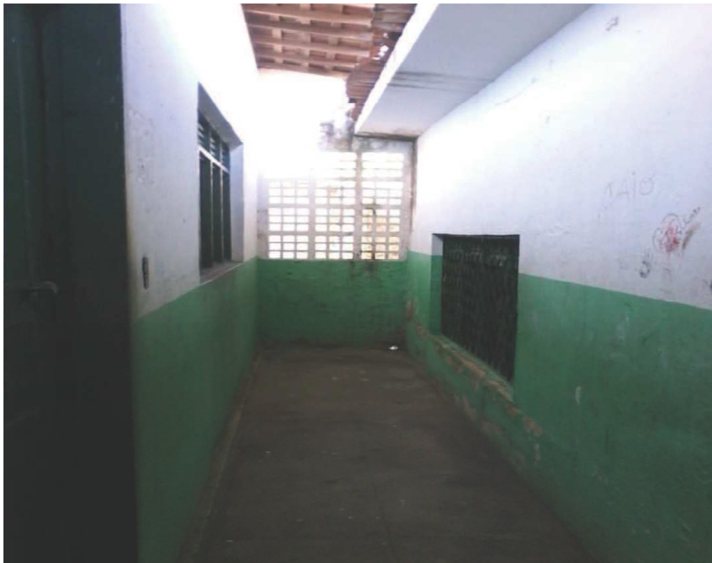
Figura 3. Corredor que dá acesso à sala da educação infantil. Foto tirada por Ana Lúcia (09/07/2015)