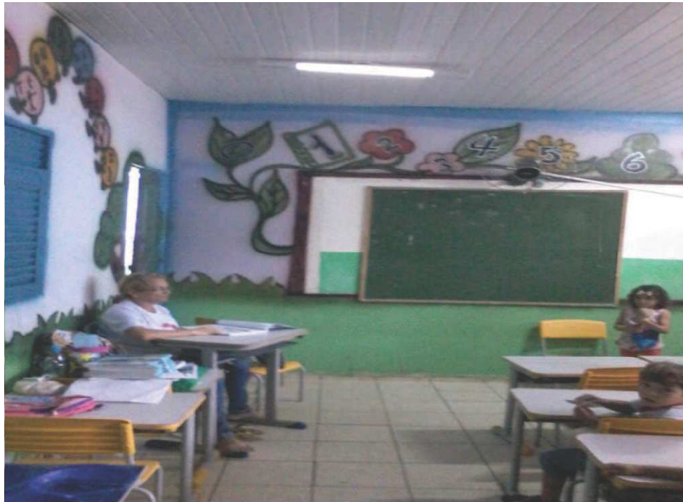
Figura 5. Professora em seu momento de intervalo. Foto tirada por Ana Lúcia (09/07/2015)