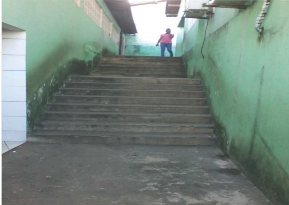
Figura 4. Escada que dá acesso às salas de aula na parte de cima e para a cantina. Foto tirada por Ana Lúcia (09/07/2015)