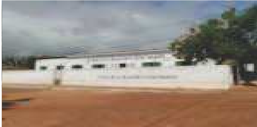
Figura 1. Fachada da antiga entrada da Esc. Dep. José Mariz – Foto tirada por Carlos (Maio de 2010)