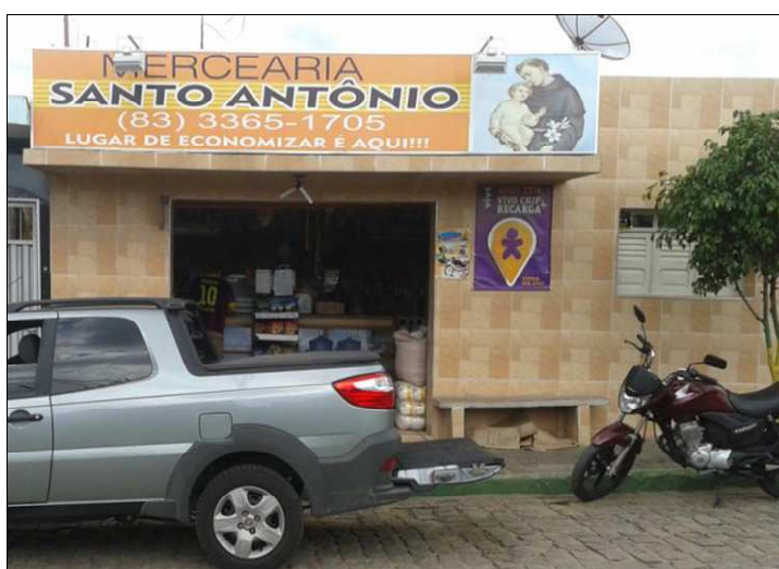
Figura 02: Merceria Santo Antônio – Faixada da Merceria

Como é comum aos demais estabelecimentos desse tipo é presente a presença do balcão de madeira, prateleiras do mesmo material, “Balanças de Peso”, mas o mesmo aborda que no momento da instalação, até os dias atuais houve muitas modificações. Na imagem abaixo destacamos a faixa da Merceria Santo Antônio.