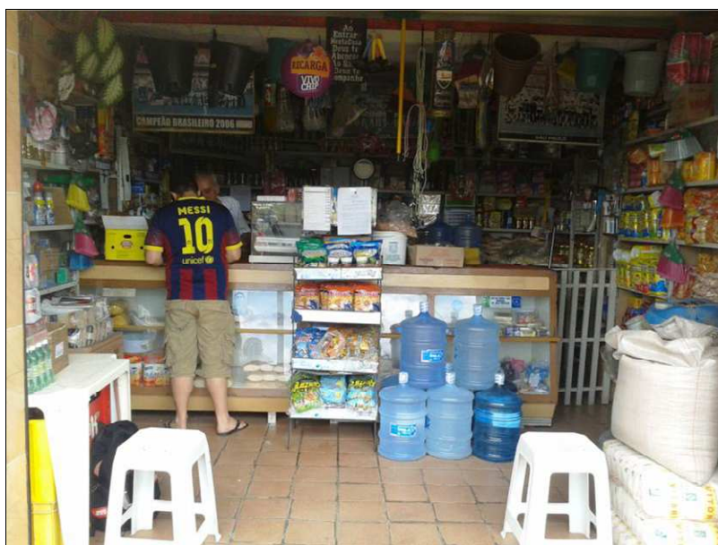
Figura 03: Merceria Santo Antônio – Espaço interno da Merceria

O balcão tomou uma roupagem diferenciada e as prateleiras foram trocadas por material de ferro e, o grande diferencial foi a implementação do Freezer, pois antes não se tinha condições econômicas para comprar um eletrodoméstico dessa natureza e, com essas modificações o comerciante em questão aponta como importante essas transformações, pois possibilitou vender mais mercadorias, como frios e outras mercadorias que necessita de conservação imediata, o que veio com isso diversificar a renda do comércio. Podemos visualizar na imagem abaixo as diversificações de produtos oferecidas pelo estabelecimento, assim como a modernização do espaço: