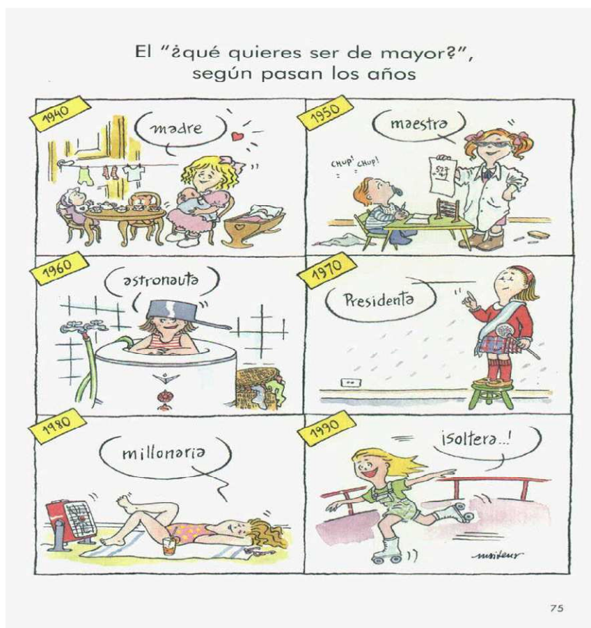
Figura 4 Mujeres Alteradas I: el "¿qué quieres ser de mayor"? Según pasan los años

Los movimientos sociales fueron muy importantes para los derechos adquiridos por las mujeres, con énfasis al movimiento feminista contemporáneo, que surgió en los Estados Unidos entre los años de 1960 hasta 1980, las mujeres buscaban la igualdad entre hombres y mujeres, teniendo como pauta la sexualidad femenina y la relación de poder. Foucault (1995) determina el enunciado a partir de las reglas sociales, porque todo enunciado tiene su lugar y su norma de manifestación en un período específico, luego en todos los ambientes expuesto, la mujer en situación de nuera, queda callada mismo no gustando del habla de la suegra que no entra en contradicción por ser una práctica social y es más conveniente a la nuera no contradecir a la madre de su esposo.