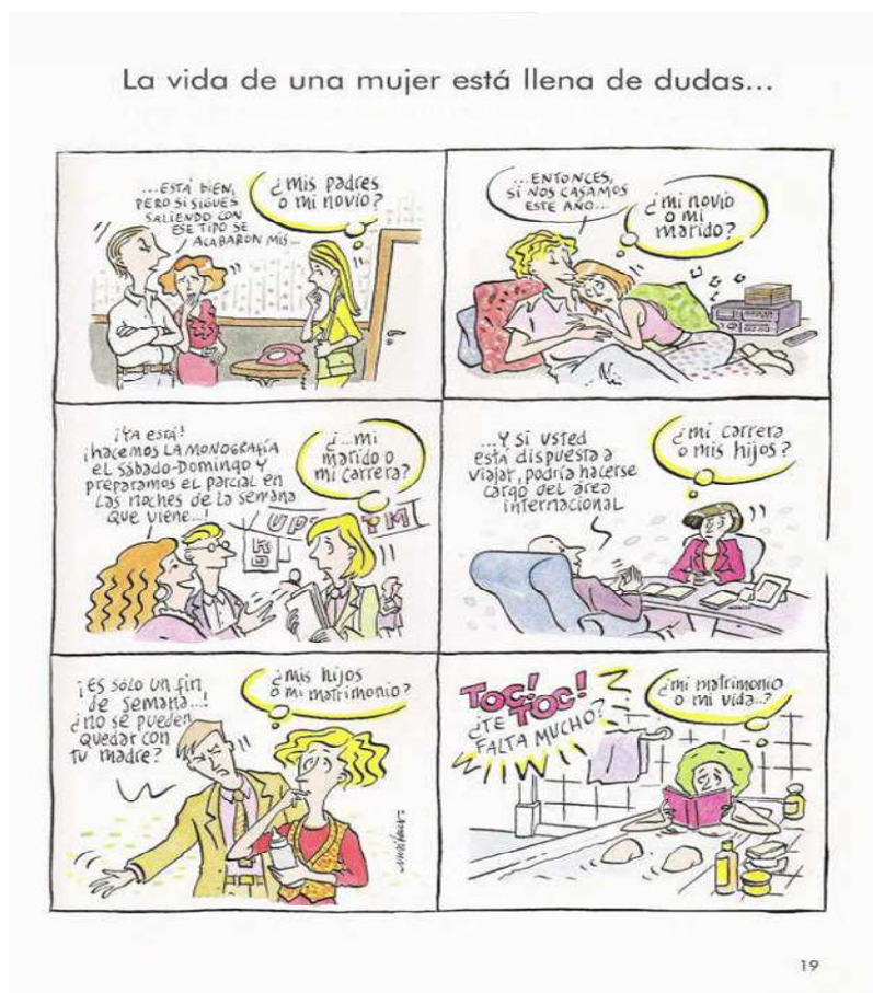
Figura 2: Mujeres Alteradas 1: la vida de una mujer está llena de dudas...

Las tiras de Maitena son cómicas apuntando situaciones comunes experimentadas por las mujeres, de modo que ellas no son continuas, pero tiene un sentido lógico, visto que el discurso es heterogéneo y puede ser modificado de acuerdo con el contexto histórico. Por tras de este discurso tenemos la formación discursiva apuntada por Foucault (1995, p.64) al presentar estudios sobre los pronunciamientos de los sujetos socialmente instaurados, en una comunidad lingüística. Ya el discurso caracterizado por Pêcheux (1990) se la nota a través la interdiscursividad de los varios discursos en diferentes contextos además, de la intradiscursividad que es construida a través de la realidad que el sujeto está inserido.