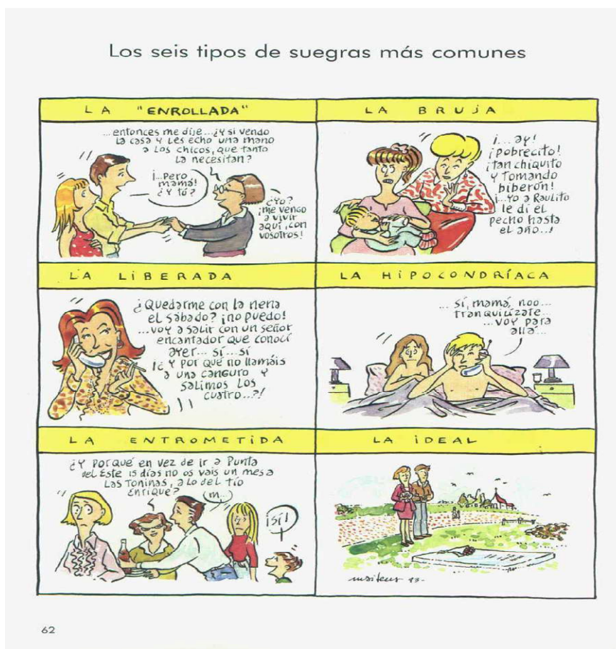
Figura 3: Mujeres Alteradas 1: los seis tipos de suegras más comunes

En la figura 3 podemos analizar cuatro características teóricas. La primera es la memoria discursiva, la segunda es la polifonía, la tercera es el contexto pragmático y la cuarta es la formación discursiva. Esta, reporta un discurso común investido de ideologías al hablar de la suegra, cuyo discurso está vinculado con los rasgos lingüísticos en que Pêcheux (1999) denomina de memoria discursiva. La memoria discursiva está agregada a determinados rasgos culturales discursivos que hace que los sujetos denuncien en sus enunciados las más diversas voces, llamadas de polifonía por Ducrot (1984), inscritas, generalmente, sobre determinados contextos, asuntos o temas.