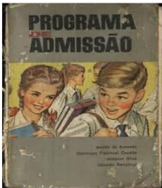
Imagem do livro adotado na época de 1960 a 1970, nos exames de conclusão do primário para ingresso ao curso ginásial.