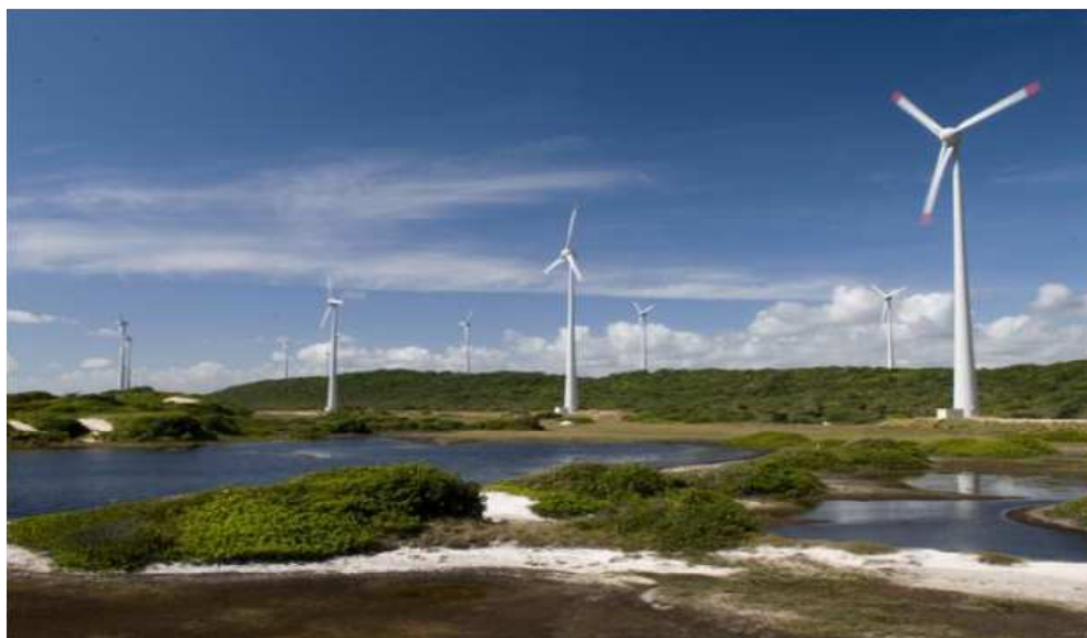
Figura 4- Parque Eólico Vale dos Ventos