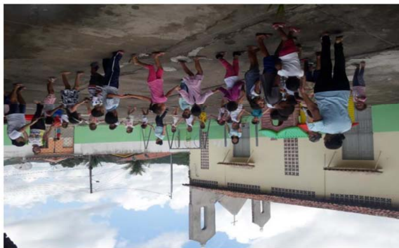
FIGURA 3- Professoras e crianças brincando de roda no pátio

Assim, percebemos que a música contribui para o desenvolvimento na criança de mais habilidades para aprender outras disciplinas, bem como interagir com o grupo, como podemos observar na figura a seguir: