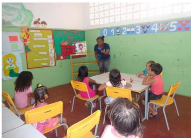
FIGURA 1- Contando história intercalada com música

Ao observar a turma algumas atividades foram realizadas com o objetivo de estimular o desenvolvimento das crianças, de socializar e fazer com que as mesmas adquirissem conhecimentos através das músicas como vemos nas figuras a seguir: