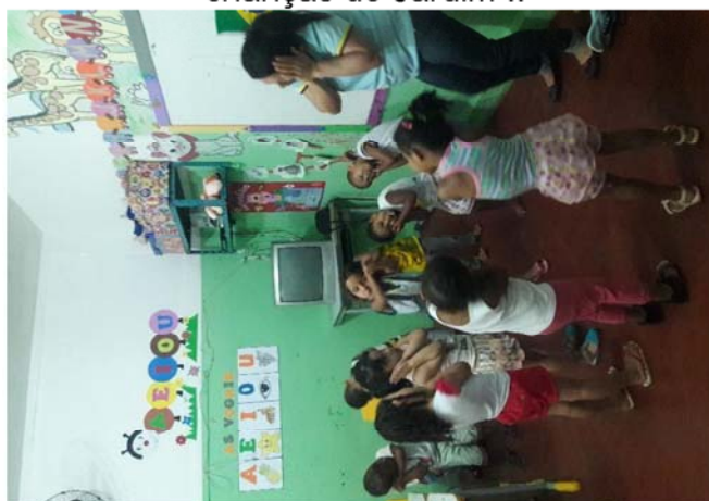
FIGURA 2- Professora trabalhando com música gestos e movimentos com as crianças do Jardim II

A música nos proporciona trabalhar com diferentes culturas, ou seja, com a diversidade que existe em nosso país, elas proporcionam uma aprendizagem agradável e significativa.