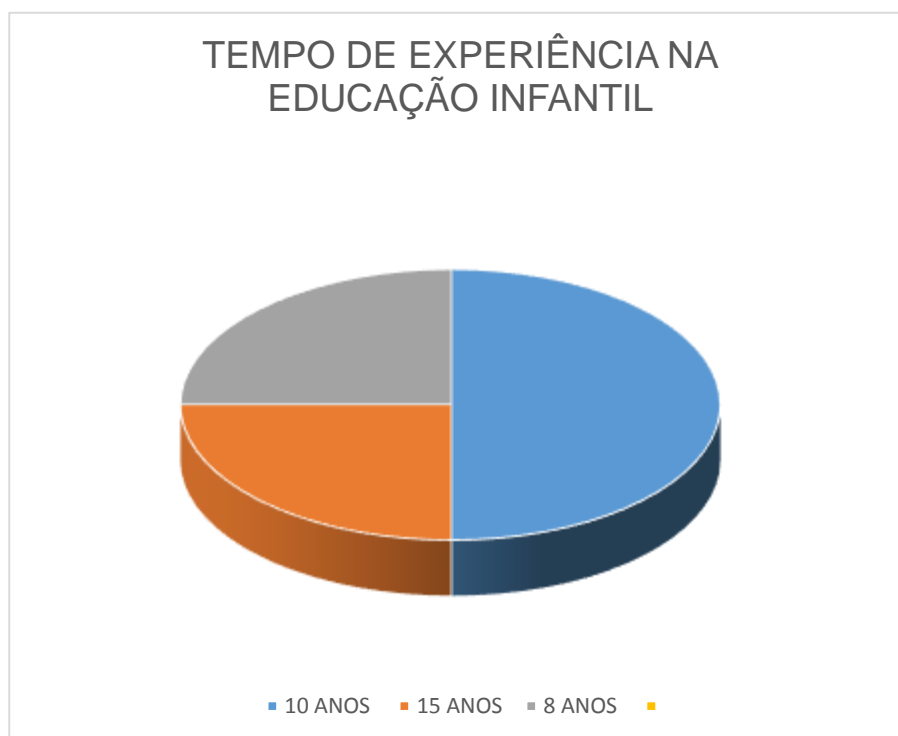
Gráfico 1: Tempo de experiência na Educação Infantil

O perfil dos professores está representado no Gráfico 1, a seguir, apresenta o tempo de experiência nesse segmento educacional.