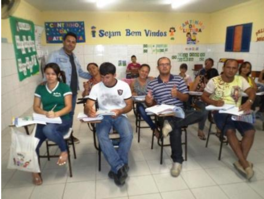
FIGURA- 4, Turma da EJA