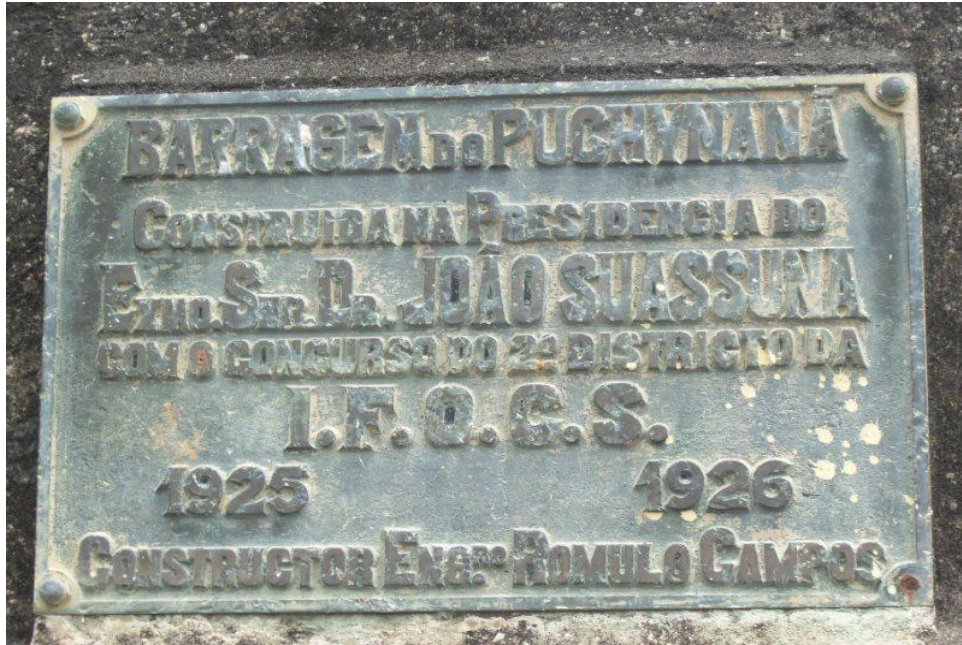
FIGURA 1- Visita a Cidade de Puxinanã.