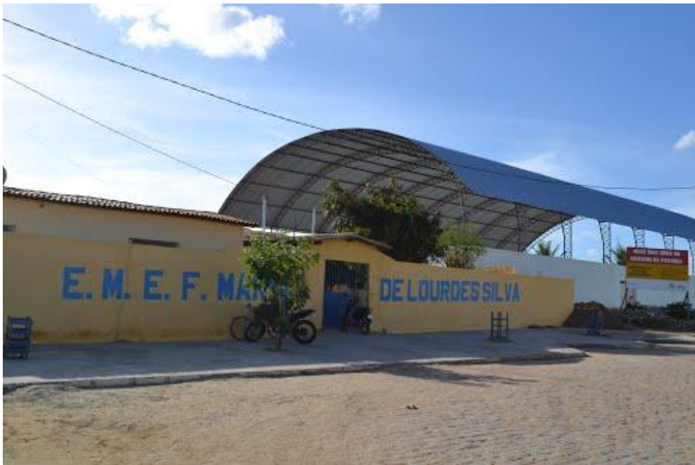
FIGURA 2- Escola Maria De Lourdes Silva