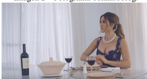
Imagen 2 – Fotograma 01min:11seg.