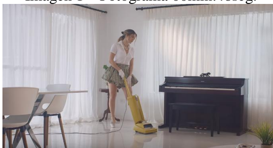
Imagen 1 – Fotograma 00min:48seg.