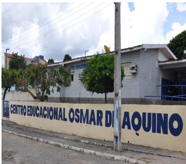
Figura 1 – Escola Centro Educacional Osmar de Aquino (CEOA)