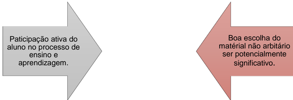
Figura 1: Condições para o processo de aprendizagem.

estudantes. Assim sendo, para que o processo de aprendizagem significativa seja desenvolvido de forma eficaz, são necessários, de acordo com Moreira (1999, p. 154), duas condições, sendo elas extremamente relacionadas entre si: