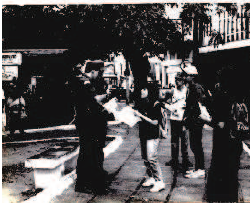
FIG.05: Movimento Anarco Punk (MAP) 8 de Março Dia da Mulher. João Pessoa-PB (1992)