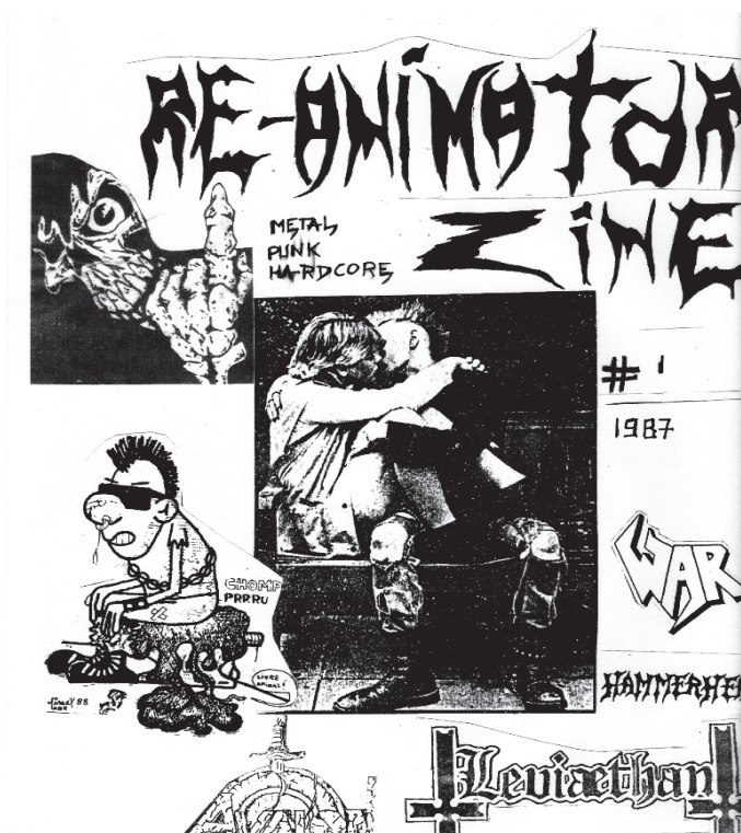
FIG.03: Re-Animator- Fanzine Punk e Metal editado por Bergson. João Pessoa-PB. (1987)