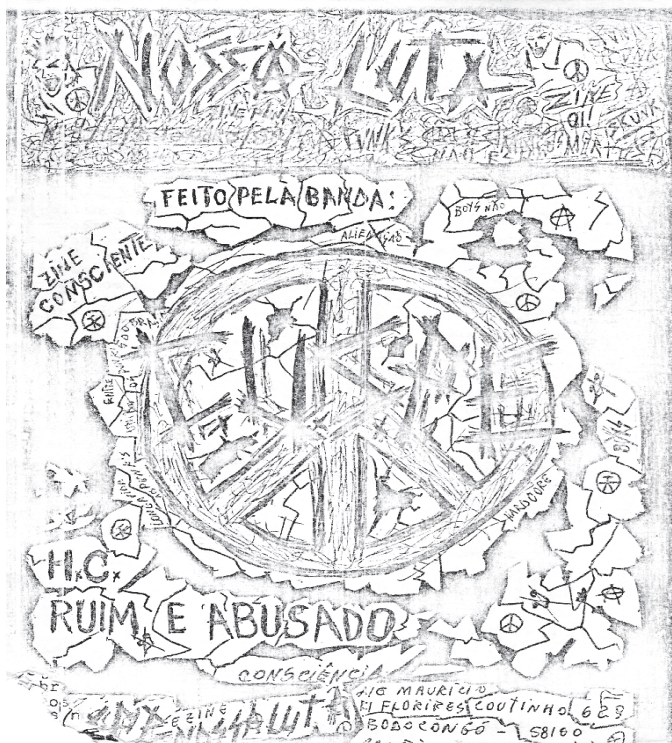
FIG.04: Zine Nossa Luta!- Editado pela banda C.U.S.P.E. Campina Grande-PB. (1989)