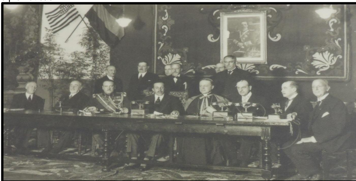
Figura 01 – Imagen histórica de Alfonso XIII, inaugurando el edificio de la CTNE con la primera llamada a EEUU al presidente Coolidge, normalizando las relaciones diplomáticas.

El Rey Alfonso XIII aparece algunas veces en la serie, por la primera vez en un acontecimiento histórico que fue el gran hito de la comunicación: una llamada transatlántica entre el rey de España y el presidente de Estados Unidos, Calvin Coolidge, el 13 de octubre de 1929. En la figura abajo tenemos una imagen del acontecimiento de la primera llamada entre Estados Unidos y España.