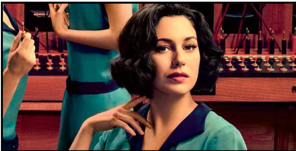
Figura 05 – Lidia/Alba con el uniforme de las asistentes de la telefonía.

De manera general, esta representación, así como las demás, son relevantes, porque pueden influenciar la vida de mujeres al reproducir papeles sociales. Eso provoca una crítica acerca de la discusión sobre la desigualdad de género. Es un movimiento generado por el poder cultural o simbólico, en que los intercambios de informaciones pueden crear respuestas de determinado tenor, sugerir caminos y decisiones, incluso provocar revueltas colectivas (THOMPSON, 1998).