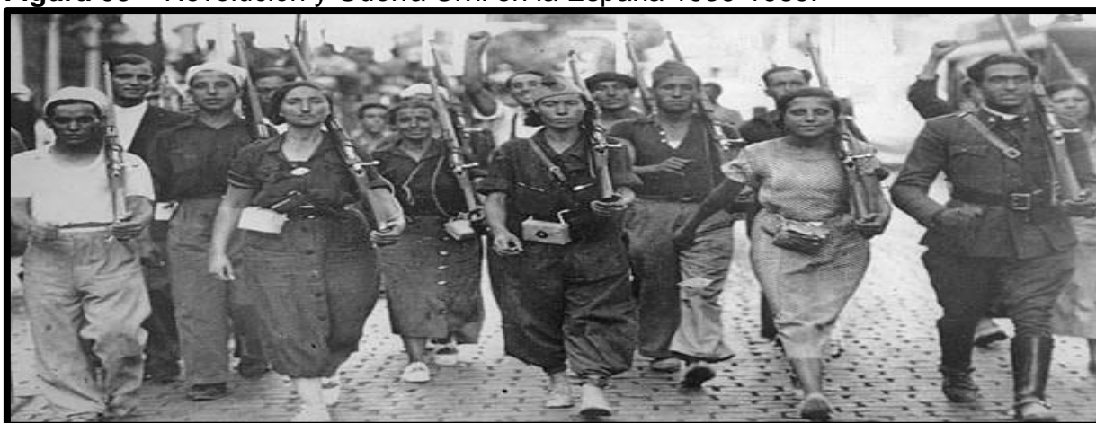
Figura 03 – Revolución y Guerra Civil en la España 1936-1939.

Contra la derecha se levantó la izquierda con el Frente Popular para proteger la democracia y combatir al fascismo. La tensión entre los dos lados resultó en desapariciones, insurrecciones y asesinatos. Fueron tiempos sombríos para España y sus ciudadanos. Fue en este contexto que se instauró la Guerra Civil Española, que también es retratada en la serie. Aunque las mujeres sufrieron tantas limitaciones en la libertad de sus elecciones, ellas, al mismo tiempo, no se rindieron a los obstáculos que la sociedad las direccionaba. Ellas tomaron las armas y lucharon por la defensa de sus ideales. En la siguiente imagen tenemos un registro de la participación femenina en esta guerra, ellas participaron de manera efectiva y tomaron la frente de la lucha.