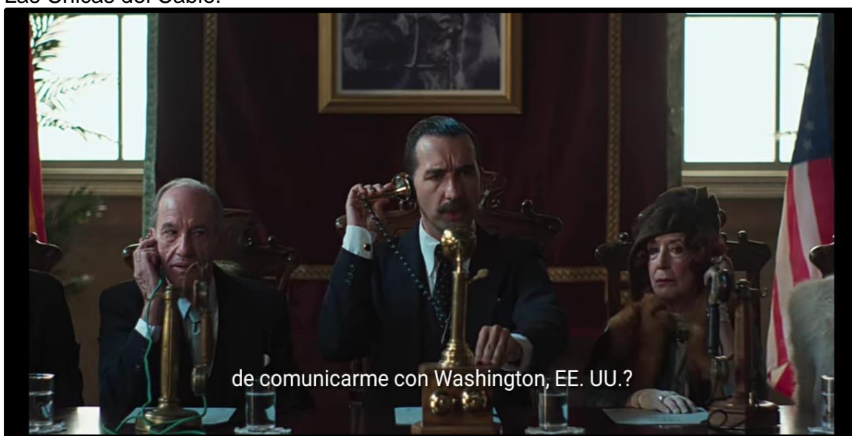
Figura 02 – La primera llamada entre España y Estados Unidos de América en la serie Las Chicas del Cable.

Doña Carmen Cifuentes, en los primeros episodios, va a parecer una mujer frágil, sin voz, sumisa, pero, más tarde, va a ser un personaje central, una villana, que tomará el poder para ella de manera arbitraria, o sea, tomará el poder por medio de acciones no legales. Ella no tendrá límites para conquistar lo que su corazón desear. Será esta una postura común entre las mujeres de la serie, sea de manera positiva o negativa, pues ellas tendrán que ir contra las leyes vigentes para tornarse libres y alcanzar sus ambiciones. Por ejemplo, Doña Carmen Cifuentes tendrá esa actitud para beneficio propio hasta llegar a ser reconocida como una persona maquiavélica.