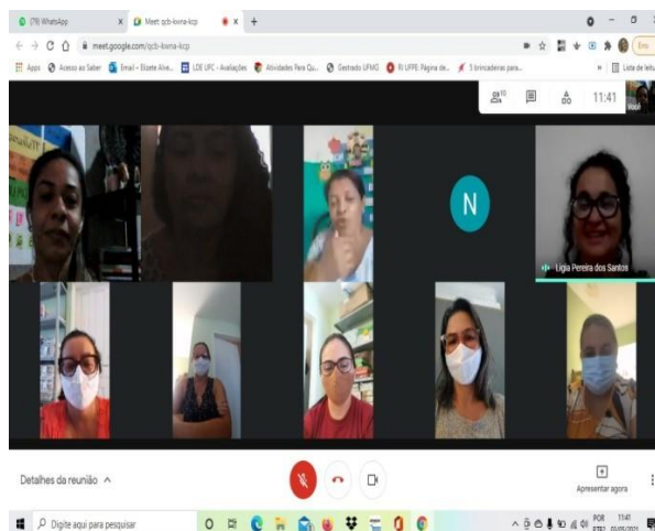
Figura 1 - Encontro com a Equipe Escolar