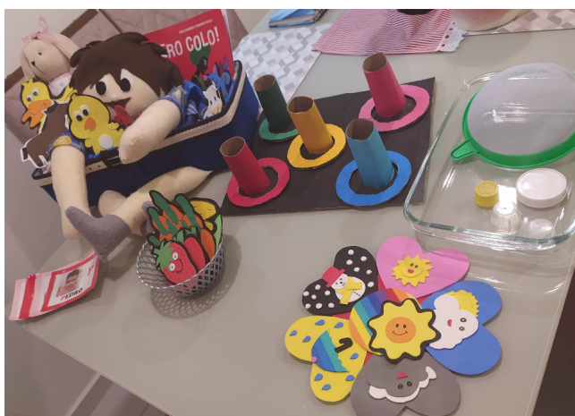
Figura 3: Recursos utilizados na atividade.

Os jogos, as brincadeiras, a dança e as práticas esportivas revelam, por seu lado, a cultura corporal de cada grupo social, constituindo-se em atividades privilegiadas nas quais o movimento é aprendido e significado. Dado o alcance que a questão motora assume na atividade da criança, é muito importante que, ao lado das situações planejadas especialmente para trabalhar o movimento em suas várias dimensões, a instituição reflita sobre o espaço dado ao movimento em todos os momentos da rotina diária, incorporando os diferentes significados que lhe são atribuídos pelos familiares e pela comunidade (BRASIL, 1998, v.2, p. 15).