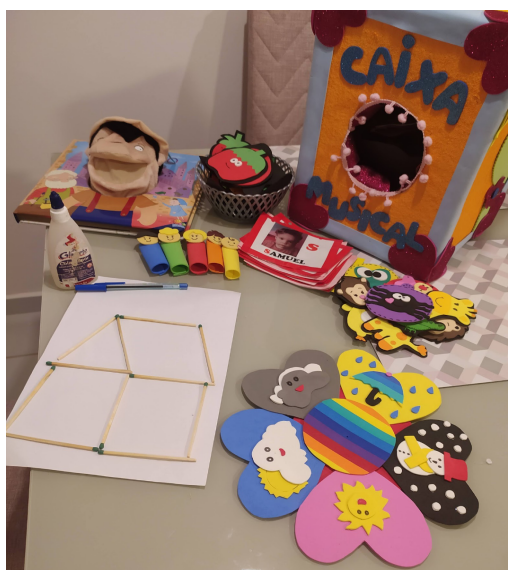
Figura 2: Recursos utilizados na atividade.