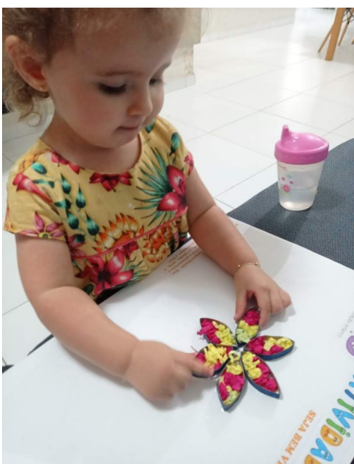
Figuras 6 e 7: Crianças realizando atividade sobre a Primavera.

Sabemos que é muito importante levarmos em consideração o tempo de cada criança para o desenvolvimento da sua aprendizagem, por isso ter um ambiente adequado para a realização de tais atividades é fundamental para o desenvolvimento pleno da criança.