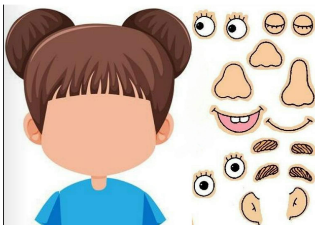
Figuras 8: Recurso enviado para casa para realização de atividade proposta.