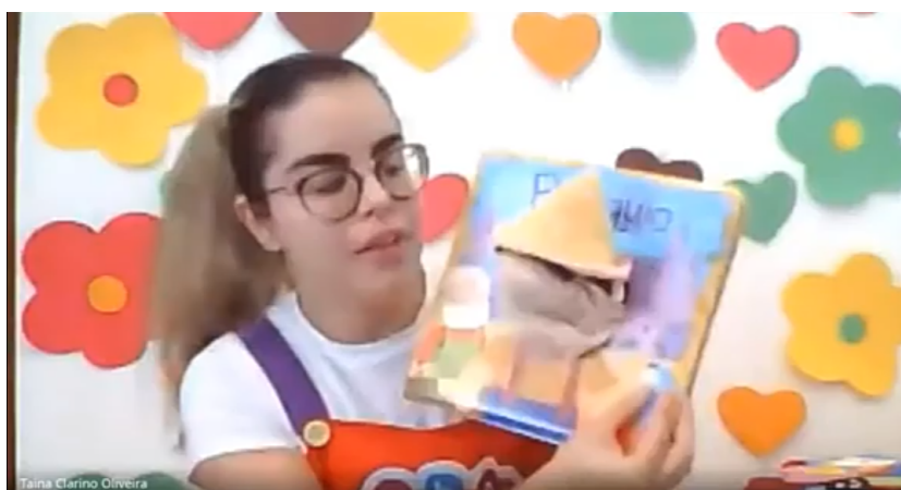
Figura 1: Professora realizando contação de história: Livro Pinóquio

Após a contação de história realizamos cantiga com fantoches da família dos dedos com a turma e logo após foi realizada orientação de como seria realizado a atividade, solicitamos para os pais uma folha de ofício e estes deveriam realizar o desenho de uma casa, em seguida, as crianças foram orientadas a realizarem desenho/pintura da sua família na casa e por fim colar palitos de fósforo na linha tracejada da casa.