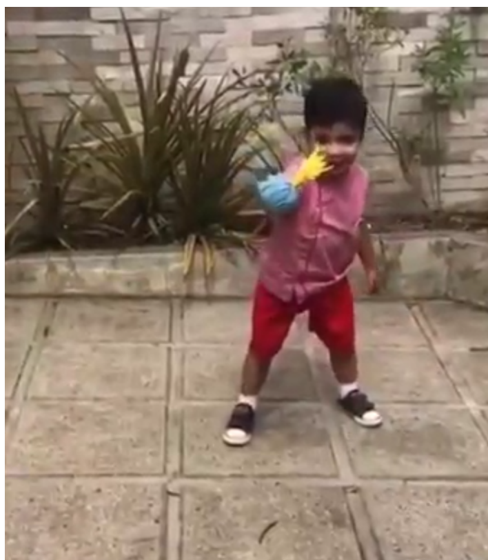
Figura 5: Criança brincando com peteca confeccionada em sua casa.

No dia 21 de Agosto de 2020, a atividade se referiu ao folclore com contação de história em dedoches sobre as lendas do curupira, saci e a sereia. Ressaltamos também a musicalização de algumas cantigas do folclore proporcionando às crianças a interação através do estímulo das danças com a participação de seus familiares se possível. Nesse dia após a conclusão desse momento interativo, as crianças foram orientadas a confecção de brinquedo “Peteca” com a utilização de TNT, jornal, cola, Eva e fita.