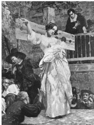
Figura 2 – Hester sobre o cadafalso aos olhares da colônia puritana