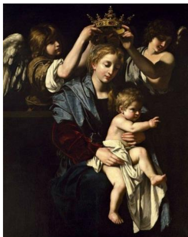
Figura 1 – “The Virgin and Child with Angels”, pintura de Cavarozzi

aspectos de semelhança com a personagem Hester. A Virgem Maria o dom da maternidade sem fazer alusão ao pecado, uma vez que Jesus nasceu de sua mãe imaculada, enfatizando que os filhos são herança do Senhor; podemos pensar também a Maria Madalena, uma vez que a personagem é marcada pela culpa da prática sexual ligada ao adultério e exposta aos julgamentos humanos.