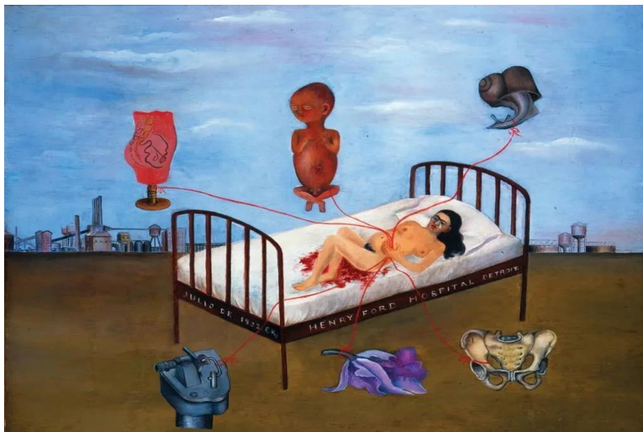
Figura 1 – Henry Ford Hospital (1932)

Fuente: Henry Ford Hospital – 1932. Óleo sobre lienzo. 30,5 x 38 cm. Museo Dolores de Olmedo Patiño, Ciudad de México, México.