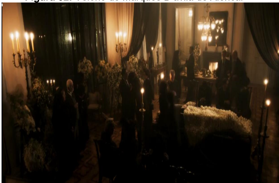
Figura 02: Velório do Marquês D'ávila de Alencar