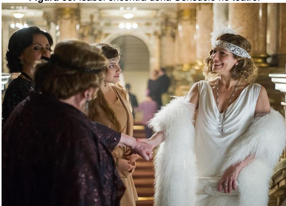
Figura 03: Isabel encontra dona Consuêlo no teatro.