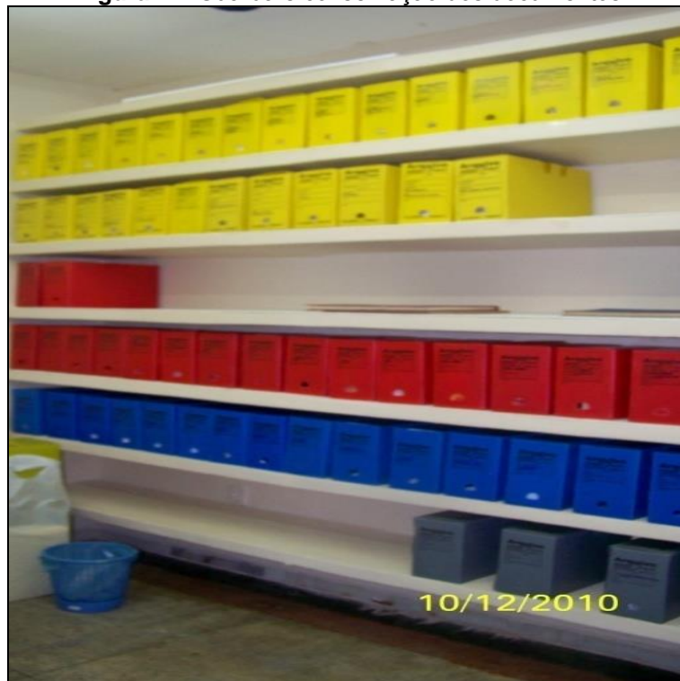
Figura 2 – Guarda e conservação dos documentos

documentos que serão temas de interesse da reunião do dia. A Figura 2, mostra o espaço onde funciona o arquivo e acomoda os documentos.