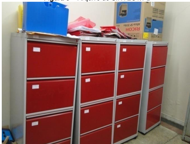
Figura 5 – Arquivo do SINTECT/PB