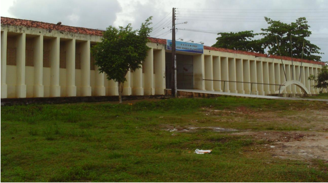
Escola Estadual de Ensino Fundamental e Médio Prof. José Soares de Carvalho.