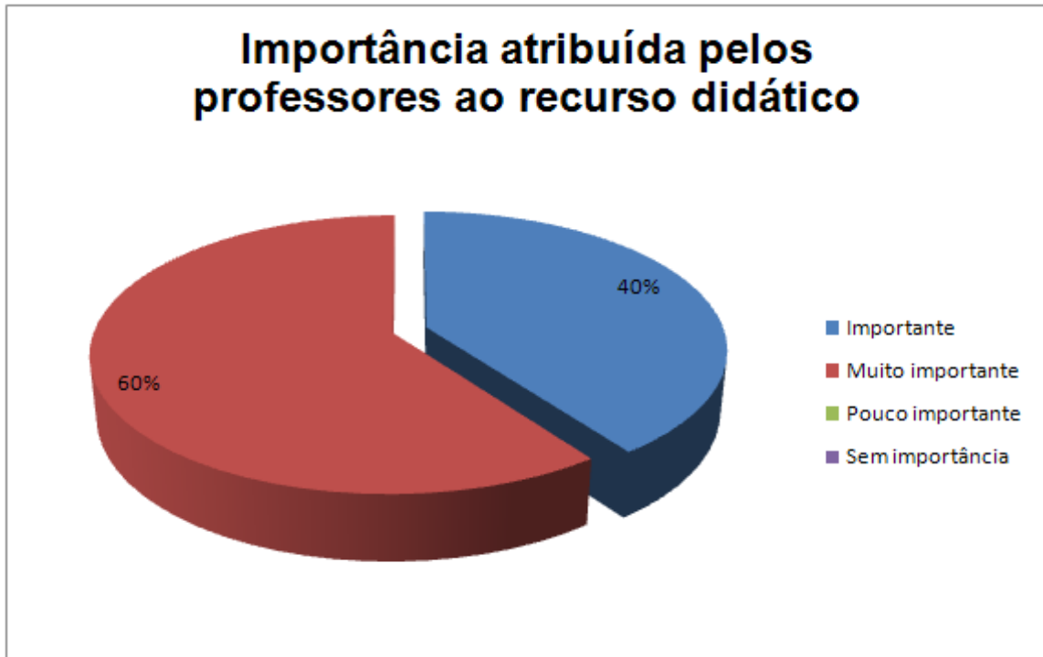
Gráfico 03 – Importância atribuída pelos professores ao recurso didático.

No gráfico 03 é possível observar que quando indagados a respeito da importância atribuída ao recurso didático, 60% consideram muito importante e 40% dos entrevistados consideram como sendo importante o seu uso. Quanto a indagação se os recursos didáticos que a escola disponibiliza são suficientes para que seja desenvolvido um bom trabalho, três professores afirmaram que os mesmos são insuficientes e dois dizem ter meios satisfatórios para o desempenho de suas funções.