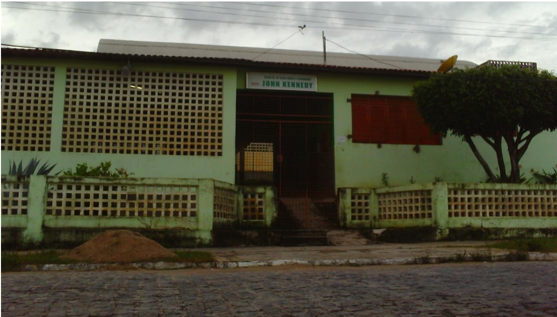
Escola Estadual de Ensino Fundamental e Infantil John Kennedy.

Foram levantados apenas cinco questionários, uma vez que uma das escolas apresentava o mesmo professor de Geografia e em outra a única docente que ministra a disciplina se recusou a respondê-lo, alegando falta de tempo afirmando que a forma de ensinar dos professores, bem como a realidade da educação escolar são duas coisas que todos têm conhecimento.