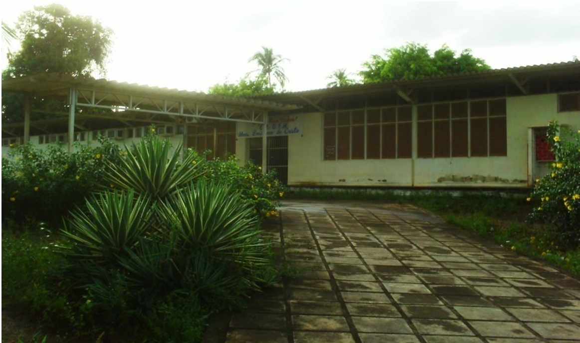
Escola Estadual de Ensino Fundamental e Médio Monsenhor Emiliano de Cristo (polivalente).

Das escolas existentes no município apenas três serviram de base para este estudo, Escola Estadual de Ensino Fundamental e Médio Monsenhor Emiliano de Cristo (polivalente); Escola Estadual de Ensino Fundamental e Infantil Jonh Kennedy; Escola Estadual de Ensino Fundamental e Médio Prof. José Soares de Carvalho.