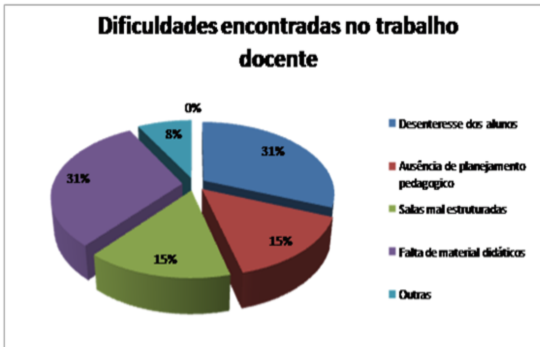
Gráfico 01 – Dificuldades encontradas no trabalho docente

Quando os professores foram questionados a respeito do uso de recursos didáticos, todos (100%) afirmaram usar tais ferramentas como auxílio nas aulas de Geografia. Conforme Amaral (2006) e Lima et al (2008), podem ser classificados como recurso pedagógico tudo aquilo que o professor use para lhe auxiliar em sala de aula. Podemos assim concluir que ao usar o quadro, o giz e o apagador o professor está utilizando tais ferramentas.