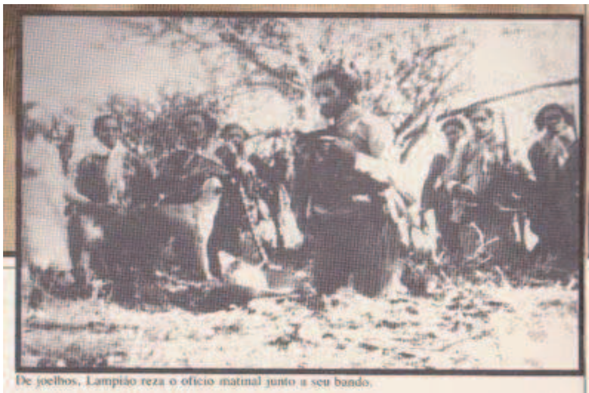
FIGURA 09: Lampião e seu bando rezando o ofício.