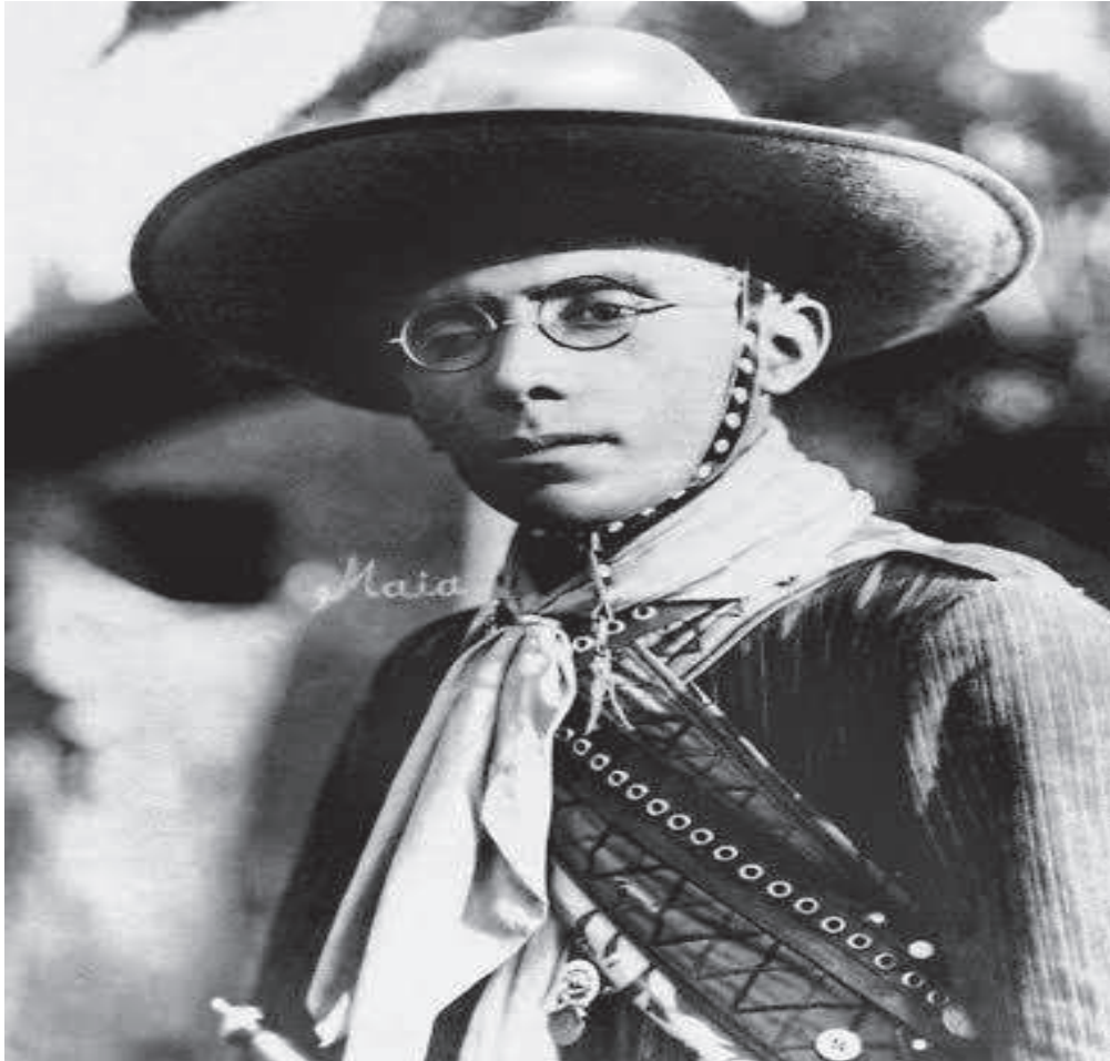
FIGURA 01: Lampião em Juazeiro do Norte.