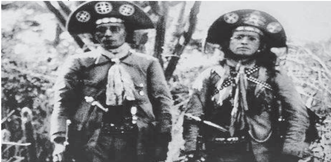
FIGURA 04: Lampião e Juriti.