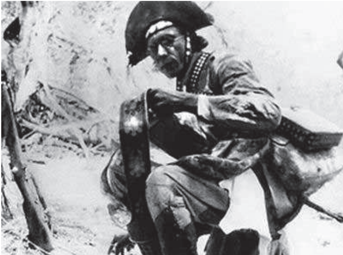
FIGURA 08: Lampião bordando sua cartucheira.