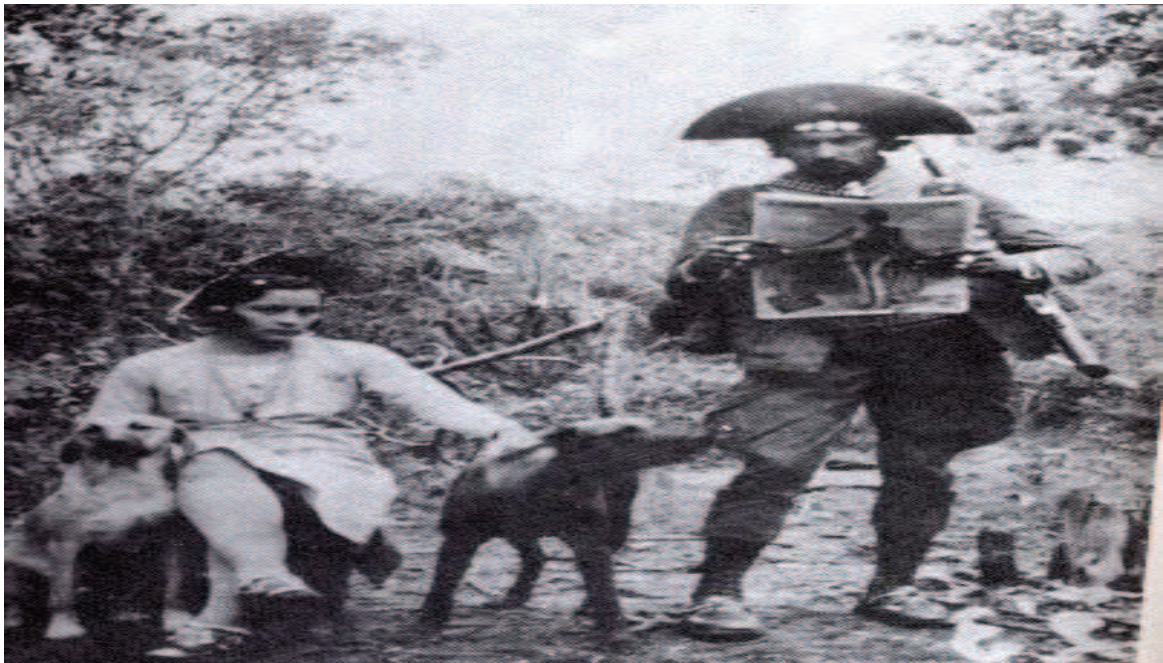
FIGURA 06: Maria Bonita, Lampião e os cachorros.

Com a fotografia, é possível captar a realidade, de tal modo que possibilite vê-la e imaginá-la na medida em que fornece subsídios visuais para a trama das representações pessoais. As imagens aparecem legitimando o texto ou complementando-o, já que as fotografias servem como facilitadoras da memorização dos conteúdos, além de serem mais atrativas a esta geração de alunos. O recurso visual possibilita que o aluno assimile a história de Lampião e seu bando, bem como construa uma opinião acerca dos cangaceiros e suas práticas.