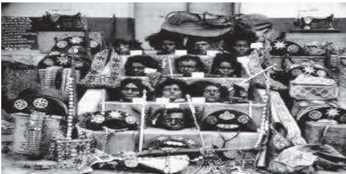
FIGURA 02: Fotografia ícone mostra as cabeças de Lampião (última de baixo), Maria Bonita (logo acima de Lampião) e outros cangaceiros do bando.

idades, vilas, lugarejos e fazendas, espalhando o terror. Travavam grandes batalhas com as volantes. Eram homens com disposição de matar ou morrer, que seguiam adentrando na caatinga a pé e se tornaram uma famosa lenda do Nordeste até os dias atuais. Em 1938, às margens do Rio São Francisco, em Sergipe, morre Lampião, líder do cangaço, num tiroteio com a Polícia Militar. Lampião, Maria Bonita e nove cangaceiros foram mortos e tiveram suas cabeças cortadas. As cabeças foram mumificadas e expostas no Museu Nina Rodrigues, na Bahia, e em 1968 foram enterradas (MELLO 2010).