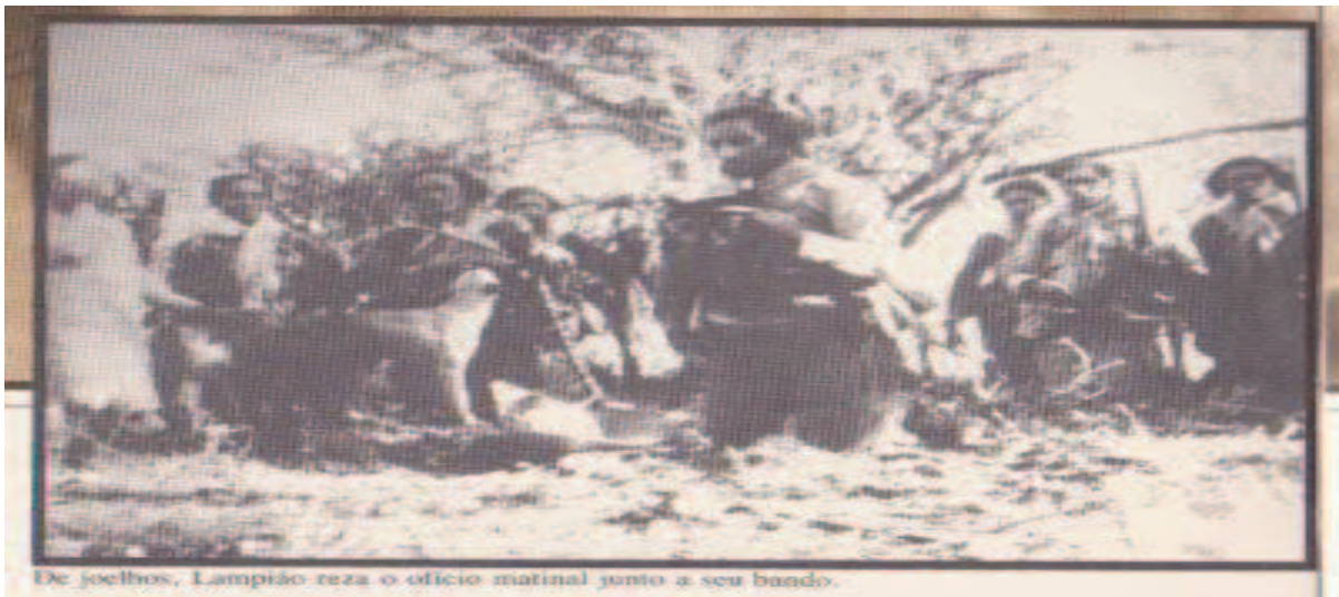
FIGURA 05: Lampião e seu bando rezando o ofício.