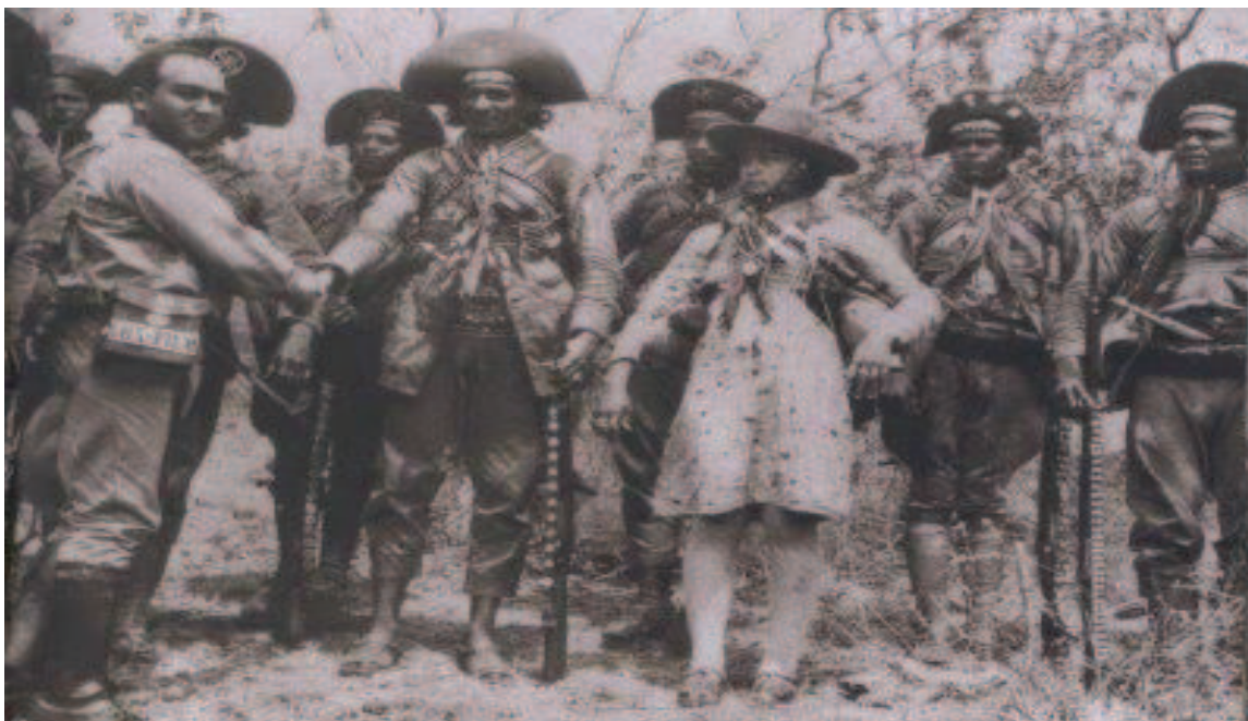
FIGURA 10: Fotografia Benjamim, Lampião, Maria Bonita e o bando.