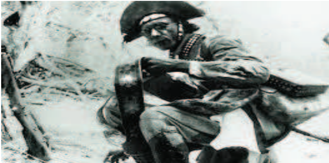
FIGURA 03: Lampião bordando sua cartucheira.

Com isto, destacava o orgulho de ser cangaceiro. Pensar em Lampião como costureiro é muito difícil, pois vai de encontro a todo o machismo que se vê em torno do cangaço, até porque a ideia que se tem de Lampião é a de um homem perverso e brutal. O líder do cangaço era visto pelas pessoas de seu convívio como um caboclo de 1,80m, calmo e bem-educado (MELLO, 2010).