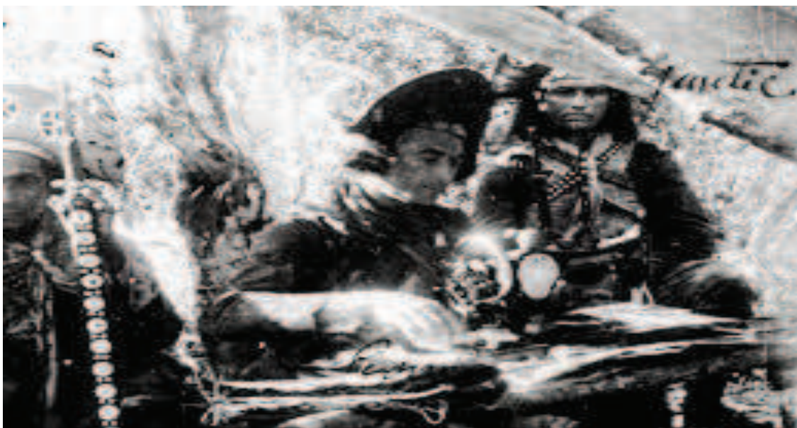
FIGURA 07: Lampião costurando no acampamento.