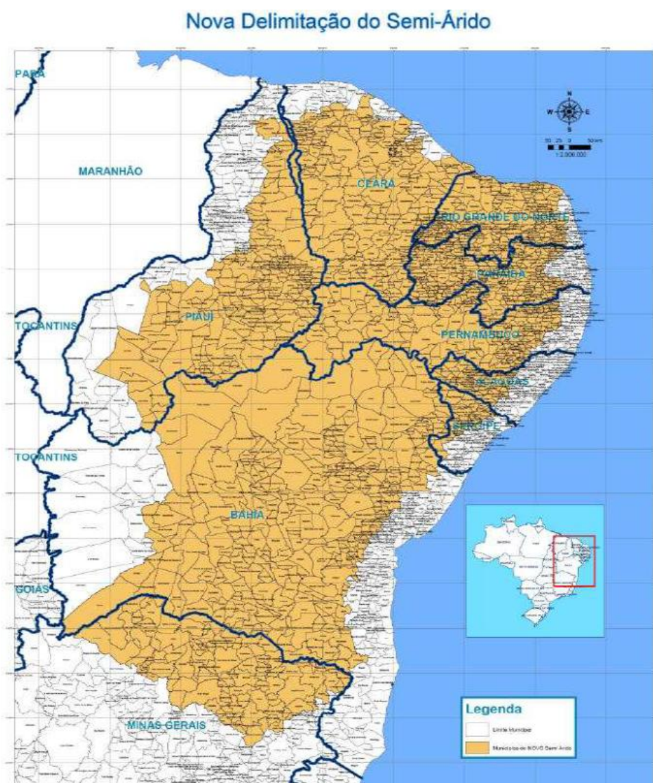
Figura 1 Mapa da delimitação da região do semiárido