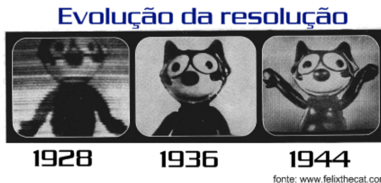
Imagem 5 - A evolução da qualidade das imagens com o passar dos anos 6

De acordo com Veronezzi (2007), a chegada dos computadores e da internet em 1980 o jornalismo se reinventa mais uma vez dando início ao chamado web jornalismo que apresenta características como agilidade da linguagem, o baixo custo de produção e a velocidade de atualização. Apesar da sua expansão, popularidade e crescimento esse tipo de mídia ainda não ultrapassou a hegemonia da televisão que continua se mantendo como preferência na busca por informação, esportes, entretenimento entre outros.