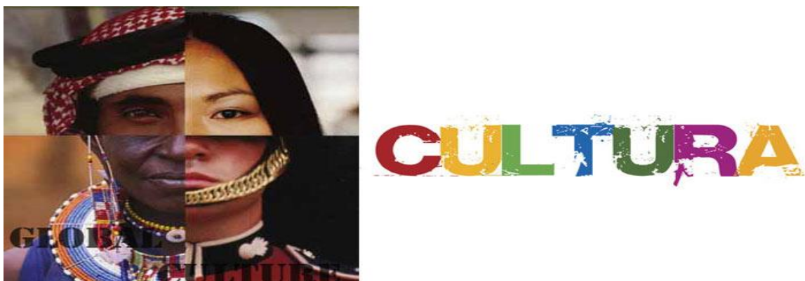
Imagem 1 - Representação ilustrativa do termo cultura 1

É através da cultura que nos diferenciamos de outros povos e assumimos a nossa própria identidade. A cultura faz do homem humano, eleva-o e prepara seu espírito; fortalece o caráter e o “conhecer” abre portas para o respeito aos semelhantes e estimula-o para a evolução. O que certifica unidade ao homem “(...) é a sua aptidão à variação cultural”. Ou seja, “(...) aquilo que os seres humanos têm em comum é a sua capacidade para se diferenciar uns dos outros, para elaborar costumes, línguas, modos de conhecimento, instituições, jogos profundamente diversos” (LAPLANTINE, 1994, p. 22). Sem a cultura possuímos apenas nossa primeira natureza: a natureza biológica, somos “homem”, considerando a classificação das espécies animais, ou seja, gênero (Homo), espécie (Sapiens).