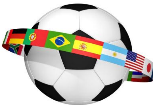
Imagem 14 - Representação simbólica da união entre futebol e nações 19