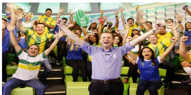
Imagem 10 - Clima de animação no estúdio do Central da Copa 2014 13

Central da Copa - É um programa não fixo na grade da emissora que cobre eventos ligados a seleção brasileira de futebol e foi lançado em 2010 no período da Copa do Mundo da África. Seguiu para 2013 cobrindo o período da Copa das Confederações e retornou em 2014 na Copa do Mundo do Brasil. O forte da Central da Copa é a interação dos apresentadores com os internautas, além disso faz uso de modernos recursos tecnológicos para mostrar e analisar os principais lances. O Central da Copa é apresentado por Ernesto Lacombe, Alex Escobar, e Tiago Leifert.