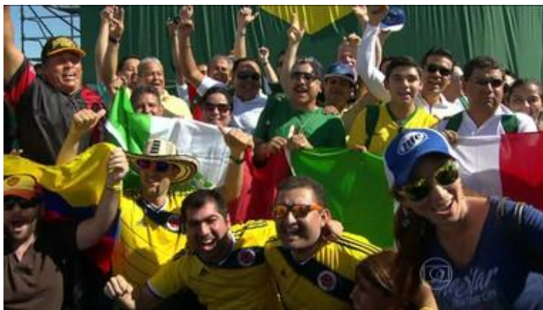
Imagem 15 - Essa é uma das imagens que aparecem na reportagem, o momento mostra a recepção calorosa dos brasileiros para os turistas estrangeiros 21

Numa visão generalista, o Brasil e o brasileiro abraçaram o variado leque cultural que é resultado da chegada dos turistas de várias partes do mundo, estes são recebidos como celebridades que merecem todo um tratamento especial. Toda essa receptividade positiva é uma representação do que chamamos de relativismo cultural, pois os brasileiros receberam os turistas sem classificar as culturas dos mesmos como boa ou ruim, superior ou inferior a sua. O clima de festa contribui para esse relativismo, as pessoas acabam ficando mais receptivas umas com as outras. Consideramos importante que em eventos como a Copa do Mundo esse relativismo aconteça de forma a influenciar os outros acontecimentos da vida quando o clima de festa não está mais presente, seria o bom exemplo semeado no evento perpetuando após o seu fim. No prosseguimento da vida, no cotidiano das pessoas. As convivências que foram mostradas pela reportagem nas três cidades em que ela foi realizada atuam justamente se opondo ao pensamento etnocentrista.