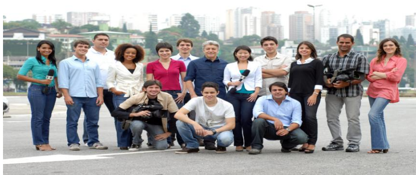
Imagem 13 - O apresentador Caco Barcelos e sua equipe do Profissão Repórter 18