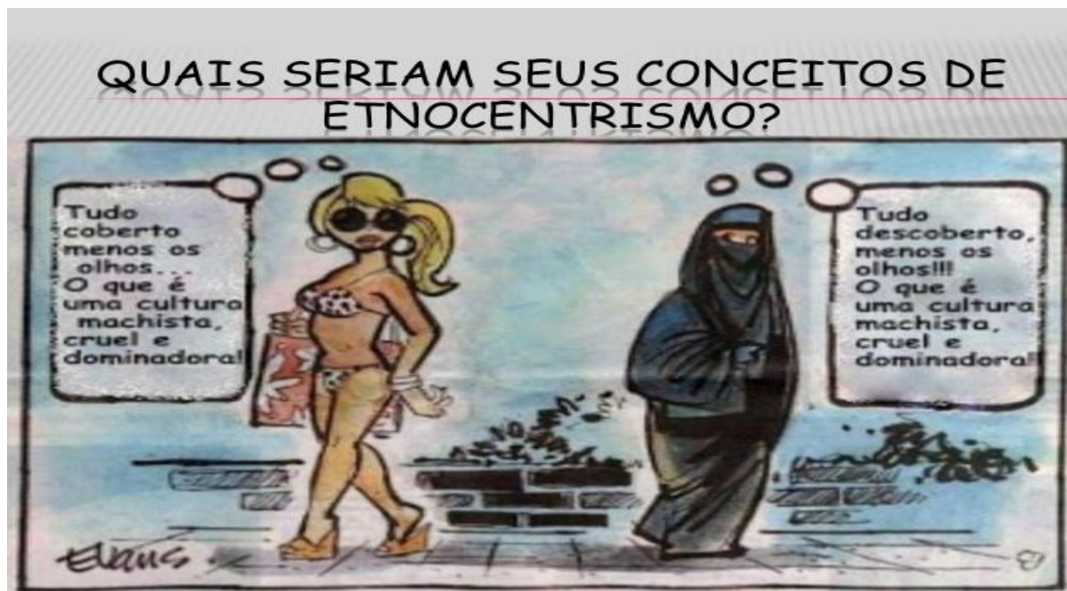
Imagem 2 - Charge que representa uma situação etnocêntrica 2

Percebe-se então que o grupo do “eu” aponta uma visão superior, a melhor, a correta e natural. O grupo do “outro” fica nessa lógica do anormal, absurdo e até engraçado (ROCHA, 1988). De qualquer forma, a sociedade do “eu” é a melhor, a superior. Representada como o espaço da cultura e da civilização por onde existe o saber, o trabalho, o progresso. A sociedade do “outro” é atrasada. E o espaço da natureza. São os selvagens, os bárbaros. São qualquer coisa menos humanos, pois, estes somos nós. O barbarismo evoca a confusão, a desarticulação, a desordem.