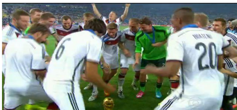
Imagem 19 - Retirada da parte final da reportagem, mostra o momento em que os jogadores comemoram fazendo a dança que aprenderam com os índios da Aldeia Pataxó 25