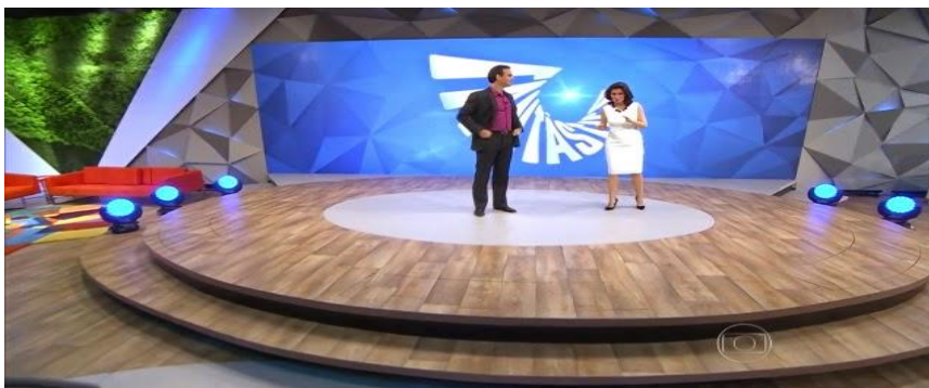
Imagem 12 - Fantástico 2014 sendo apresentado por Tadeu Schmidt e Renata Vasconcelos 17