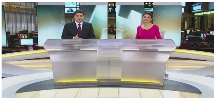
Imagem 11 - Evaristo Costa e Sandra Annenberg apresentando o Jornal Hoje 16

Como conteúdo fundamental para a realização desse trabalho separamos alguns registros de cunho multicultural e que possuem as características citadas anteriormente apresentados por alguns programas do telejornalismo de generalidades da Rede Globo que serão melhor explorados posteriormente. As reportagens foram extraídas dessas três produções da emissora: Jornal Hoje, Fantástico e Profissão Repórter.