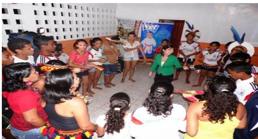
Imagem 18 - Imagem da reportagem mostrando os índios brasileiros torcendo pela Alemanha na final da Copa do Mundo 2014 24

Com a vitória da seleção alemã, os momentos finais da reportagem mostram imagens da comemoração dos índios e dos jogadores da Alemanha que em determinado momento fazem uma dança que aprenderam com esses índios. Isso é um exemplo claro de transculturação já que demonstraram a incorporação de um elemento que não faz parte da cultura alemã. Essas imagens justificam o que o texto da reportagem diz, principalmente as respostas que foram dadas pelos índios entrevistados, mesmo não participando diretamente da produção feita pela Globo os jogadores da seleção alemã retribuíram o carinho dos índios para com eles através da homenagem feita em campo no ato da comemoração da taça. Confirmando assim todo o contexto da reportagem.