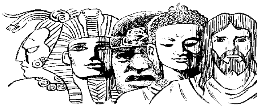
Imagem 3 – Ilustração de símbolos religiosos de diferentes culturas 3

Pode-se inferir então que a principal intenção do relativismo cultural é apontar a necessidade de nos afastarmos de possíveis julgamentos, evitando classificar a cultura do outro como inferior, feia, errada, atrasada ou algo nessa direção. Essa ideia nos conduz a um sentimento de profundo respeito à estrutura de funcionamento peculiar a cada cultura. O pensamento de superioridade é condenado. O relativismo cultural atua de forma importante para que as culturas não sejam classificadas através de camadas hierárquicas.