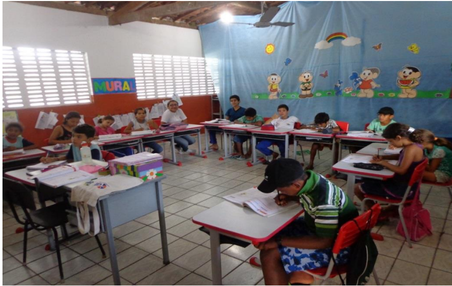
Foto 4 – Professora e alunos do 3º e 4º anos (Sala multisseriada)