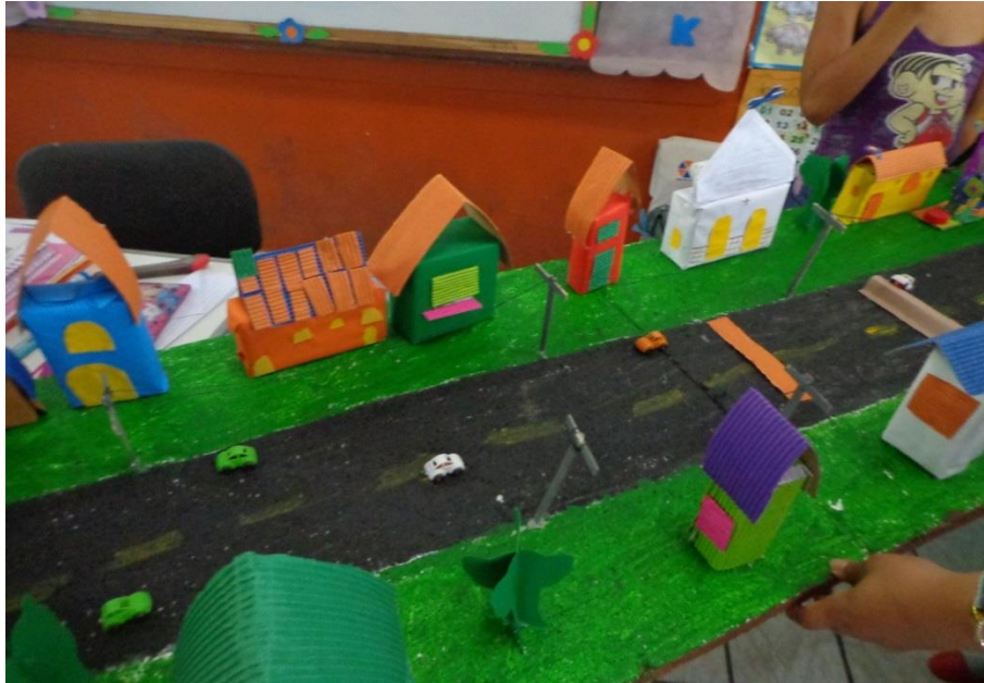
Foto 3- Maquete do Sítio Raspadinha produzida pelos alunos do 3º e 4º ano