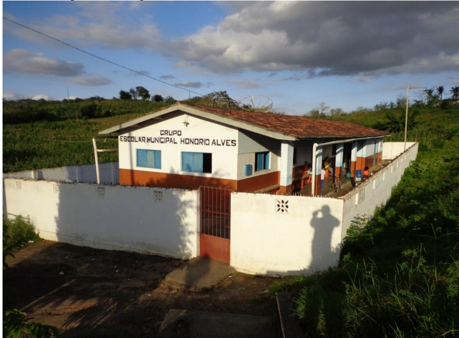
Foto 1 – Escola Municipal de Ensino Infantil e Fundamental Honório Alves – Sítio Raspadinha – Ingá-PB

reduzido e também os alunos ficam expostos ao contato com doentes, conforme afirmou uma das mães.