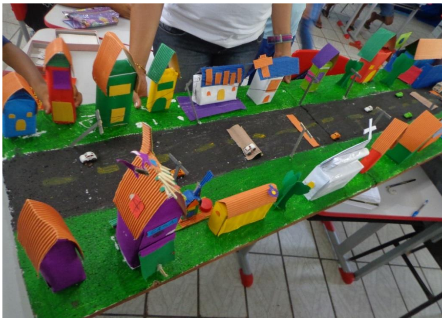
Foto 2- Maquete do Sítio Raspadinha produzida pelos alunos do 3º e 4º ano

Isso mostra o desenvolvimento de atividades escolares através de projetos que envolvem o cotidiano dos alunos. Atividades que denotam importância da prática pedagógica da Educação do Campo, porque envolve a comunidade escolar no seu planejamento e execução, o que implica numa melhor compreensão do conteúdo, uma vez que a temática desenvolvida está vinculada à realidade vivida pela comunidade.