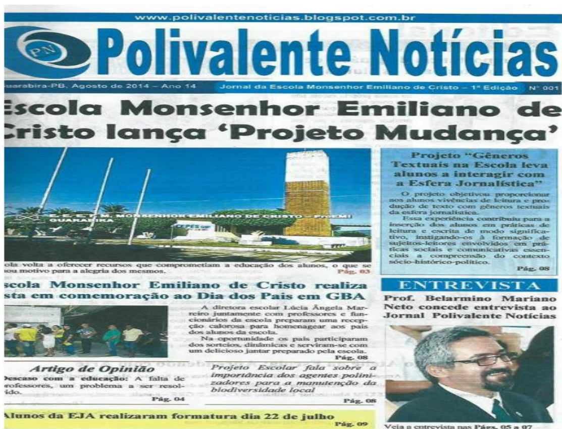
Imagem 2 – Capa do jornal impresso produzido pelos alunos.