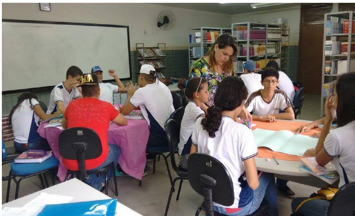
Imagem 1 – Realização da oficina sobre o Gênero Textual Notícia.

Abaixo algumas fotos do projeto desenvolvido na escola.