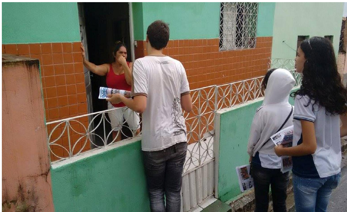
Imagem 3 – Entrega dos jornais impressos na comunidade onde a escola está inserida.