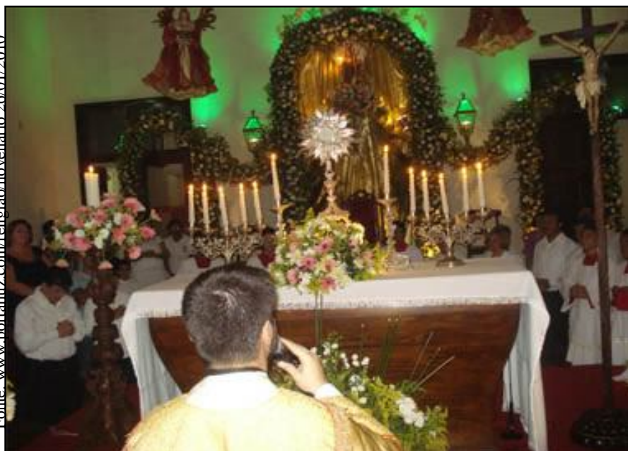
Novena de Nossa Senhora da Luz, adoração ao Santíssimo – Guarabira-PB