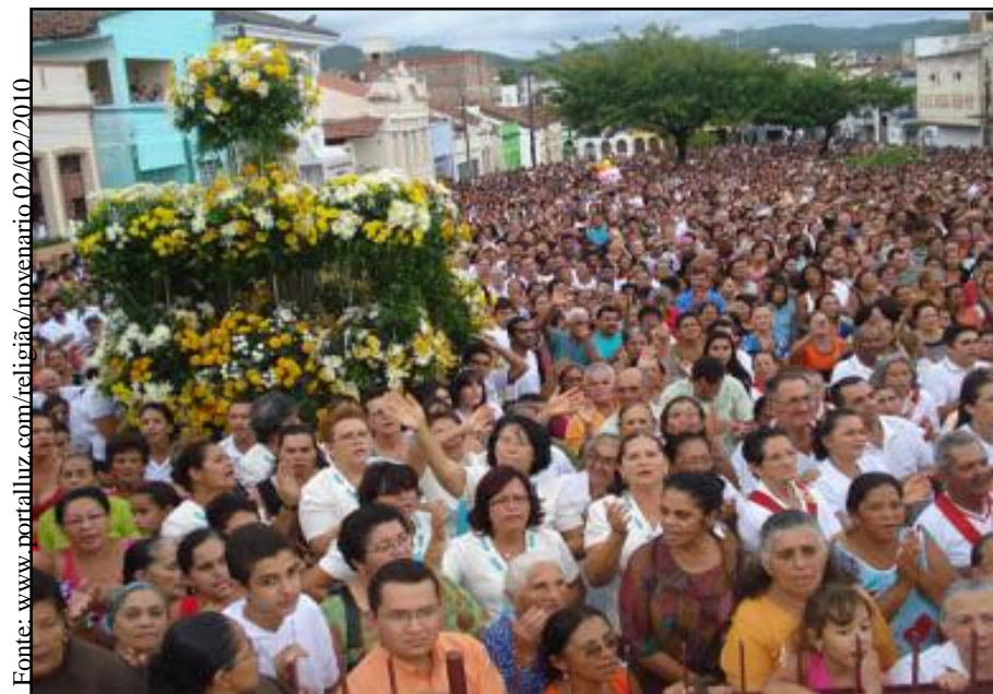
Missa de encerramento da festa de Nossa Senhora da Luz – Guarabira-PB