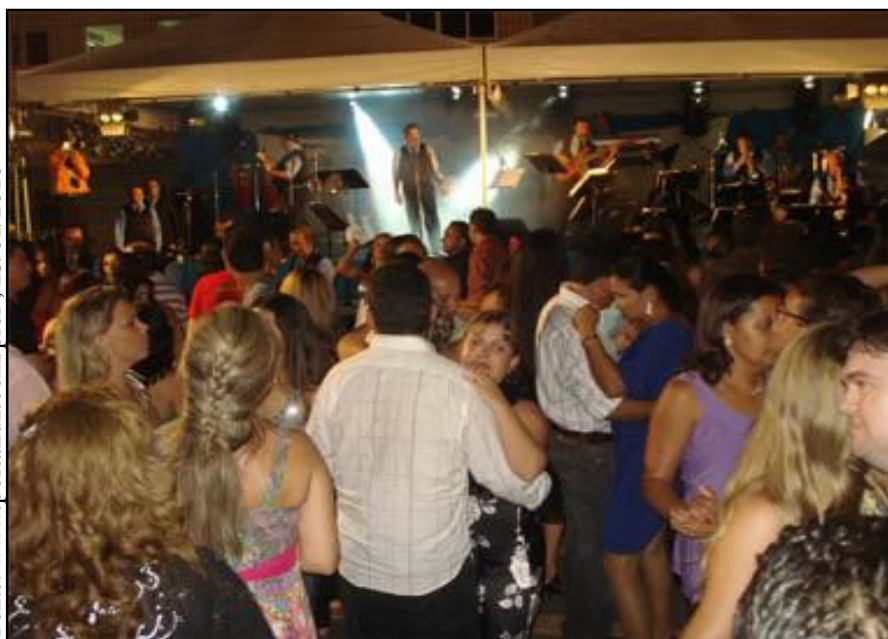
Pavilhão da festa da Luz – Guarabira-PB