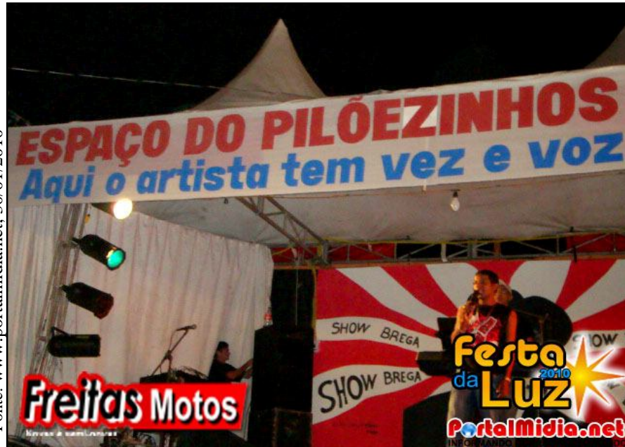
Artistas da terra no palco pilôezinhos, festa da Luz – Guarabira-PB

Fonte: http://blogsolangealmeida.com.br/ , 01/02/2010