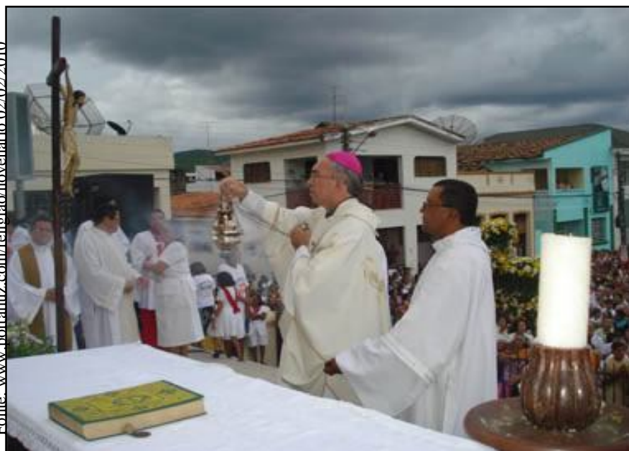
Procissão de Nossa Senhora da Luz – Guarabira-PB