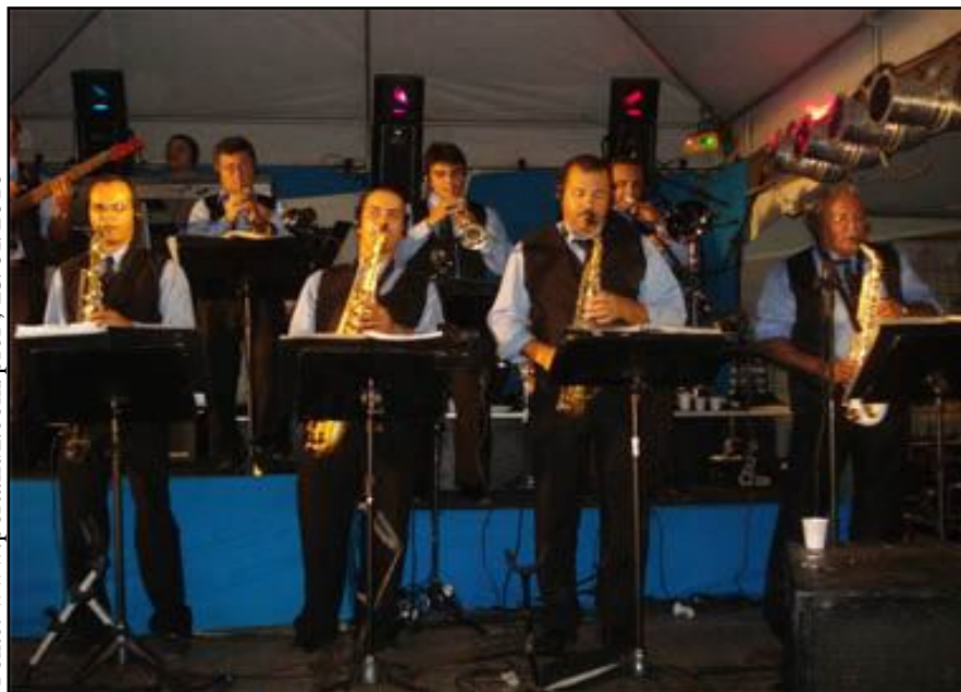
Pavilhão festa da Luz, apresentação de orquestras – Guarabira-PB