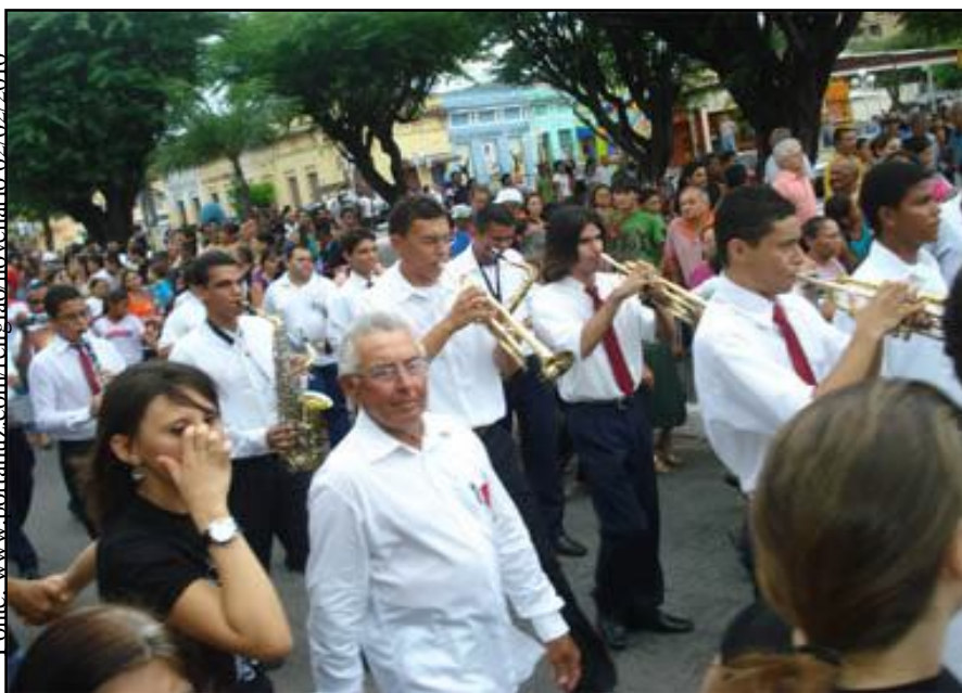
Procissão de Nossa Senhora da Luz – Guarabira-PB