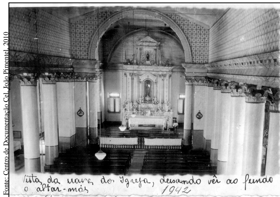
Interior da Catedral de Nossa Senhora da Luz ano de 1942, Guarabira-PB