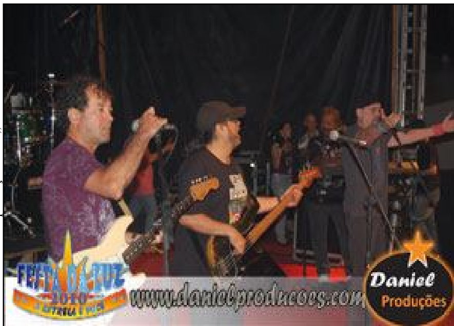
Banda The Fevers na festa da Luz – Guarabira-PB

Fonte: www.danielproduções.com , 29/01/2010