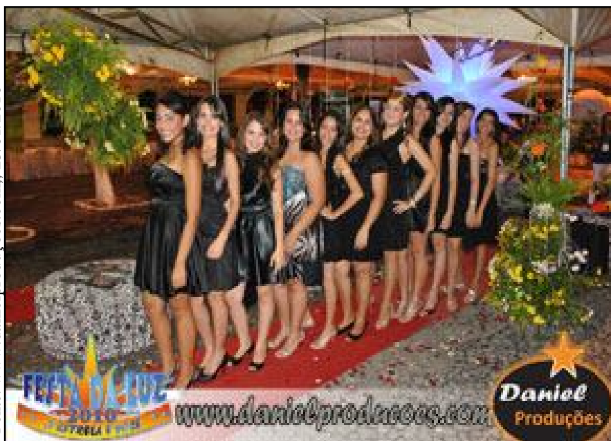
Concurso de beleza no pavilhão da Festa da Luz – Guarabira-PB

Fonte: www.danielproducoes.com , 23/01/2010