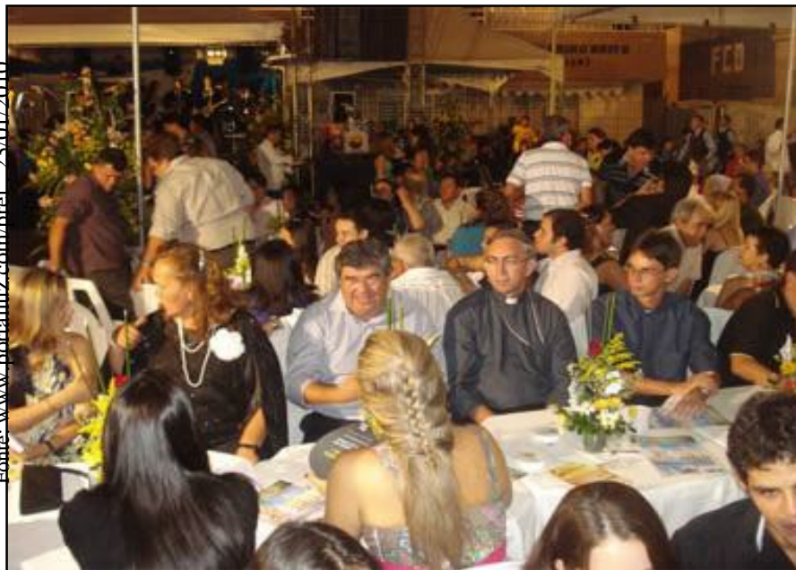
Pavilhão da festa da Luz – Guarabira-PB