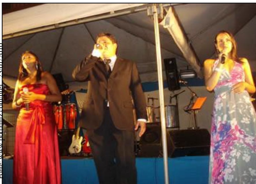
Pavilhão da festa da Luz, apresentação de bandas – Guarabira-PB