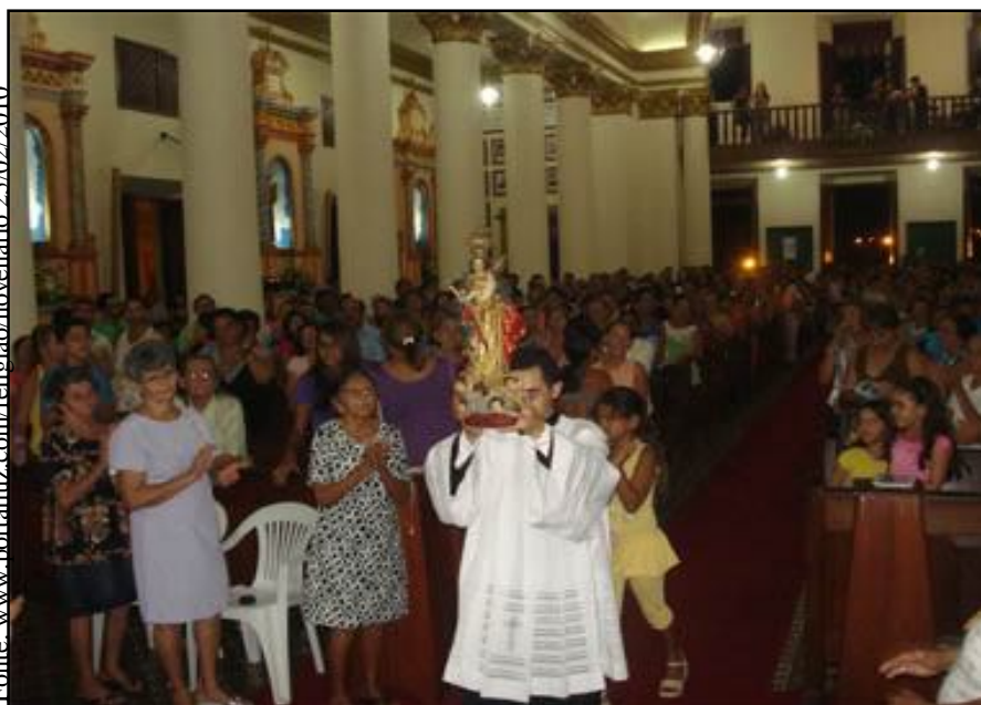
Novena de Nossa Senhora da Luz na catedral de Guarabira-PB.