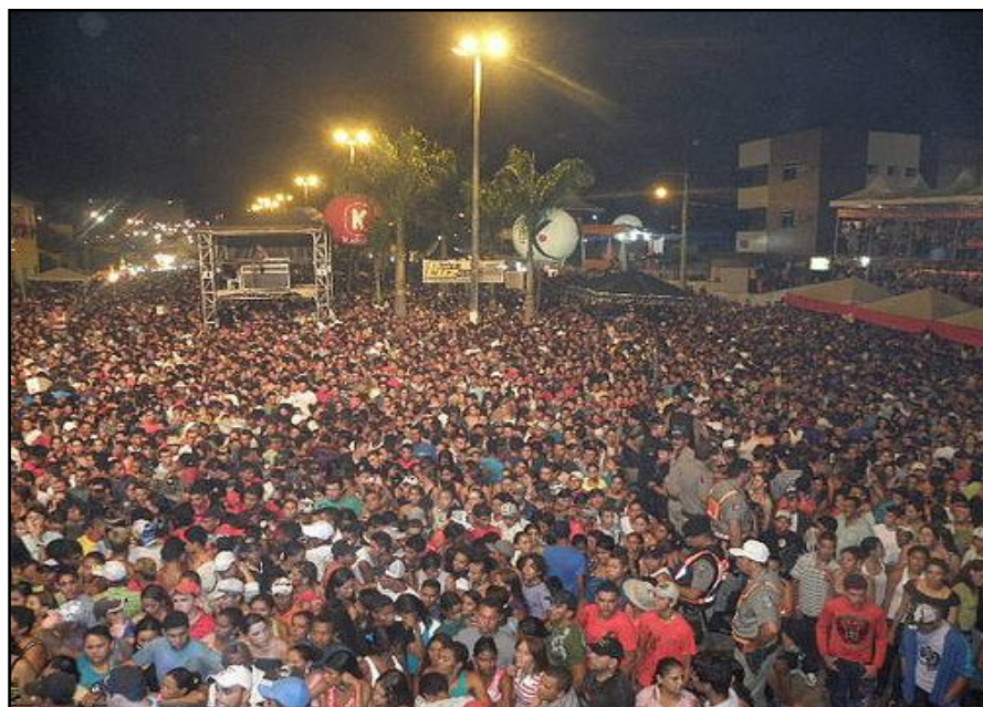
Festa profana de Nossa Senhora da Luz – Guarabira-PB