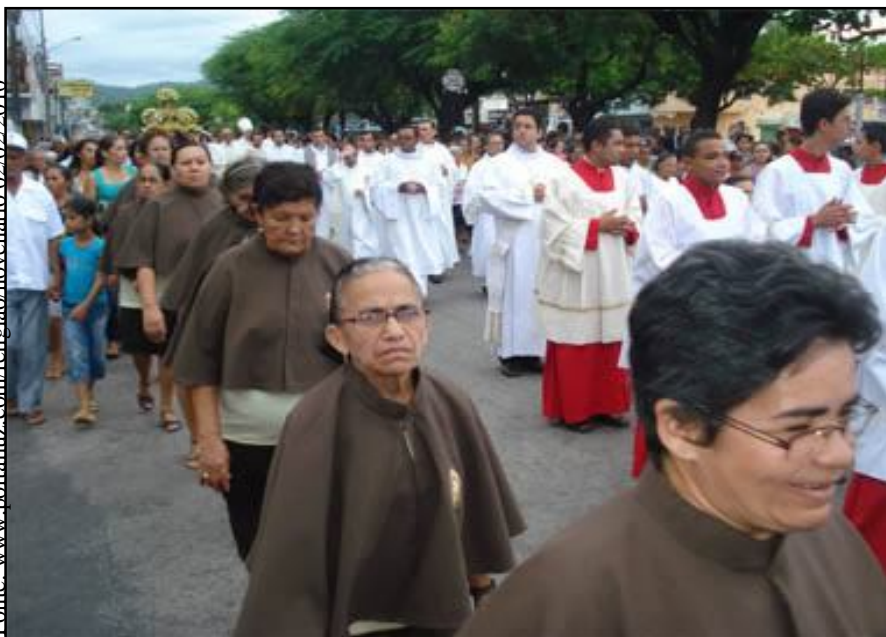
Procissão de Nossa Senhora da Luz – Guarabira-PB