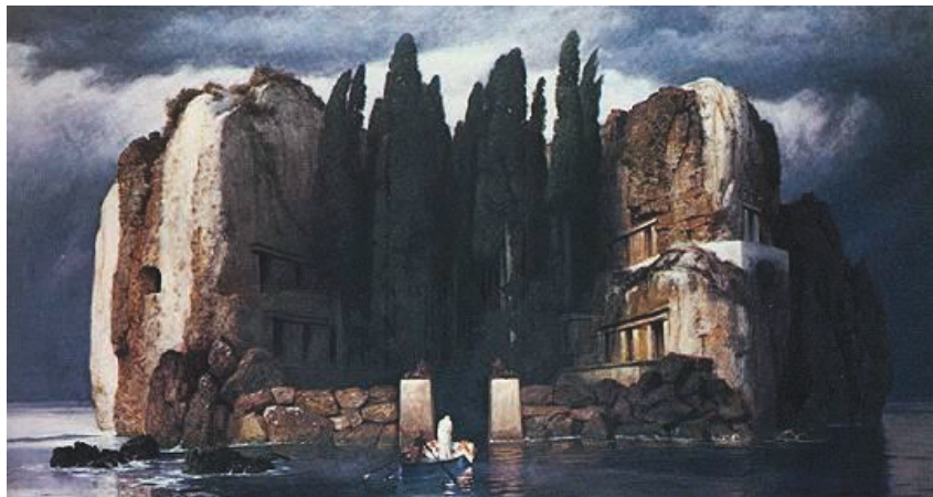
BÖCKLIN, Arnold. The isle of the dead . 1880. Óleo sobre tela, 111 cm x 155 cm.

Essa obra reflete também a própria situação de vida da pianista e de sua família, este quadro está intimamente ligado à condição da artista que Renata representa. Buscando uma solução para si, tentando entender-se, ela adentra a imagem do quadro: