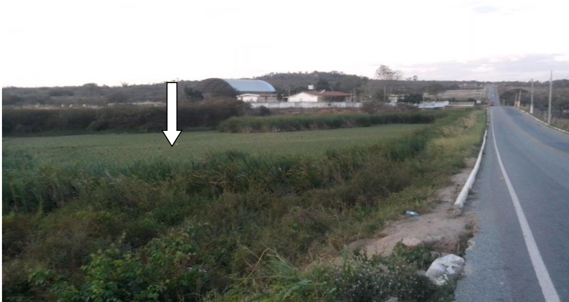
Figura 10: Açude velho