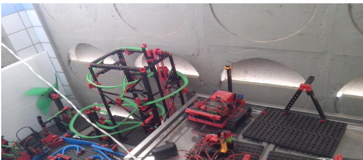
Figura 3: fotografia representativas do laboratório de robótica.

Ainda na atividade pesquisa, fomos conhecer a sala de Robótica sobre o rientação de professores da área matemática, o mesmo relatou que os alunos aprenderam e se divertiram com as máquinas construídas por eles próprio como podem ver, o Laboratório de Robótica ( figura 3 ) constitui um espaço escolar voltado para aulas práticas, possuindo equipamentos didáticos que estimulam a curiosidade dos alunos, como, por exemplo equipamentos permitindo aos estudantes adquirir conhecimentos sobre o funcionamento e montagem de robôs. Conta, ainda, com equipamentos para as aulas de Química, uma estufa para esterilização dos materiais utilizados. O ambiente é climatizado para o conforto dos alunos e monitores.