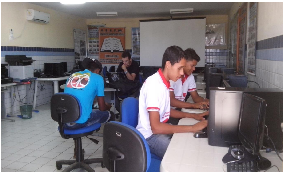
Figura 5: Sala de Informática.