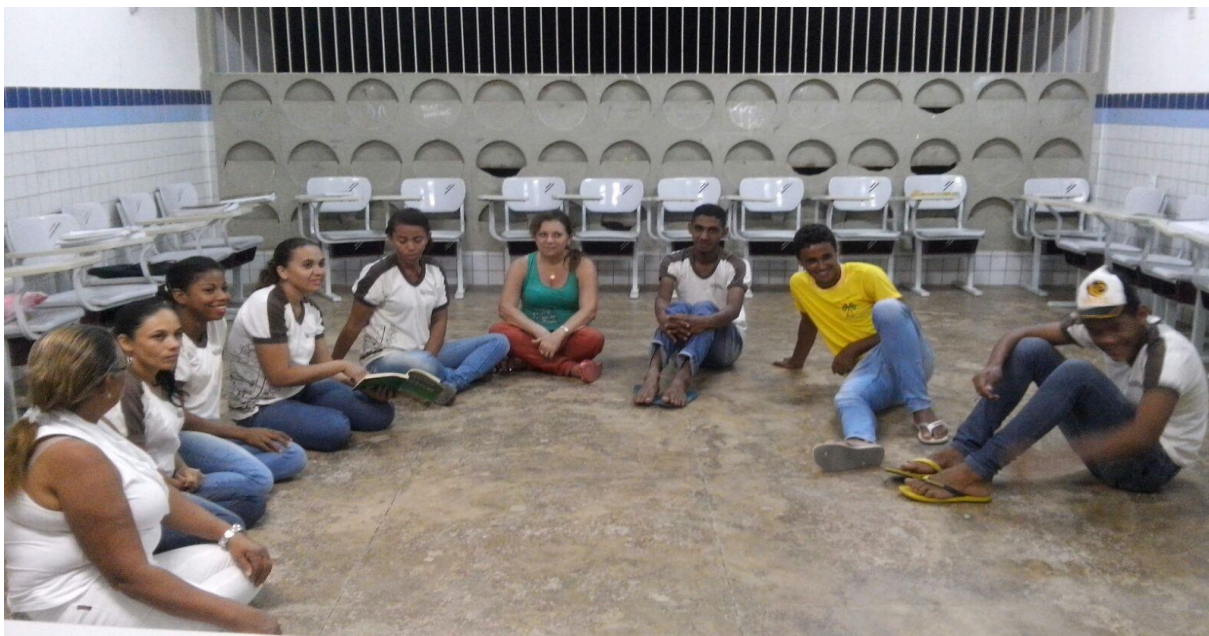
Figura 2: Sala de Aula da 8° série eja.

Ainda na atividade pesquisa, fomos conhecer a sala de Robótica sobre o rientação de professores da área matemática, o mesmo relatou que os alunos aprenderam e se divertiram com as máquinas construídas por eles próprio como podem ver, o Laboratório de Robótica ( figura 3 ) constitui um espaço escolar voltado para aulas práticas, possuindo equipamentos didáticos que estimulam a curiosidade dos alunos, como, por exemplo equipamentos permitindo aos estudantes adquirir conhecimentos sobre o funcionamento e montagem de robôs. Conta, ainda, com equipamentos para as aulas de Química, uma estufa para esterilização dos materiais utilizados. O ambiente é climatizado para o conforto dos alunos e monitores.