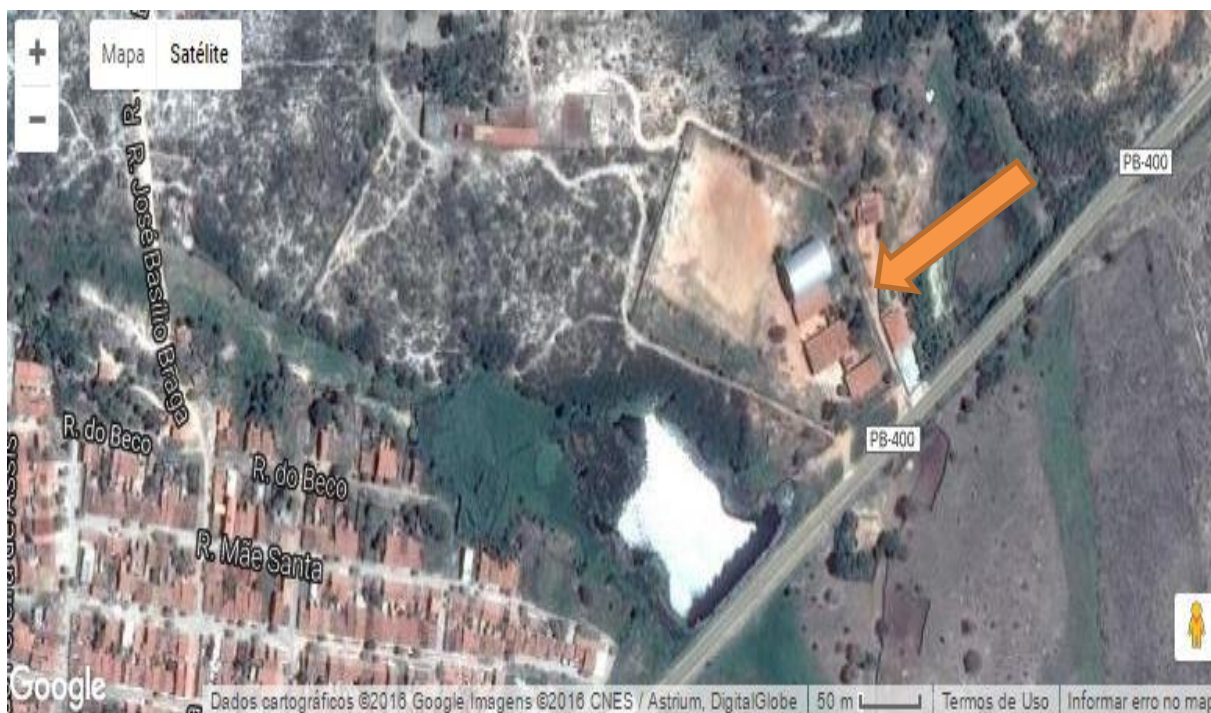
Figura 1: Mapa de Localização da Escola Bonifácio Saraiva de Moura, fonte: Google maps. 2015.

A Escola Bonifácio Saraiva de Moura está localizada na Rua Projetada S/Nº, enfrente a PB-400 que liga as cidades de Bonito de Santa Fé- PB, Monte Horebe - PB, São José de Piranhas- PB e Cajazeiras PB. Como podem ver na figura 1 .