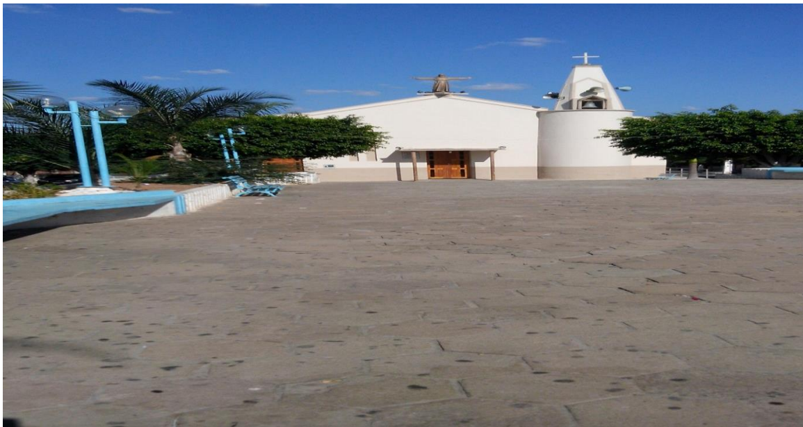
Figura 9: Igreja Matriz Fonte: Lúcia Dias, 2015.

Durante estudo de campo levamos os alunos para conhecer as dependências e pontos históricos da cidade como a igreja matriz figura 9 e na figura 10 o açude velho poluído e onde desaguas os esgotos da cidade de Monte Horebe-PB.