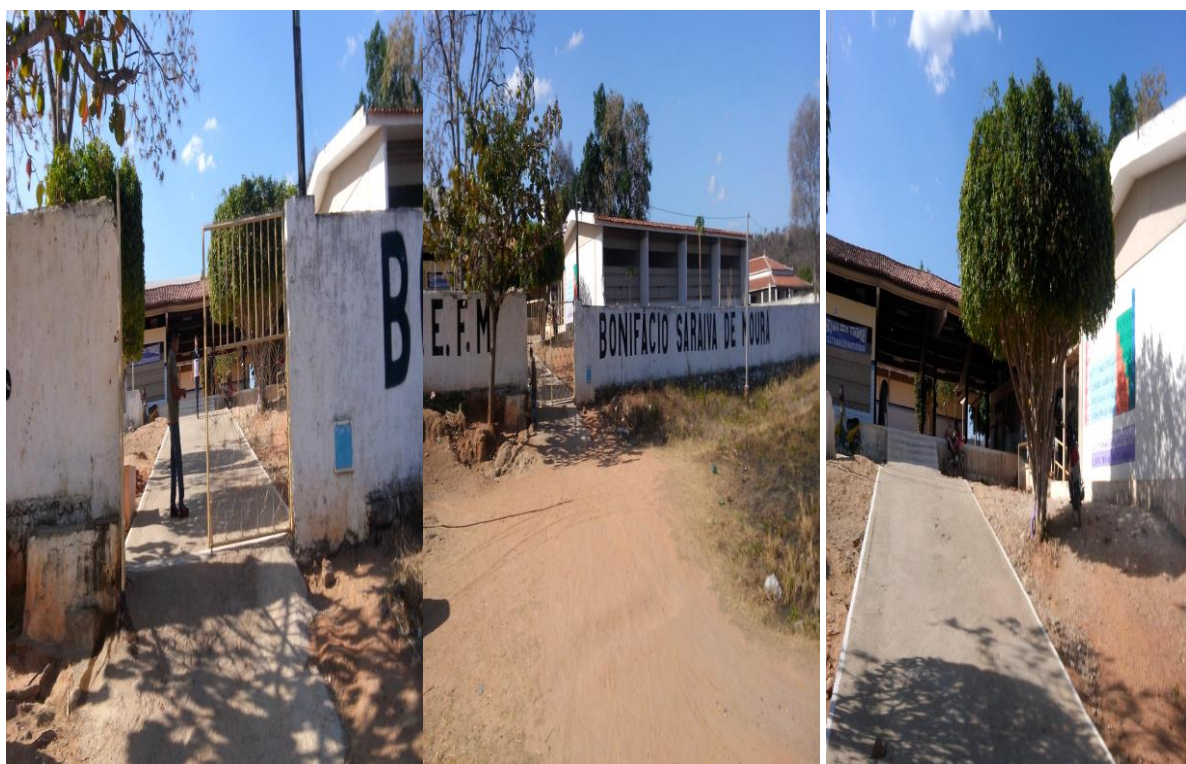
Figuras 6, 7 e 8: Lúcia Dias, 2015.

Desse modo, o mosaico com as figuras 6, 7 e 8 respectivamente, mostram a entrada da escola Bonifácio Saraiva de Moura Município de Monte Horebe