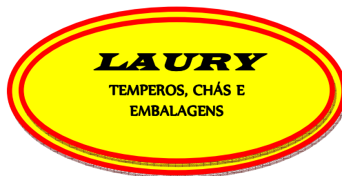
Fig. 1 - Logotipo da empresa