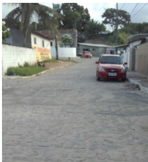
Figura 4: Parte alta da comunidade São Rafael em 2016.