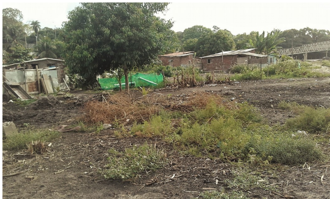
Figura 7: Aspectos das casas as margens do rio Jaguaribe em 2016.

possibilidades de renda de cada morador, os que chegaram mais recentemente sujeitos à piores condições de moradia na região sujeita às enchentes (Figura 7).