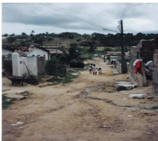
Figura 3: Aspecto da Comunidade São Rafael em 2002

Inicialmente estas casas não apresentavam uma rede de esgoto, o esgoto produzido era destinado diretamente para o rio, também não havia energia, nem pavimentação das ruas como foi dito por uma moradora: “Faz uns 42 anos que vim morar aqui, não tinha energia, nem água, agora está bem melhor” (Figura 3). Moradores destacaram que quando um membro de uma família construía uma casa, parentes de outras cidades ou outros bairros vendo que essa era uma boa alternativa também começavam a construir suas casas, desenvolvendo-se assim uma pequena comunidade, e foi a partir desse crescimento populacional que o rio Jaguaribe foi começando a ser poluído “Era lindo o rio, mas depois que começou a aumentar a população, ele se acabou todinho, no início como era pouca gente que morava aqui, a gente cuidava e evitava jogar lixo no rio, mas foi chegando mais gente, então a gente não tinha mais controle, fora o esgoto, que ia direto pro rio”.