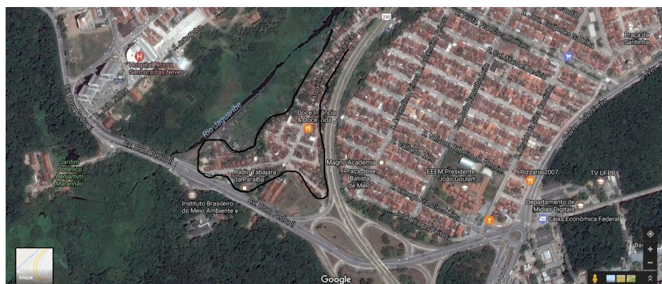
Figura 2: Imagem aérea da comunidade São Rafael

Pela composição geográfica da comunidade São Rafael, percebemos que existem duas áreas distintas, uma delas situada em um terreno mais elevado que se encontra próximo a BR-