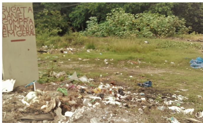
Figura 6: Aspecto da Poluição próximo às margens do rio Jaguaribe.

Eles dizem que a intensificação da poluição nessa porção do rio se deu na década de 1990, numa alternativa de remediar o problema do esgoto que corria a céu aberto, os próprios moradores construíram em suas casas um sistema de coleta de esgoto que desaguava diretamente no rio, no entanto por ser apenas uma estratégia temporária até que o poder público se mobilizasse, não atendia toda a comunidade. Apontam também uma parcela de responsabilidade da população, pois jogavam sucatas, móveis, pneus e outros objetos sem utilidade, contribuindo assim para degradação (Figura 6). Como relata SANTOS (2007) que as intervenções humanas realizadas ao longo da bacia hidrográfica são os grandes causadores de danos, a deposição de resíduos sólidos (lixo e materiais volumosos) nas margens dos rios é um dos agravantes pois podem ficar retido nos pilares das pontes, reduzindo a seção de escoamento ou o entupimento das canalizações.