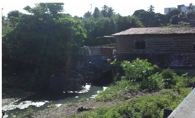
Figura 5: Parte baixa da comunidade São Rafael em 2016.

Durante as conversas com os moradores da parte alta da comunidade os mesmos me informaram que apesar de morarem nas áreas mais estruturadas e não serem atingidas pelas enchentes sempre colaboram junto à Associação para mitigar as ações decorrentes das enchentes que atingem os moradores das regiões mais baixas, chegando mesmo a participarem de ações para preparar as casas para os períodos de chuva, bem como, ajudar retirada das águas e lama das mesmas após as inundações. Estas ações conotam um traço significativo de solidariedade entre os dois níveis que compõe a realidade da comunidade.