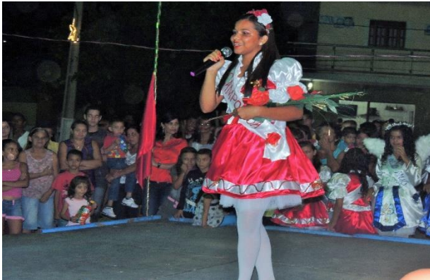
Figura 13: Oferecimento de ramalhetes da Lapinha. Praça dos Trabalhadores – Dona Inês/PB.