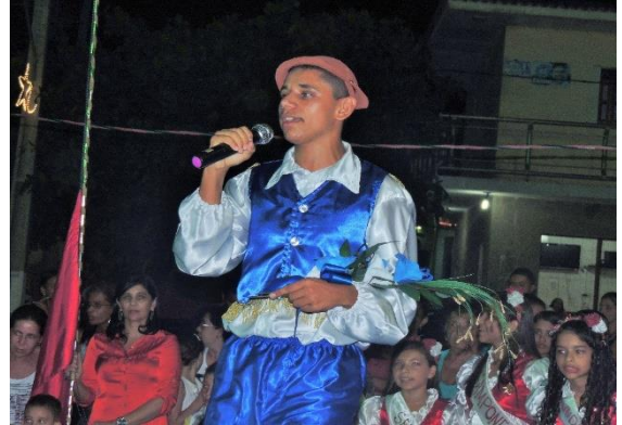
Figura 14: Oferecimento de ramalhetes da Lapinha. Praça dos Trabalhadores – Dona Inês/PB.