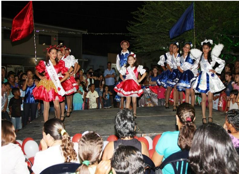
Figura 05: Abertura do Espetáculo da Lapinha. Praça dos Trabalhadores – Dona Inês/PB.