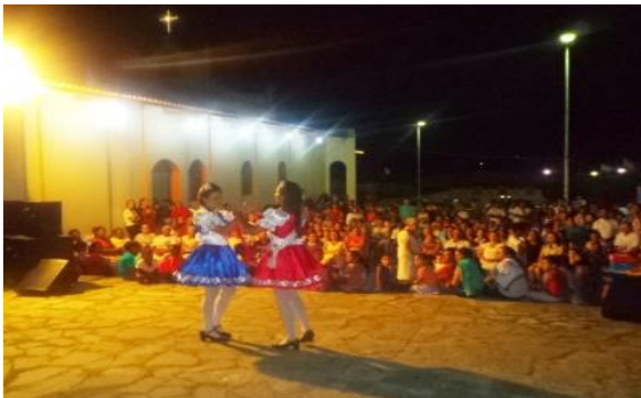
Foto 11 –Prisão da Contra Mestra pela Camponesa. Lapinha como atração cultural no Novenário de Santa Inês e São Sebastião – Dona Inês/PB.