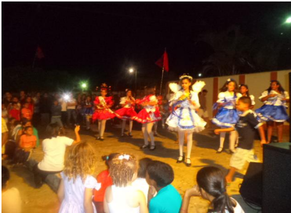
Figura 06: Momento de canções voltadas ao Natal. Lapinha como apresentação cultural no Novenário de Santa Inês e São Sebastião – Dona Inês/PB.