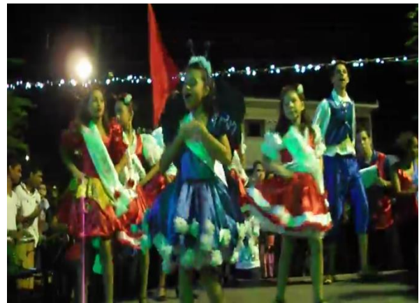
Figura 07: Entrada da Borboleta da Lapinha. Praça dos Trabalhadores – Dona Inês/PB.