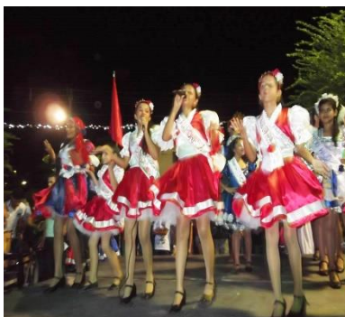
Figura 09: Subida do Cordão Encarnado da Lapinha. Praça dos Trabalhadores – Dona Inês/PB.

Fonte: Secretaria Municipal de Assistência Social e Habitação, 2013.