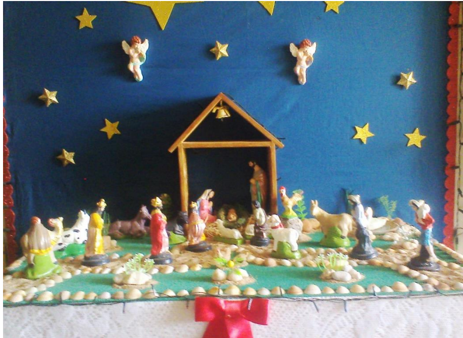
Figura 02: Presépio: Representação da cena da natividade de Cristo.