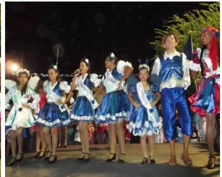
Foto 10: Subida do Cordão Azul da Lapinha. Praça dos Trabalhadores – Dona Inês/PB.

Fonte: Secretaria Municipal de Assistência Social e Habitação, Dezembro de 2013.