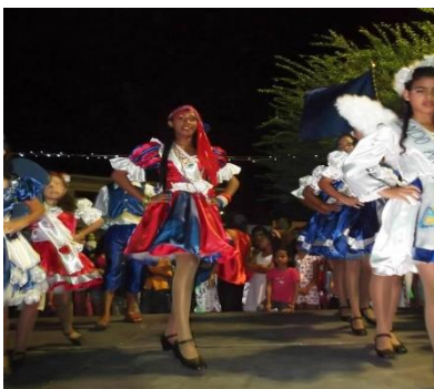
Figura 08: Entrada da Cigana da Lapinha. Praça dos Trabalhadores – Dona Inês/PB.