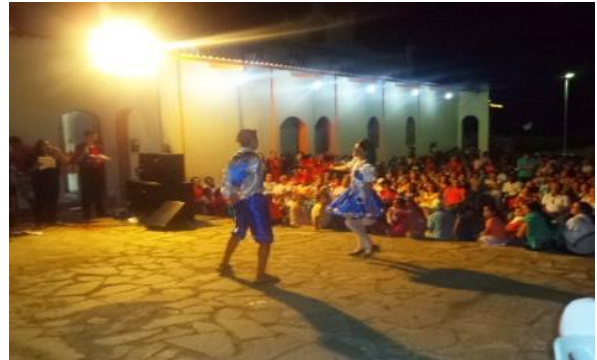
Figura 12: Libertação da Contra Mestra pelo Pastor. Lapinha como atração cultural no Novenário de Santa Inês e São Sebastião – Dona Inês/PB.