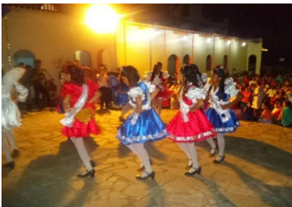
Foto 15: Despedida das pastorinhas. Lapinha como atração cultural no Novenário de Santa Inês e São Sebastião – Dona Inês/PB.