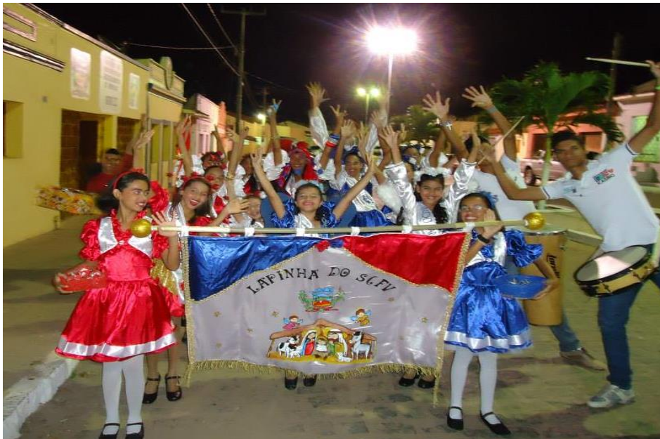
Figura 17: Cortejo da Lapinha pelas ruas de Dona Inês/PB.