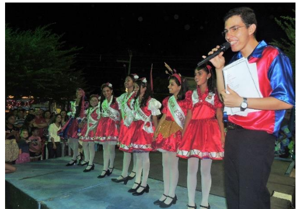
Foto 16: Anuncio do cordão vencedor da Lapinha. Praça dos Trabalhadores – Dona Inês/PB.